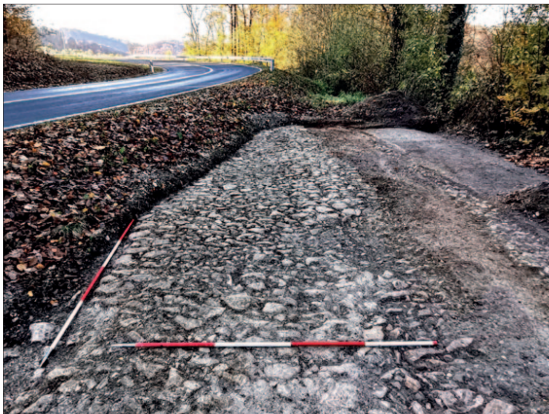
Sl. 1 Fotografija segmenta popločanja otkrivene ceste

nje kompaktan. Kameno popločanje ceste je istraženo u ukupnoj dužini od 20 m, smjera pružanja istok – zapad, s prosječnom širinom od 3 m, a ako ubrojimo i proširenje ceste prema sjeveru onda iznosi prosječno 4,5 m (sl. 1). Prilikom ovih istraživanja nisu pronađeni nikakvi sitni nalazi koji bi upućivali na antičku dataciju ove ceste. Također, prilikom temeljitog čišćenja popločanja ceste, nisu uočeni kolotrazi (spurile), stoga zasada ne možemo potvrditi da se radi o rimskoj cesti.