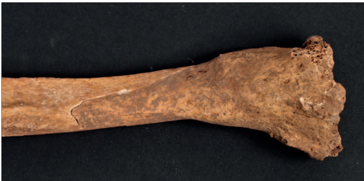
Sl. 8 Zarasla antemortalna fraktura na distalnom dijelu lijeve palčane kosti iz groba 5