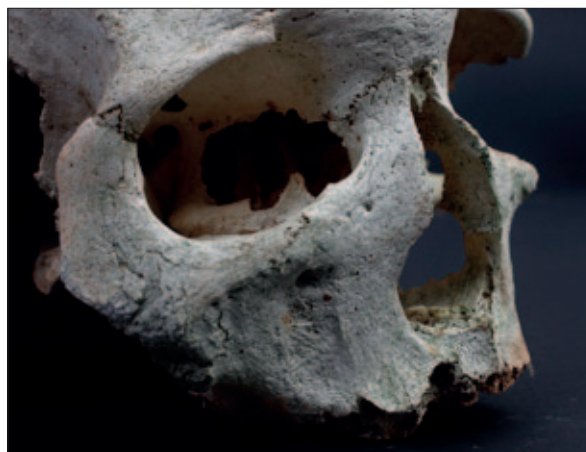
Sl. 4 Proširenje nosnog otvora i atrofija koštanog trna na dodatnoj lubanji iz groba 1

Fig. 3 Lipping on the third and fourth lumbar vertebrae from grave 1