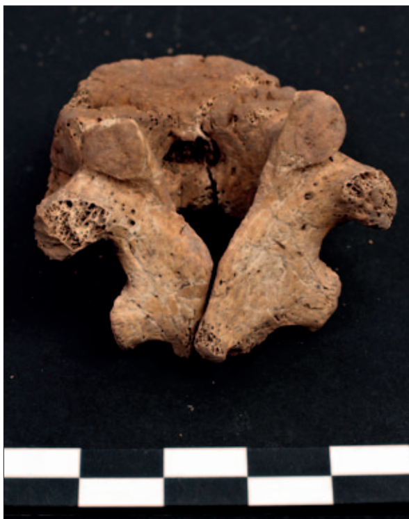
Sl. 6 Spina bifida occulta na stražnjem luku jedanaestog prsnog kralješka iz groba 2 (snimio: H. Jambreč)