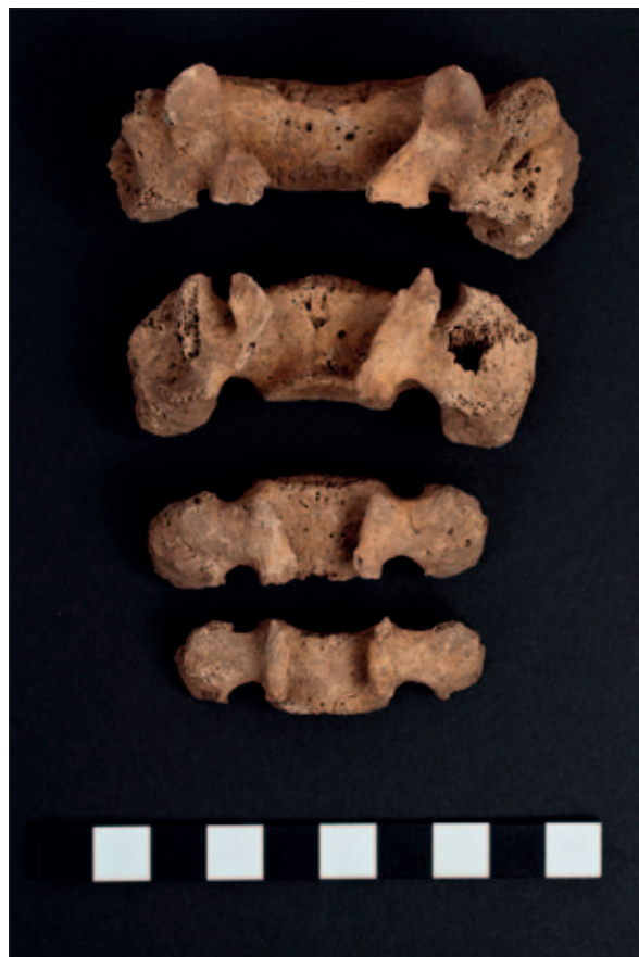
Sl. 7 Spina bifida occulta na križnoj kosti iz groba 3

Antropološka istraživanja na novovjekovnim populacijama na području Dalmatinske zagore su rijetka. Prvo takvo istraživanje provedeno je na koštanom materijalu s lokaliteta Koprivno kod Križa (Novak 2004;