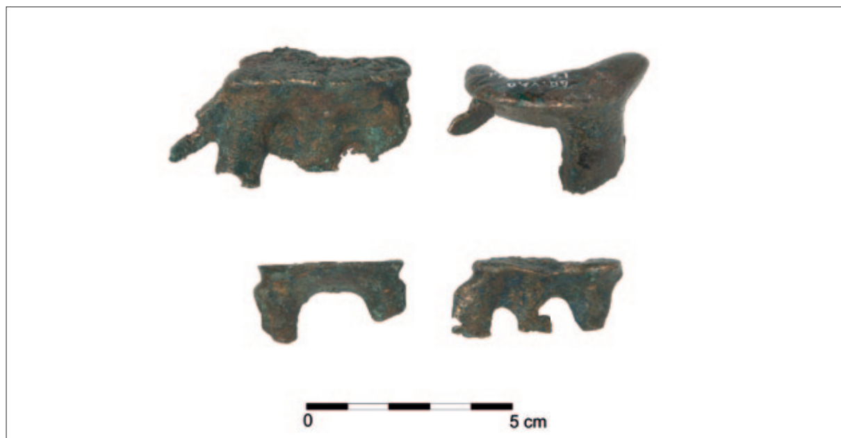
Sl. 3 Uljevne kape (njem. Gusszäpfen ) iz ostave Brodski Varoš (izradila: A. Kudelić)