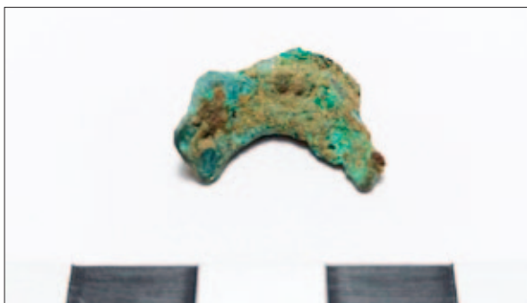
Sl. 4 Uljevna kapa iz ljevačke radionice iz naselja Kalnik – Igrišće II