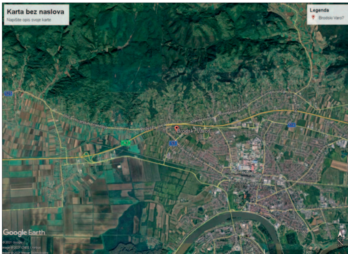
Sl. 2 Položaj Brodski Varoš u gradu Slavonki Brod