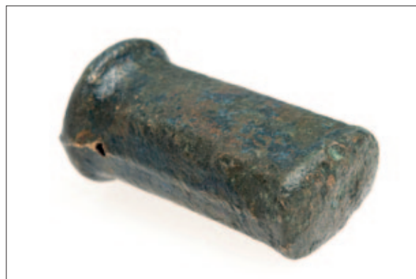
Sl. 5 Čekić s tuljcem za nasad drške iz ostave Brodski Varoš