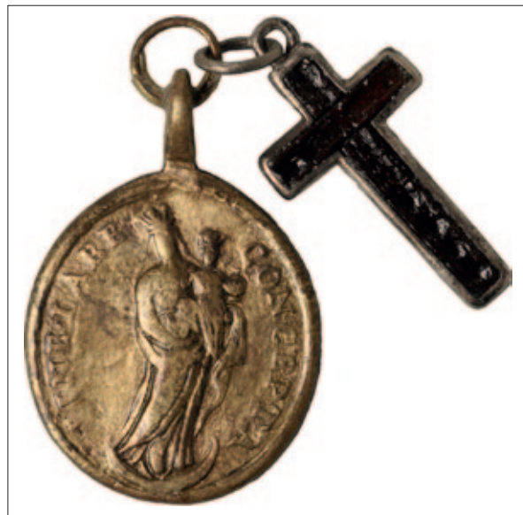
Sl. 4 Lice medaljice iz groba 253

U Hrvatskoj još nije objavljena niti jedna medaljica s prikazom sv. Florijana, 13 a one nisu česte niti u