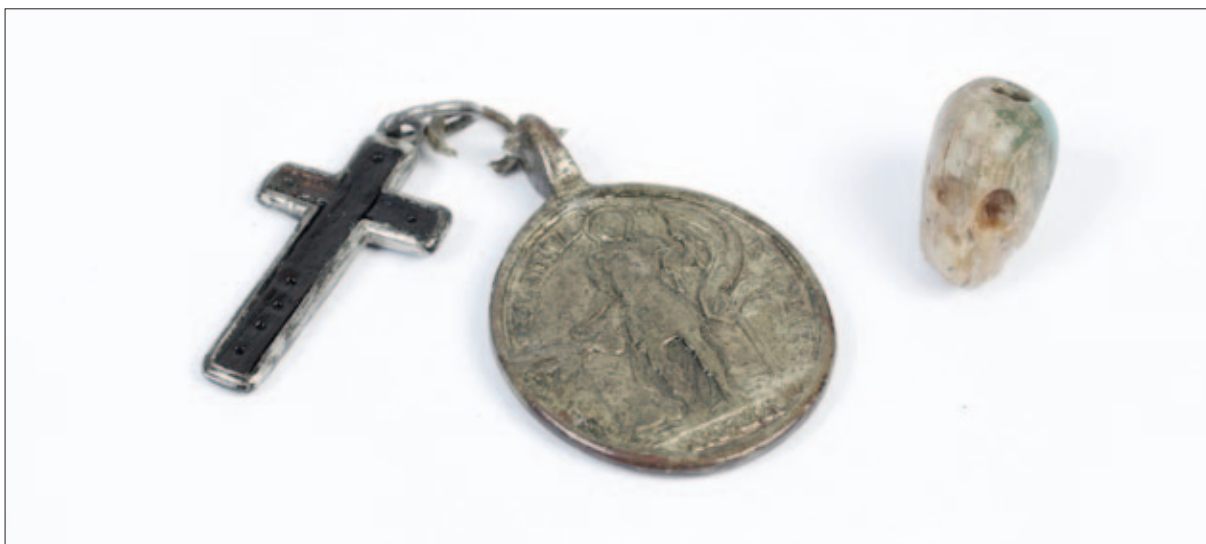
Sl. 3 Nabožni predmeti pronađeni u grobu 253

Fig. 2 Skeleton of the individual from grave 253