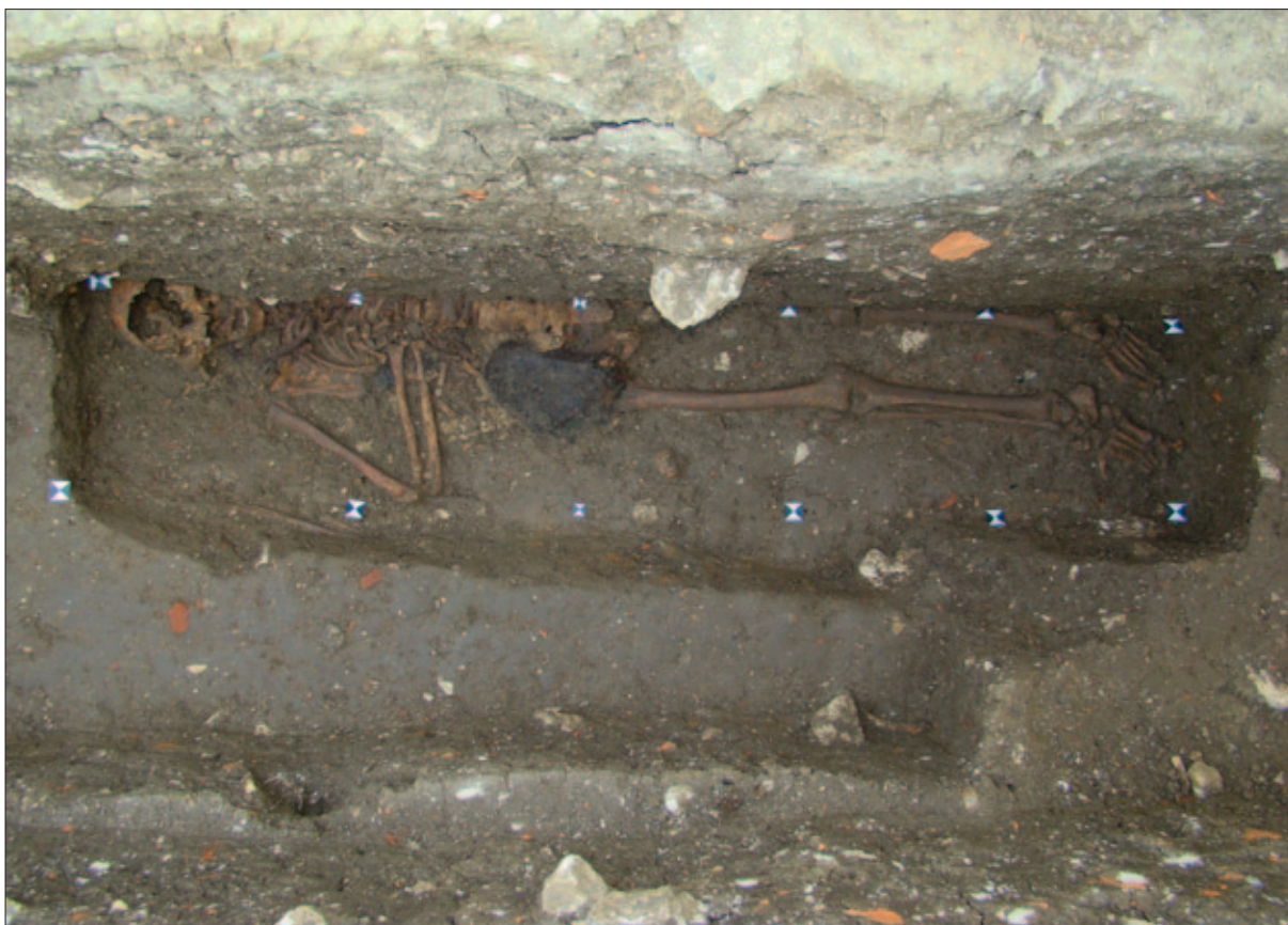
Sl. 2 Kostur pokojnika iz groba 253

Fig. 2 Skeleton of the individual from grave 253