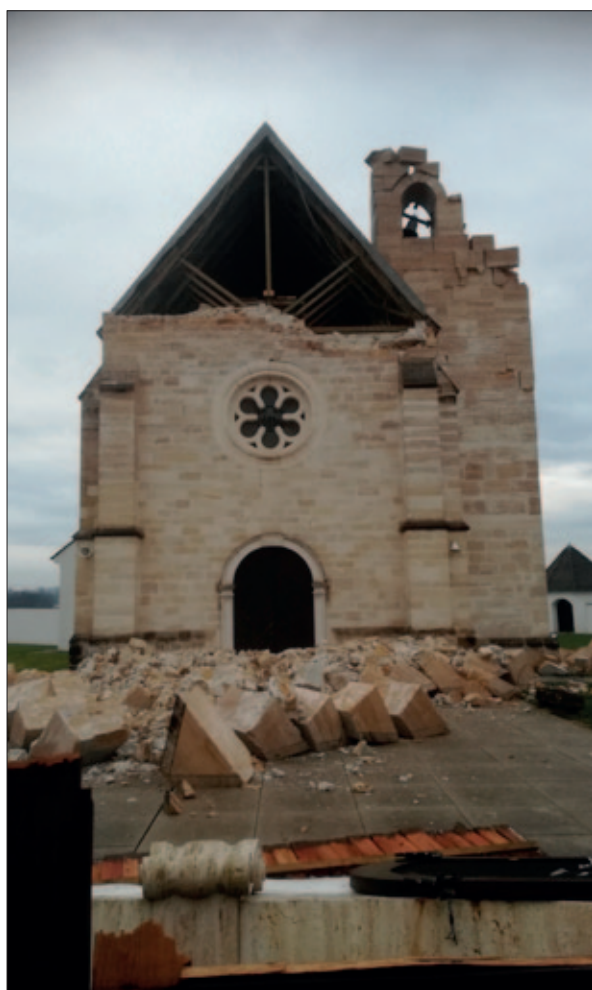
Sl. 1 Pogled na pročelje i zvonik svega nekoliko dana nakon potresa (snimio: S. Stingl, 2. siječnja 2021.)

gotičkom obliku (Miletić, Valjato Fabris 2014: 51). Radove su u više navrata pratila i arheološka istraživanja, prvo pod vodstvom Hrvatskog restauratorskog zavoda (Miletić 1999: 141–144; Azinović Bebek, Pleše 2004), a potom i Instituta za arheologiju (Belaj 2011; Belaj, Sirovica 2012). Uz brojne nalaze arhitektonske plastike te zidanih struktura iz svih građevinskih faza crkve (Miletić 1999: 144–147), otkriveno je i istraženo 426 grobova u više različitih horizonata ukopavanja (Belaj, Sirovica 2012: 58–59; Belaj et al. 2021). Kronološki najmlađi horizont nastao je po oslobođenju Gore i okolice od Osmanlija, 3 najvjerojatnije od vremena obnove župe 1705. godine, kada otprilike započinje i obnova crkvene građevine te njena „radikalna“ barokizacija, dovršena 1736. godine (Cvitanović 1971: 151–152). Tek se nekoliko grobova može datirati u taj najmlađi horizont ukopavanja, 4 a u arheološkim nalazima najbogatijem, grobu 253, pronađena je i religijska medaljica kojoj je posvećen ovaj rad.