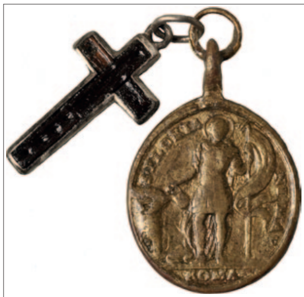
Sl. 5 Naličje medaljice iz groba 253

S obzirom na malobrojnost objava s prikazom sv. Florijana i, posljedično, malobrojnost komparativnih podataka, drugovrni podaci mogu pomoći u rasvjetljavanju uporabe i značenja gorske medaljice. Etnografski podaci o pobožnostima i štovanju svetaca, premda se odnose na novije vrijeme, često upućuju na oblike vjerskih praksi koje su na određenom prostoru prisutne kroz dulji vremenski protek. Time takvi podaci mogu pomoći u pokušaju razumijevanja starijih kulturnih pojava.