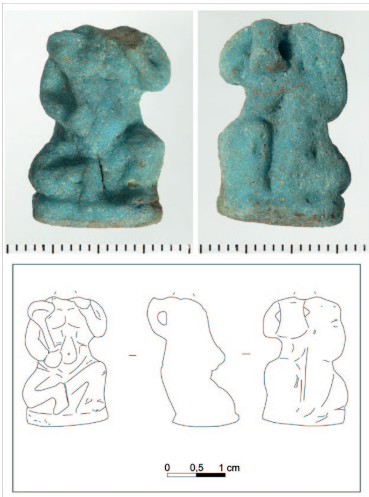
Sl. 2 Fotografija i crtež privjeska iz Crikvenice (crtež: S. Čule vektorizacija: A. Konestra)