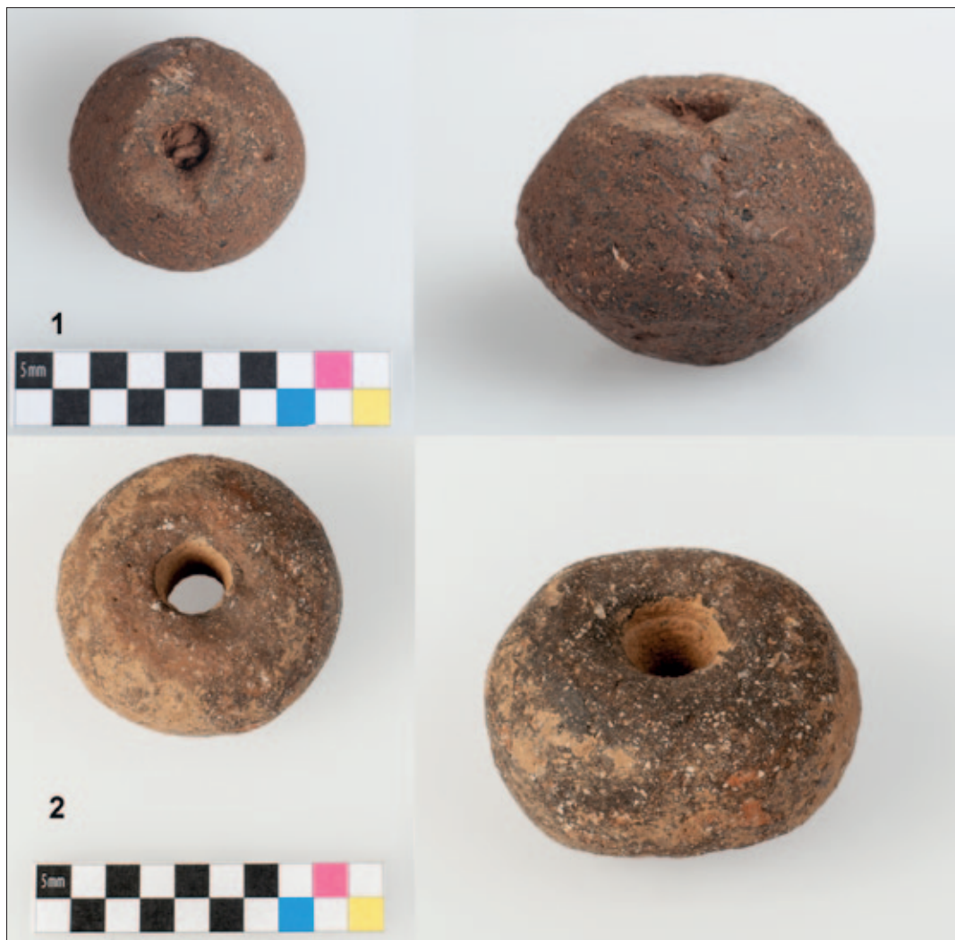
Sl. 6 Keramički pršljeni: 1 PN-9, sonda 8/2014; 2 PN-52, sonda 4/2013