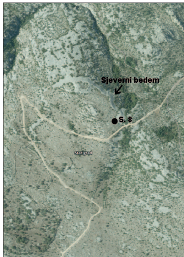
Sl. 2 Pozicija sonde 8 istražene 2014. godine (modificirano prema: Geoporttal DGU).

Najlošije očuvani ulomak (sl. 3: 4 – težina ulomka: 83 g) mogao je pripadati utegu valjkastog oblika s proširenim krajem slično drugome, bolje očuvanome