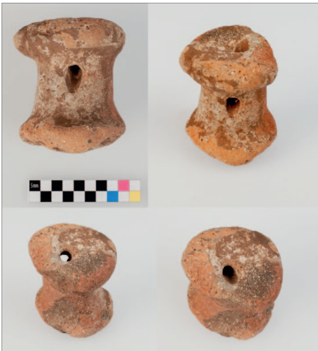
Sl. 5 Keramički kalem s Gradine Sv. Trojice: N-12, sonda 8/2014