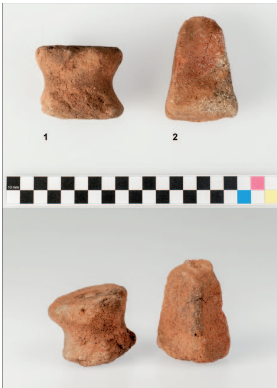
Sl. 4 Keramički kalemi i uteg s Gradine Sv. Trojice: N-6, sonda 8/2014.