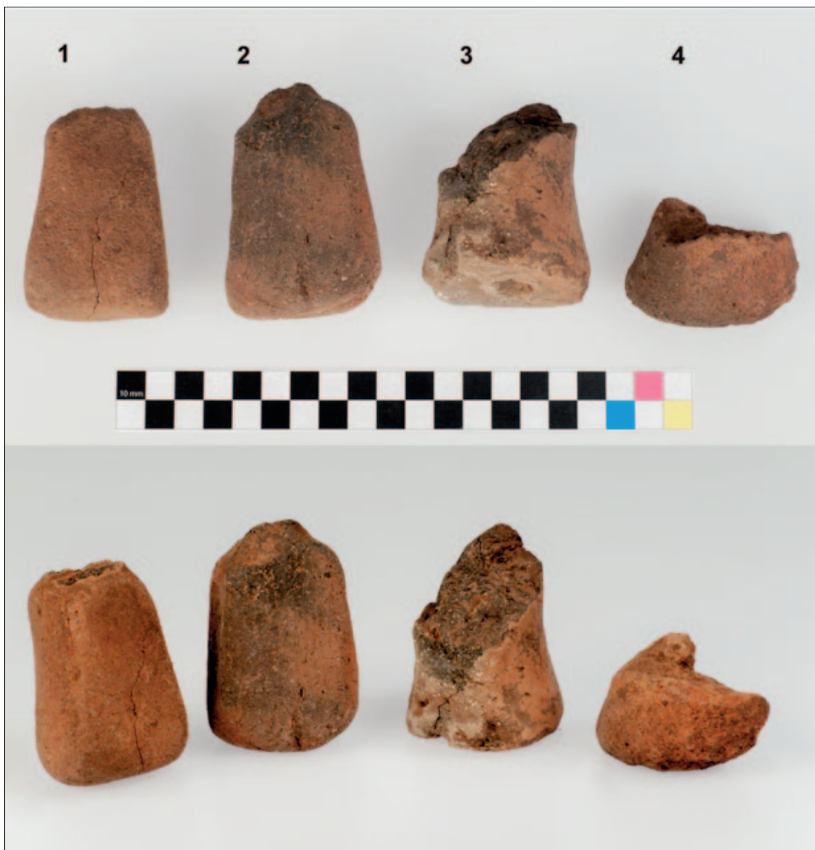
Sl. 3 Keramički utezi s Gradine Sv. Trojice: N-10, sonda 8/2014.