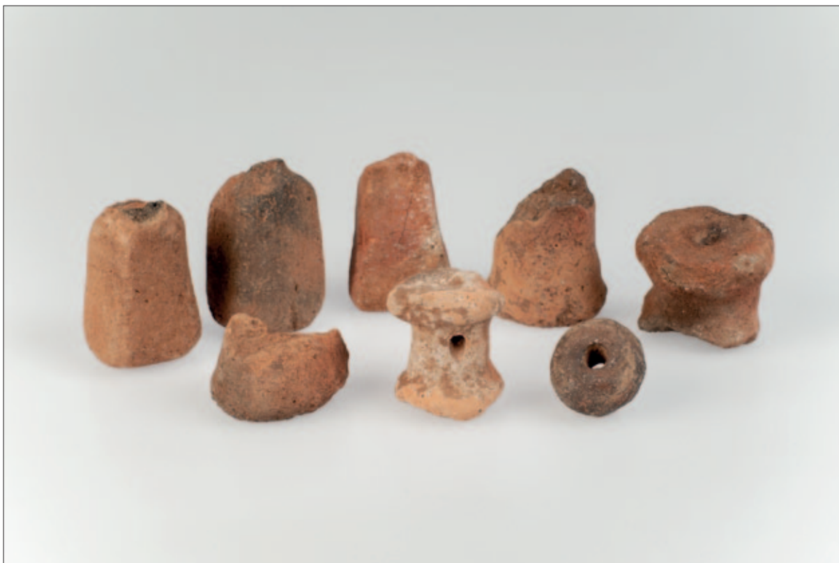
Sl. 1 Keramički pribor za izradu tekstila s Gradine Sv. Trojice.

Fig. 1 Ceramic tools for textile production from Gradina Sv. Trojice