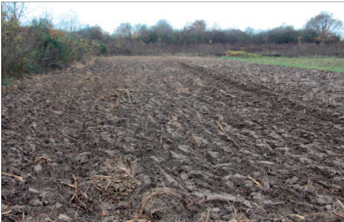
Sl. 2 Tumul 15 prije istraživanja