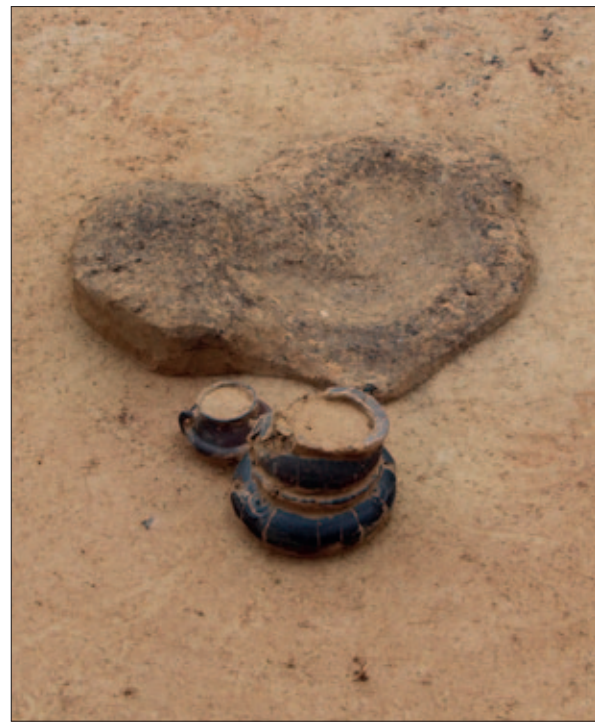
Sl. 4 Grob 1 u tumulu 15

Istraživanjem tumula 15 otkriven je grob 1 koji se prema pogrebnom ritualu i priložima pronađenim u grobovima može povezati s istraženim tumulima 5 i 6 s kojima je podignut u nizu. Jedna od arheoloških pretpostavki je da je možda bliski mlađi član obitelji sahranjen pod tumulom 15 zbog manje količine spaljenih kostiju i grobnih priloga. Kasnije provedene neovisne