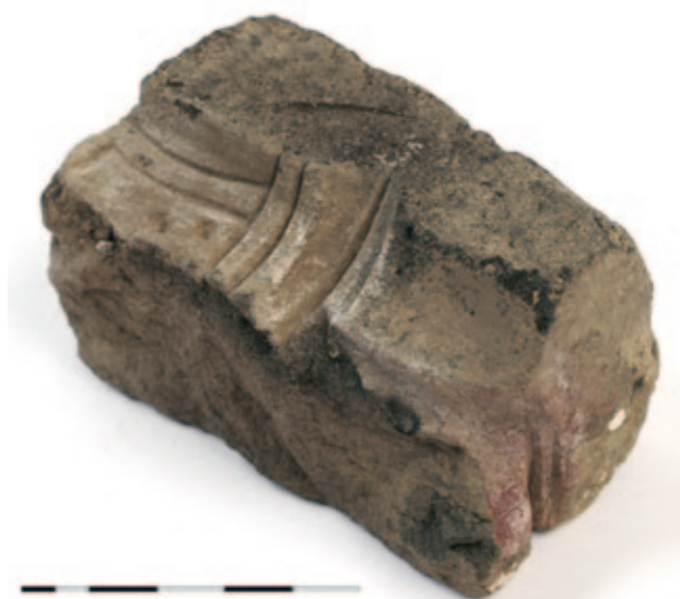
Sl. 2 Ulomak kalupa za lijevanje šuplje sjekire s nalazišta Kalnik - Igrišće II Fig. 2 Fragment of a bronze casting mould for a socketed axe from the Kalnik - Igrišće II site

Dimenzije kalupa su 6,5 x 6,8 x 6,5 cm. Uljevna šupljina ima izrazito crnu boju koja je posljedica djelovanja visoke temperature na kalup. Dodirna površina dvaju jezgrenika je vrlo fino izbrušena, kao i još dvije obrađene plohe kalupa. Na osnovi negativa urezanog predmeta moguće je reći da se radi o lijevanju šuplje sjekire ili kelta, ali se ne može ništa