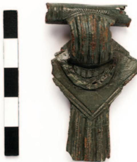
Sl. 2 Ostrovo – Sokolovac. Fibula ( Distelfibel ) s rombičnom pločicom tipa Feugère 19 Fig. 2 Ostrovo–Sokolovac. Brooch ( Distelfibel ) with a rhombic plate of type Feugère 19

Horizontu 1. stoljeća općenito pripada jako malo predmeta s nalazišta Sokolovac, no na taj se horizont vrijedi osvrnuti budući da je riječ o vrlo zanimljivome razdoblju rimskih osvajanja međurječja Save, Drave i Dunava te kasnijem formiranju administrativno-upravne vlasti, a u