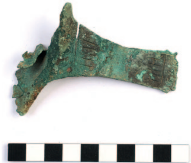
Sl. 3 Ostrovo – Sokolovac. Ulomak ručke brončane kaserole

Idući horizont vojne prisutnosti na Sokolovcu pripada drugoj polovici 2. i 3. stoljeću. Ovome horizontu pripada većina prikazane građe koja pripada pojasnim garniturama i konjskoj ormi, a koja se većinom može, bez mnogo dvojbi, povezati s rimskom vojnom opremom. Prstenasti element obročastoga oklopa tipa Newstead nesumnjivo pripada u sferu militarie . Ipak, uvijek ostaje mogućnost da je dio predmeta, poput konjske opreme, mogao biti korišten i u civilnome kontekstu. Ostaje pitanje tumačenja pojave vojne opreme ovoga razdoblja na tom položaju. S obzirom na brojne analogije za prikazanu građu u kontekstima povezanim s auxilijarnim postrojbama (v. Oldenstein 1976; Gschwind 1998; obročasti oklop kao dio auxilijarne opreme: Nicolay 2007: 21), isto tumačenje moglo bi se ponuditi za materijal koji potječe sa Sokolovca.