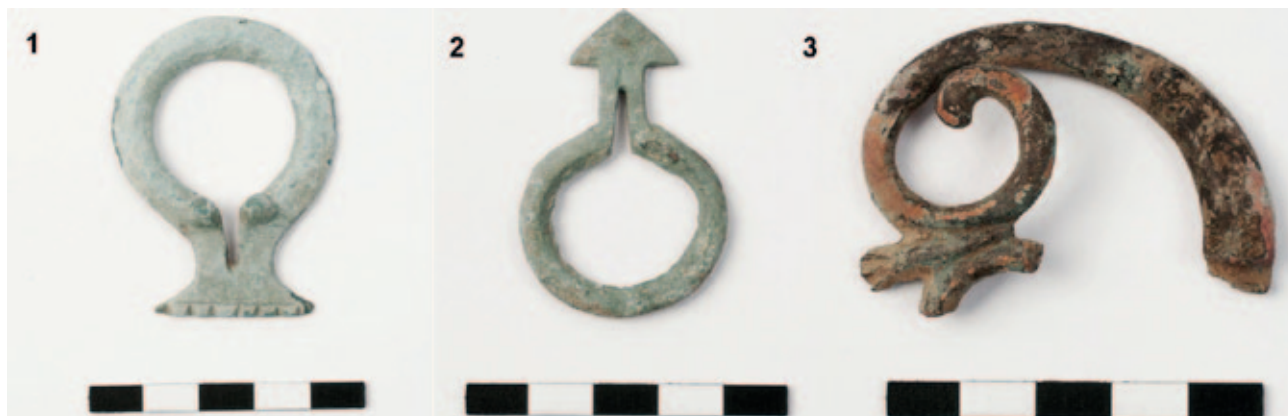
Sl. 1 Ostrovo – Sokolovac. 1–2 Prstenaste kopče, 3 ulomak pređice ili ukrasnog okova Fig. 1 Ostrovo–Sokolovac. 1–2 Ring buckles, 3 fragment of a belt buckle or decorative fitting