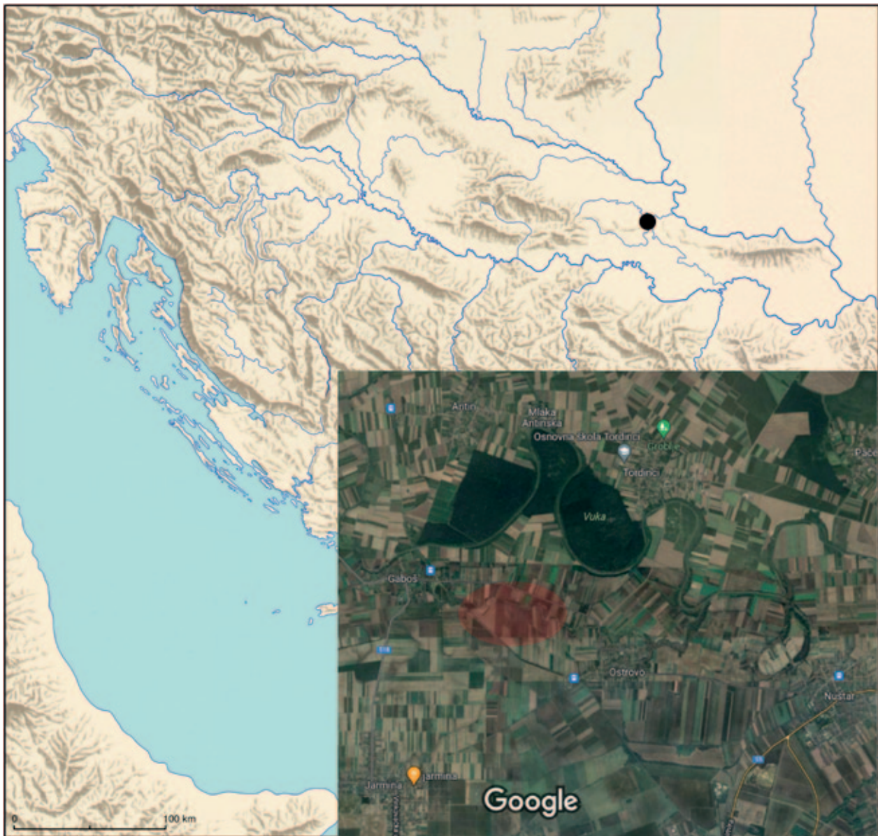
Karta 1 Položaj lokaliteta Ostrovo – Sokolovac (slijevu kartu izradio T. Kaniški za Institut za arheologiju, Zagreb; obradila: A. Tonc)

Terenski pregledi poduzimani su u različita doba godine te su tijekom njih prikupljeni brojni površinski nalazi iz svih razdoblja, pri čemu su oni iz antike daleko najbrojniji, a potom slijede oni iz mlađega željeznog doba. Na zapadnome kraju nalazišta uočena je i veća koncentracija rimskih opeka koja ukazuje, pored prikupljenih nalaza, kako se vjerojatno radi o naselju koje se smjestilo uz prometnicu koja je povezivala Cibalae s Mursom. Očuvanost predmeta varira i većina se oštećenja najvjerojatnije može pripisati aktivnostima povezanim s poljoprivrednim radovima. Oranjem je većina nalaza i dospjela na samu površinu, ali ujedno ta aktivnost može dovesti do fragmentacije predmeta ili oštećenja uslijed kojih dolazi do lomova. Okolnosti nalaza stoga ne dopuštaju spekuliranje o izvornom stanju i načinu dospjeća predmeta u sloj, primjerice je li ponekad riječ o namjerno