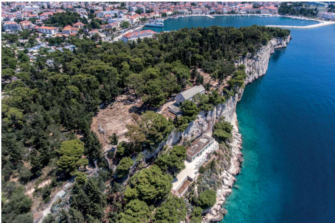
Sl. 1 Gradinska zaravan poluotoka Sv. Petar u Makarskoj tijekom arheoloških istraživanja 2020. godine Fig. 1 The hillfort plateau of the Sv. Petar peninsula in Makarska during the 2020 archaeological excavations

kampanjama 2011. – 2012. i 2014. – 2021. 3 Već je prva istraživačka kampanja 2011. godine pokazala jasniju kronološku stratigrafiju lokaliteta. Rezultatima istraživanja korigirana je pretpostavka o njegovom zasnivanju u razvijenom brončanom dobu te dokazala kako je do toga došlo još u završnom eneolitiku, odnosno prijelazu u rano brončano doba. Nalazi finijeg crvenopremazanog keramičkog posuđa, sjevernoafričkih i istočnomediteranskih radionica, kao i amfora, potvrdili su kontinuitet gradinskog položaja sve do prve polovine 7. st. po Kr. (Tomasović 2012: 620–625). Ovi nalazi iz druge polovine 6. do sredine 7. st. po Kr. već tada su jasno upućivali na prenaplašavanje „razaranja” Muccuruma od strane Gota 549. g. po Kr. Prostrana kasnoantička