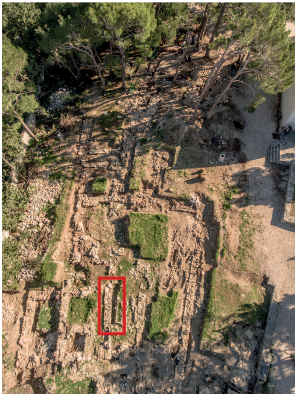
Sl. 3 Zapadna strana gradinske zaravni poluotoka Sv. Petar u Makarskoj tijekom arheoloških istraživanja 2020. godine – označen položaj iskopa željeznodobnog sloja uz temeljnu stopu zida kasnoantičke prostorije Fig. 3 The western side of the hillfort plateau on the Sv. Petar peninsula in Makarska during the 2020 archaeological excavations – the position of the Iron Age layer excavation next to the wall footing of a late antique room is marked

je izrađena od nepročišćene smeđe gline s usitnjenim kristalnim vapnencem, čime ima izgled grubog željeznodobnog posuđa. 5 Analogiju za takvu izradu Korint B amfore predstavlja obod nađen podno gradina Stina na Korčuli i na Sokolu (Borzić 2017: 8, sl. 1; Katić, Kapetanić 2023: T. XVIII: 11). Pretpostavljamo da pronađeni primjerci predstavljaju početnu proizvodnju ovog tipa amfore na istočnom Jadranu početkom 4. st. pr. Kr., prije njegovog standardiziranja te upućuju na izradu u Farosu (Katić, Kapetanić 2023: