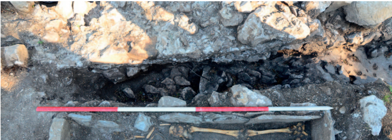
Sl. 2 Iskop željeznodobnog sloja uz temeljnu stopu zida kasnoantičke prostorije – u prednjem planu srednjovjekovni grob

Na istočnom Jadrano mogućnost za arhajske Korint B amfore vidjela se u jednom nalazu oboda s gradine Sokol u Dunavama (Katić, Kapetanić 2023: 95–96, 101, T. XIX: 1). Možda su ovi nalazi prispjeli na gradinu Sv. Petar kao rezultat pljačkaških pohoda Ardiječaca ili darivanja grčkih pomoraca prilikom njihovih trgovačkih aktivnosti na Caput Adriae . U istom iskopu uz stopu zida, u kontaktu sa stratigrafski