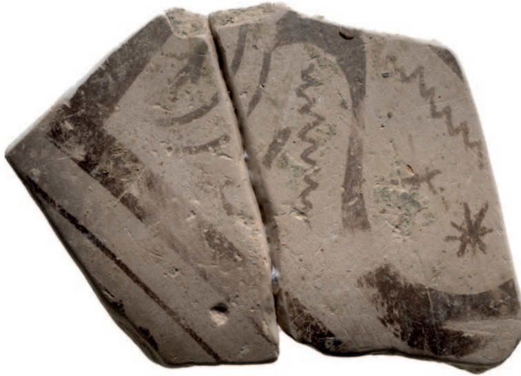
Sl. 4 Ulomak oslikane posude kasnogeometrijskog stila pronađen 2020. godine (GMM, Inv. br. A/K 1815/20) Fig. 4 Fragment of a painted vessel in the Late Geometric style found in 2020 (GMM, Inv. no. A/K 1815/20)

Dijelovi Korint Bamfora na lokalitetu Sv. Petar u Makarskoj potvrđuju razvijenost i prostorno širi značaj njegove željeznodobne faze. Naglašavaju i njihovu izuzetnost na istočnom Jadranu, kada je riječ o arhajskom tipu, ili potvrđuju ispravnost pretpostavke o njihovom grubljem izgledu u početku izrade u radionicama Farosa. 7 Na taj način upotpunjuju indikativnu južniju obalnu topografsku crtu nalaza, od Sokola u Konavlima i Korčule do makarskog Sv. Petra nasuprot otoka Hvara.