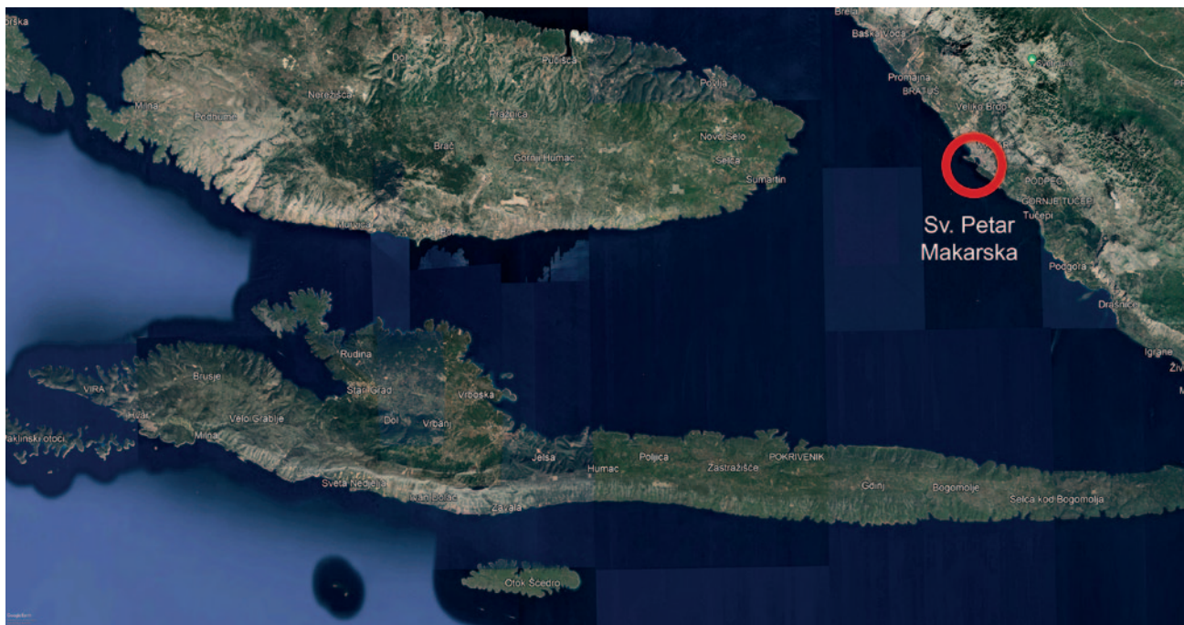
Karta 1 Položaj gradine Sv. Petar u Makarskoj u bračko-hvarskom akvatoriju (podloga: Google maps; računalna obrada: Dominik Glučina – Duplo više d.o.o.) Map 1 Location of the Sv. Petar hillfort in Makarska within the Brač–Hvar archipelago (base map: Google Maps; digital processing: Dominik Glučina – Duplo više d.o.o.)