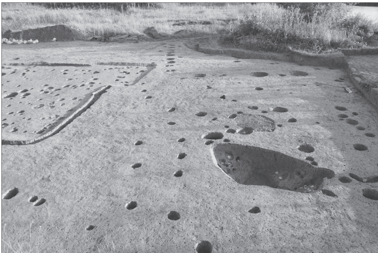
Sl. 5 Slavonski Brod, Galovo, jama 1155 (bunar?) istočno od nadzemnog objekta.