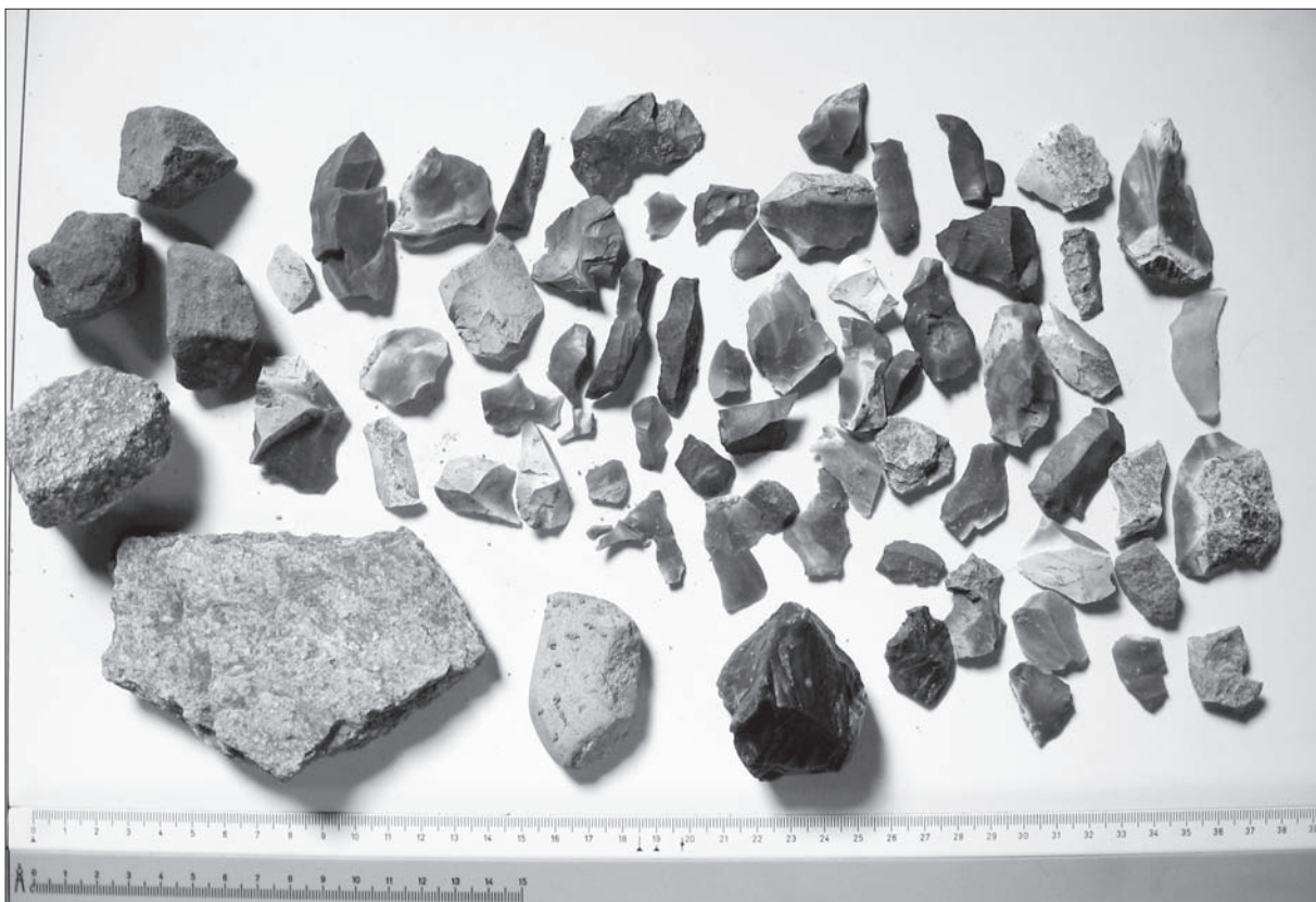
Sl. 6 Slavonski Brod, Galovo, dio kamenih izradevina otkrivenih 2009. g. (snimila: K. Minichreiter).