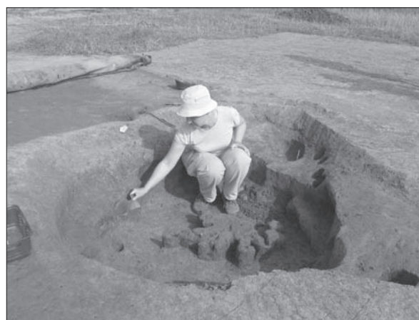
Sl. 2 SlavonSKI Brod, Galovo, istraživanje jame 323.

U □ I/9, I/10, J/8, J/9, J/10, K/8, K/9 i K/10 otkriveni su ostaci nadzemnog objekta, za sada najstarijega nadzemnog objekta ranog neolitika u kontinentalnoj Hrvatskoj. Temelji zatvaraju prostor u vodoravnoj projekciji pravokutnog oblika 7 x 7 m i to na zapadnoj, južnoj i istočnoj strani dok je prema sjevernoj strani objekt otvoren i krovnu konstrukciju je držao niz stupova na određenim razmacima. Temelji nadzemnog objekta sastojali su se od ukopanih rovova širine u prosjeku 30 cm, u koje su bili gusto poredani veći i manji okomiti drveni stupovi, promjera od 15 do 25 cm. Sjeverni završetak zapadnog temelja sastojao se od plitko ukopanoga velikog stupa, promjera 30 cm i male istake prema SI, dok istočni temelj na sjevernoj strani završava velikim stupom promjera 40 cm. Na sredini istočnog