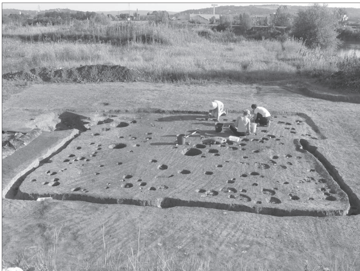
Sl. 4 Slavonski Brod, Galovo, istraživanje nadzemnog objekta 955.