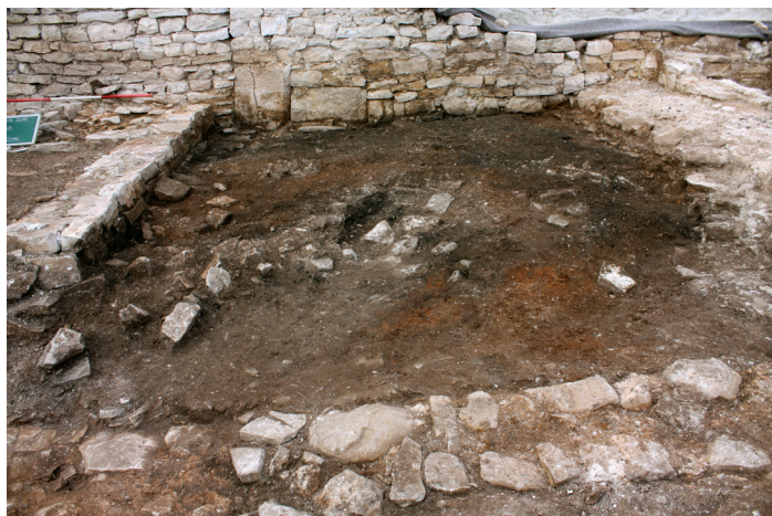
Fig. 3 - Piano di frequentazione di un atelier per la lavorazione del ferro.

all'ambito cronologico romano-tardoantico, ma su un'area troppo limitata per permetterne un'interpretazione dettagliata. La ripulitura dell'area meridionale del complesso (ambiente 8) ha invece permesso di mettere in luce una cisterna di cospicue dimensioni e conservata fino all'imposta delle volte della copertura. Appunto a questa possente struttura, realizzata con murature a due paramenti intermezzati da un riempimento di pietrame sminuzzato misto a malta, si appoggiano o si impostano le successive strutture del complesso. A ovest della cisterna si sviluppa una serie di strutture murarie e stratigrafie che permettono di leggere con più chiarezza le fasi cronologiche che interessarono il sito rurale romano, e che tra l'altro permisero di porre le cisterne nella sua prima fase.