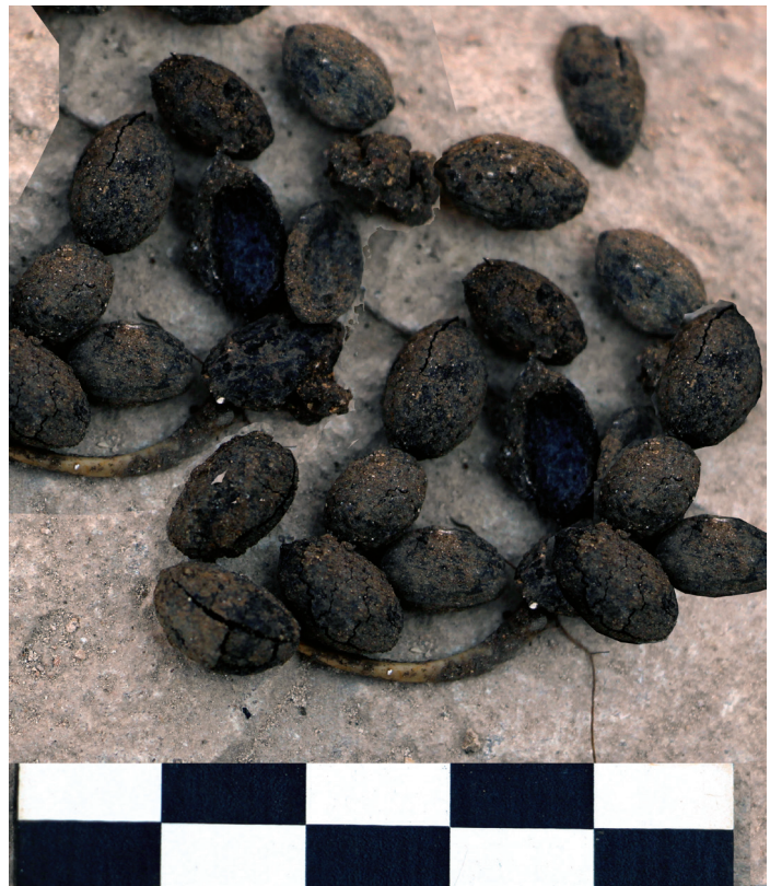
Fig. 11 – Noccioli di oliva carbonizzati e altri residui organici provenienti dal deposito interno alla porta del circuito murario medievale (foto di Enrico Cirelli).

china, tagliato da una profonda fossa riempita dalle stesse macerie che coprivano anche l'installazione con i residui organici identificata sul lato ovest del saggio. La rimozione del riempimento ha consentito l'individuazione delle fondazioni dei due muri, costruiti contemporaneamente al muro