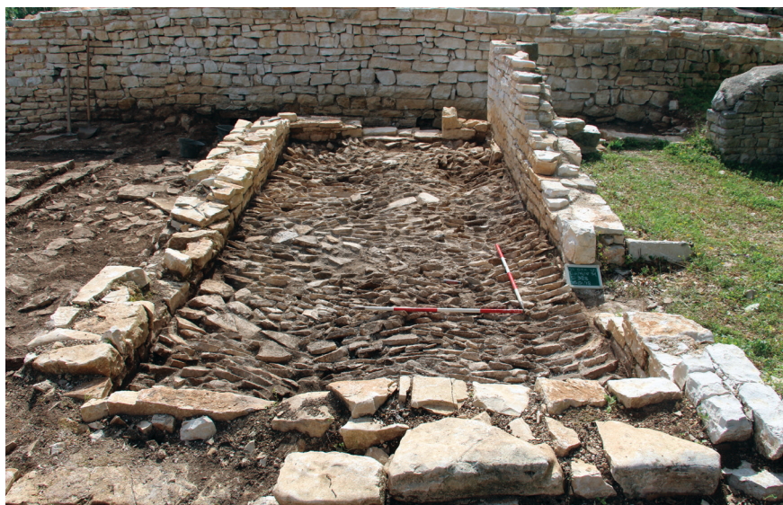
Fig. 6 – Preparazione in blocchetti posti in obliquo per il sacello funerario, visto da est.

impostata su una piccola struttura addossata al muro perimetrale della chiesa. Questo ambiente è quindi certamente posteriore alla costruzione della piccola chiesa. Non è chiaro però il momento in cui venne realizzato e non dovette essere molto successivo all'edificio religioso. Le sue fondamenta sono infatti legate e quindi l'ambiente fa parte di una progettazione originaria, forse realizzata però in un momento successivo. Non vi era inoltre una porta di comunicazione diretta tra i due ambienti. Per entrare nella chiesa bisognava quindi necessariamente uscire dall'ambiente e immettersi nel corridoio che separava questi spazi dalla torre e dalla cisterna romana. Asportando gli strati che lo riempivano, sono stati individuati due piani di frequentazione: il primo certamente associato alla frequentazione dei due ambienti e addossato al paramento della cisterna romana; il secondo è più antico e si imposta su un cordolo, forse legato solo alla fase romana del sito 23 .