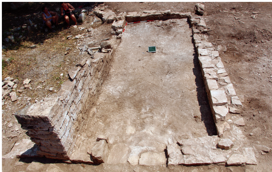
Fig. 5 – Pavimento in malta del sacello funerario posto a nord della chiesa altomedievale, visto da ovest.