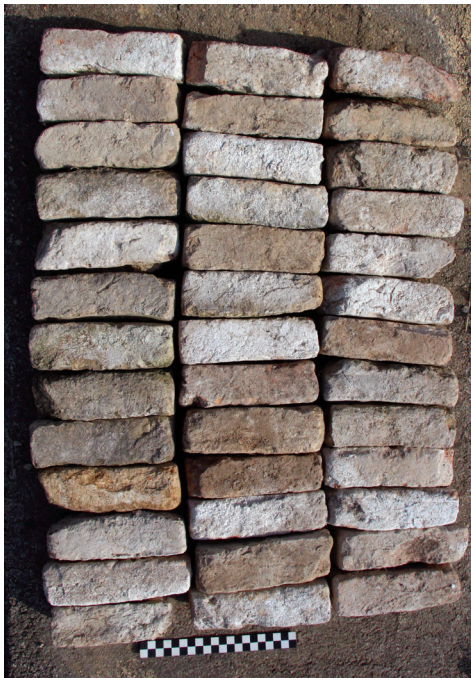
Fig. 9 – Campionatura di alcuni mattoni gotici per ghiera da finestra (XIV sec.), rinvenuti sul lato sud del villaggio tardomedievale.