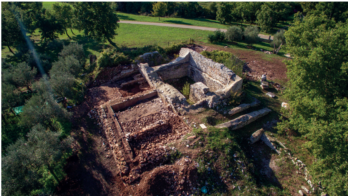
Fig. 15 – Il sito di Tarovec visto dall'alto, prima degli scavi del 2016.

utilizzata anche tra VII e VIII secolo e che subì un grande rifacimento nel corso del IX secolo 35 . Contemporaneamente vennero ripopolati alcuni siti di origine preistorica, come Ursaria , Ruginium e Piranon 36 e forse Stari Gočan 37 , e vennero insediati nuovi centri, probabilmente legati a installazioni militari, come nel caso di Koper/Capodistria 38 e forse Izola/Isola d'Istria. Non tutti gli studiosi sono concordi sulla cronologia in cui vennero insediati questi siti fortificati, forse nel V secolo 39 , forse più tardi dopo la vittoria dell'esercito di Giustiniano sugli Ostrogoti, nella metà del VI secolo 40 . I dati archeologici sulle trasformazioni di questo paesaggio in questa delicata fase di passaggio sono ancora scarsi, come in diverse zone dell'Europa del resto 41 . Avvolte nei fumi dell'epica, evanescenti, sono anche le fasi di 'passaggio', in questo territorio, delle popolazioni slave 42 , fin ora riconosciute archeologicamente soltanto a livello di necropoli.