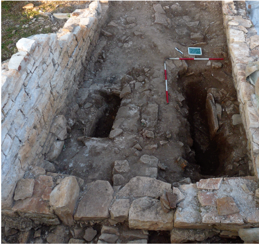
Fig. 7 – Fosse di sepoltura rinvenute nel sacello della chiesa altomedievale.