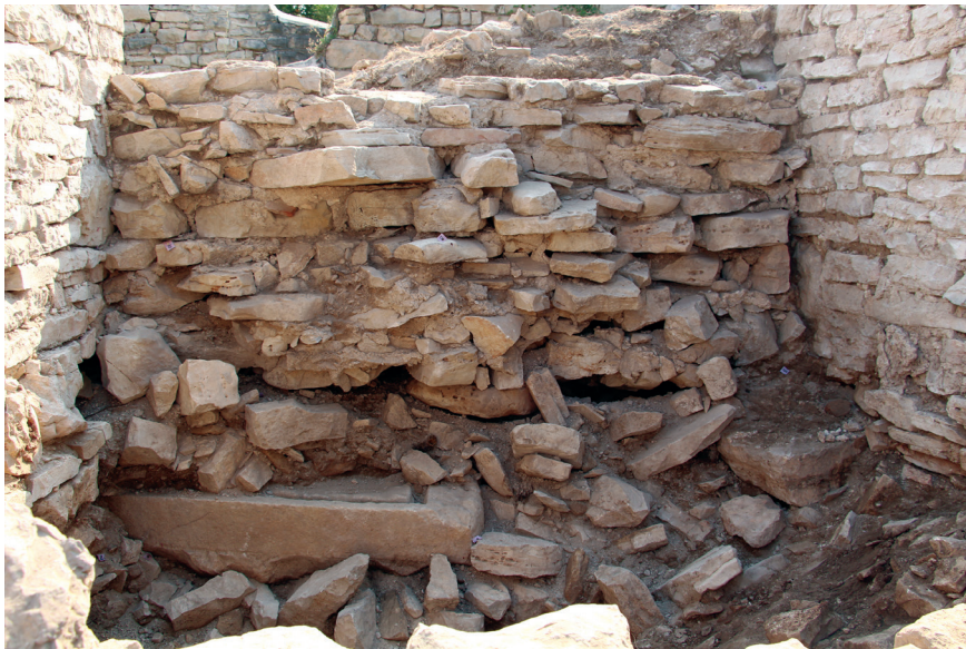
Fig. 8 – Strutture di imposta della porta del villaggio medievale, vista da ovest. In basso a sinistra: lastra in calcare appartenente a un torcular per la produzione di olio di oliva.

Nell'ultima campagna di scavi (2018) è stato rimosso il pavimento in malta del sacello annesso alla chiesa. Vi è stato individuato uno straordinario piano di preparazione costituito da pietre poste in obliquo, steso su tutta la superficie dell'ambiente (Fig. 6). Si tratta di un vespaio, una sorta di rudus , necessario per stabilizzare e stendere il piano pavimentale in malta. Questo strato sigillava completamente il deposito archeologico sottostante. La sua rimozione ha consentito di rinvenire quattro sepolture in cassa, disposte agli angoli dell'ambiente che si connota quindi, nella sua fase originaria, come un sacello funerario (Fig. 7). Le sepolture