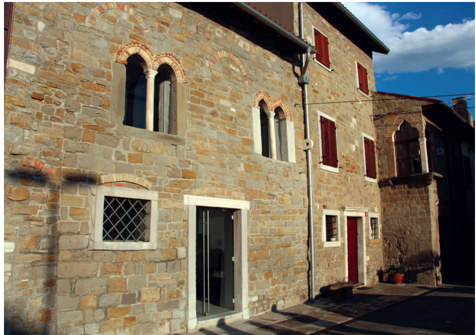
Fig. 10 – Palazzetto tardomedievale di Koper/Capodistria con ghiera di archetti in mattoni gotici.