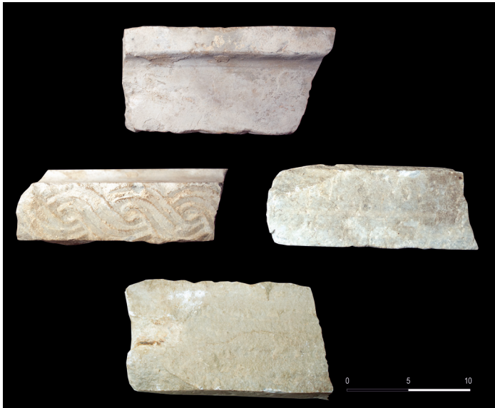
Fig. 13 – Cornice in marmo bianco decorata a intreccio.

accedeva attraverso una imponente soglia in pietra, rinveuta ancora in situ sul lato sud del sito. Nell'ultima campagna di scavi è stato individuato il piano di frequentazione in terra battuta, posto subito all'esterno di questo ambiente, frequentato, con molte fasi intermedie fino al XV-XVI secolo. All'interno degli strati di crollo è stato anche rinvenuto un frammento di cornice in marmo con decorazione a treccia, reimpiegato probabilmente nel rifacimento tardomedievale della torre, ma realizzato probabilmente su un blocco di recupero (Fig. 13).