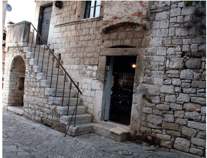
Fig. 14 – Ballatoio in muratura con proferulum di un palazzetto tardomedievale di Parenzo.

Come si evince dai dati finora a nostra disposizione, la prima fase di frequentazione del sito vede, già nella prima metà del I sec d.C., l'erezione di un complesso produttivo-residenziale. Una vocazione agricola, in primis olearia, può venir supposta, come si è visto, sulla base di diverse testimonianze materiali. L'articolazione del sito rimane però ancora sfuggente, anche se possiamo supporre una