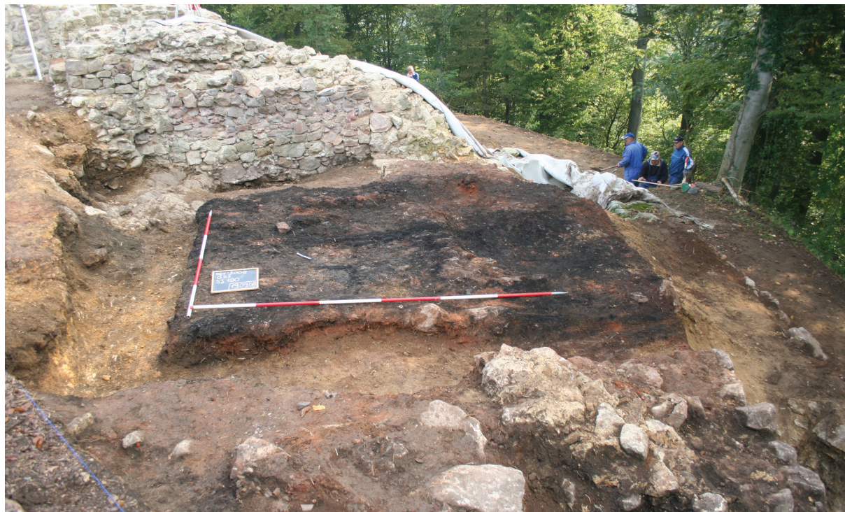
Sl. 1. Ostaci drvene kule iz 16. stoljeća.