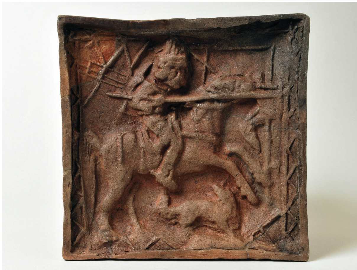
Sl. 2. Pećnjak sa scenom lova.