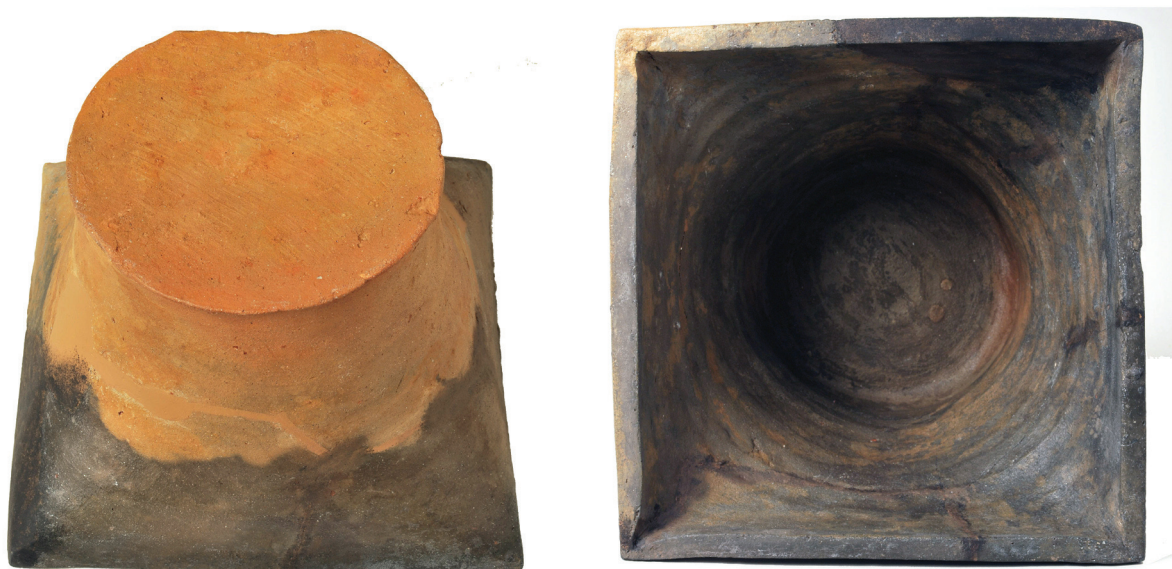
Sl. 4. Zdjelasti pećnjak četvrtastog otvora. Fig. 4. A bowl-shaped stove tile with a square opening.

Zdjelasti pećnjaci četvrtasta otvora jedan su od najučestalijih tipova jednostavnih pećnjaka otvorenih prema van, odnosno konkavnih pećnjaka. Zatvorenim dnom utisnuti su sve do ruba otvora u glinenu konstrukciju peći. Otvoreni udubljeni dio učinkovito povećava grijaću površinu peći. Razvili su se iz prvobitnih čašastih i lončastih pećnjaka. Upotrebljavaju se u dugom vremenskom razdoblju na kaljevim pećima iz 14. st. pa sve do seoskih peći iz prve polovine 20. stoljeća 27 te nisu građa pogodna za preciznije datiranje. Iz lončastih i zdjelastih konkavnih pećnjaka razvili su se i pećnjaci s prednjom dekorativnom pločom. S druge strane, taj se tip pećnjaka razvija i iz konveksnih pećnjaka, odnosno onih čije je otvoreno dno bilo utisnuto u strukturu peći. Nakon 1500. godine, kada ostali oblici pećnjaka nestaju iz uporabe (npr. gotički nišasti), lončasti i zdjelasti pećnjaci zadržavaju se u uporabi na seoskim pećima, a na bogatijima se uglavnom koriste oni s ukrašenom prednjom dekorativnom pločom. 28