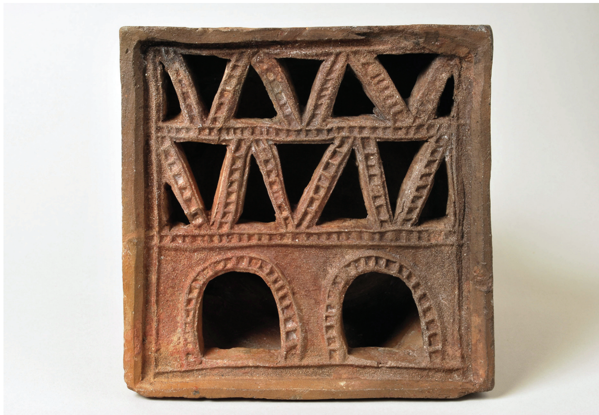
Sl. 3. Pećnjak s arhitektonskim i geometrijskim motivima.