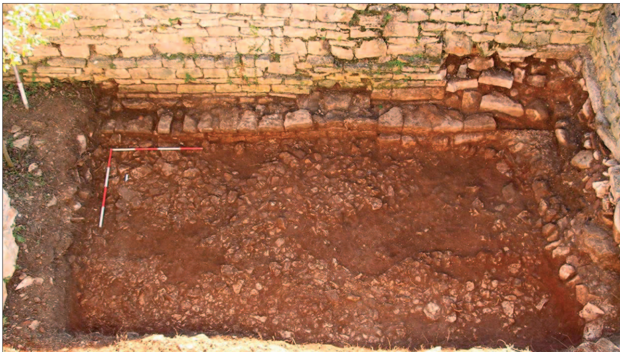
Sl. 6 P1 – sloj pripreme podnice