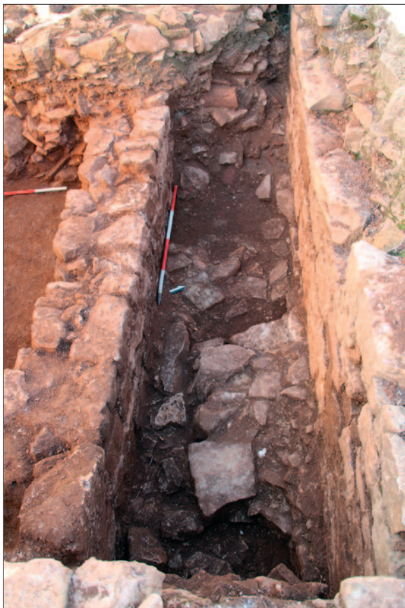
Sl. 3 Sloj SJ 174 između zida SJ 161 i cisterne

Fig. 3 Layer SU 174 between the wall SU 161 and the cistern