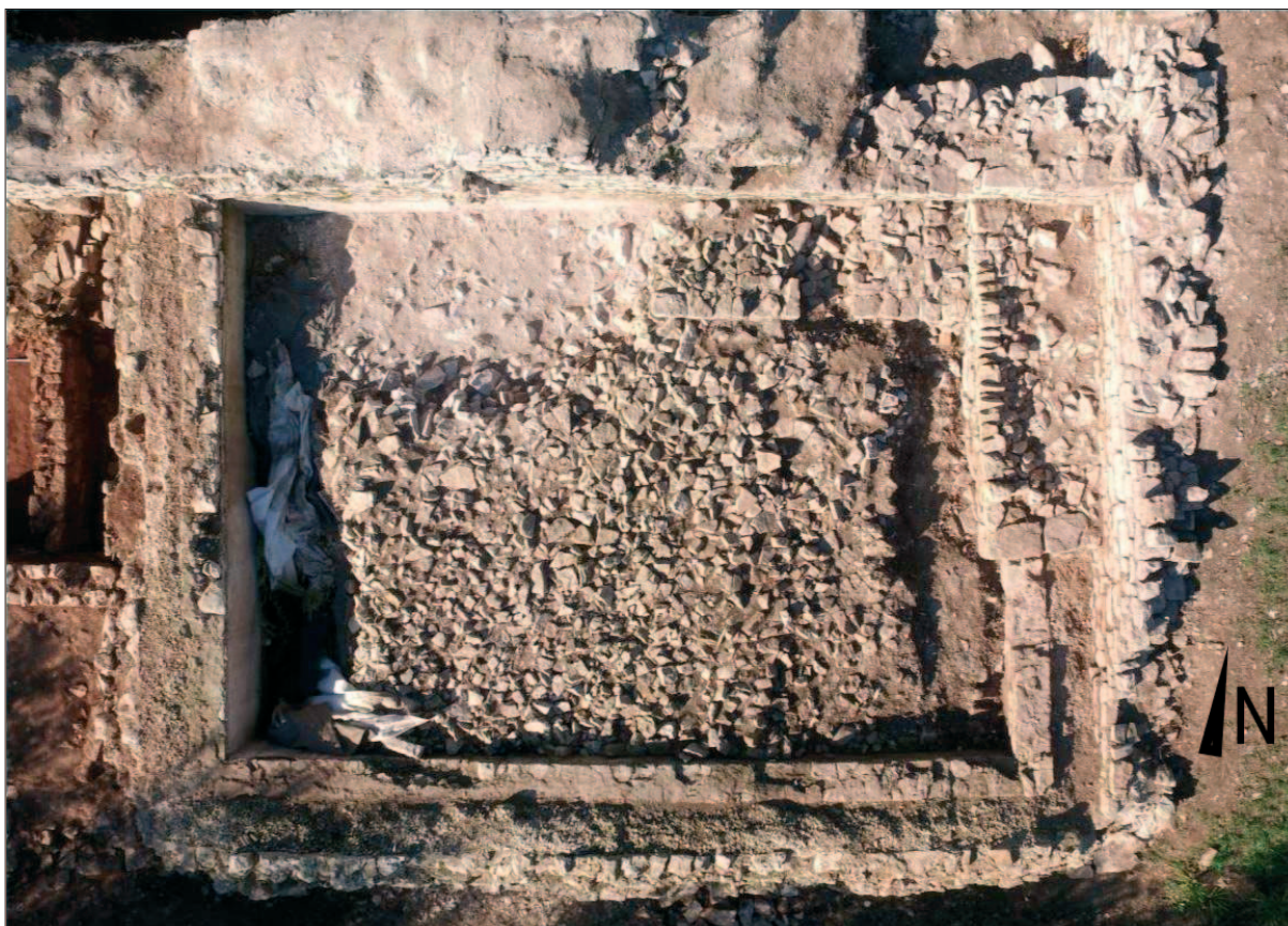
Sl. 5 Zračna snimka cisterne s vidljivim kasnijim strukturama, zapunom i novootkrivenim zidom SJ 142