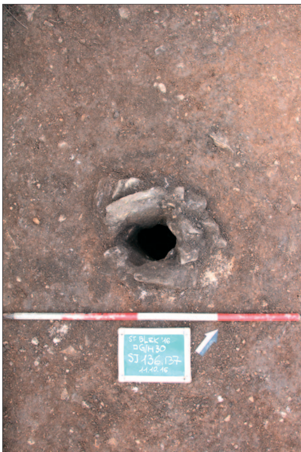
Sl. 1 Rupa za stup SJ 136–137

Fig. 1 Posthole SU 136–137