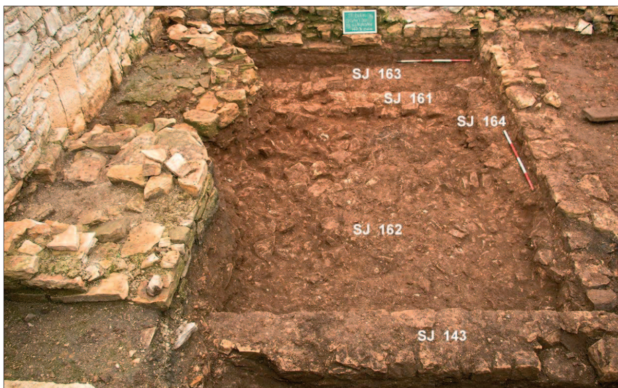
Sl. 2 Stratigrafska situacija u zapadnom dijelu P8 nakon uklanjanja zida SJ 059: zidovi SJ 143 i 161, slojevi urušenja SJ 162 i 163, temelj zida SJ 164

Južno od zida SJ 075 (Šiljeg et al. 2016: 140, sl. 2) radovi su se ograničili na čišćenje zatečenih slojeva i njihovu precizniju definiciju, no započeto je i uklanjanje SJ 076. Nažalost, zbog kiše, nije bilo moguće nastaviti s radom. Uz SJ 056, južno od SJ 075 pa sve do zida SJ 078 i sloja žbuke SJ 085 ustanovljen je sloj urušenja s većim kamenjem (SJ 149) koji se nalazi iznad SJ 076, a sličan je sloju urušenja ustanovljenog i na zapadu iznad SJ 077 (SJ 152) (sl. 4). Uz zapadni dio SJ 075 ispražnjena je zapuna SJ 083 te je definiran njezin ukop SJ 151. Ustanovljeno je kako je ovaj ukop presjekao SJ 075 i 076.