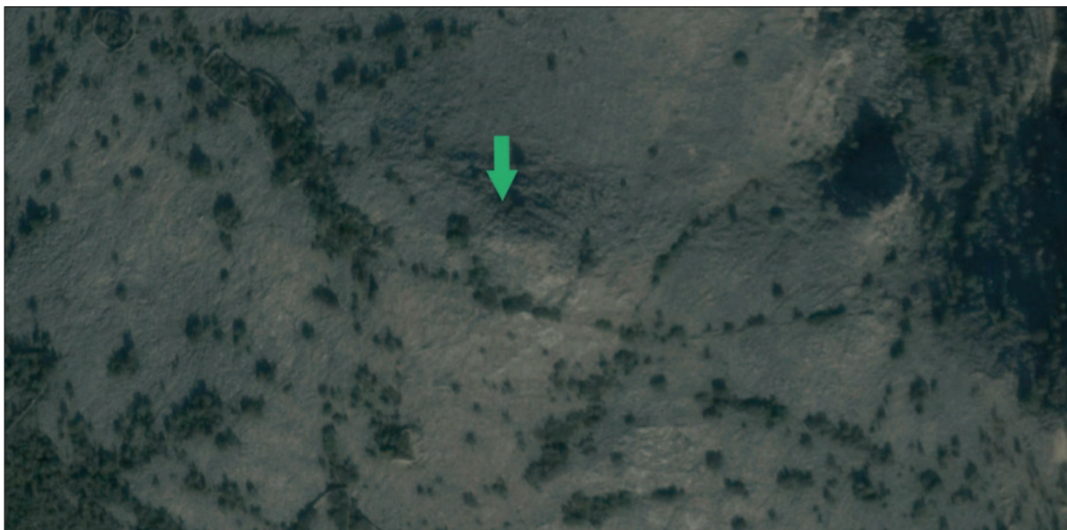
Sl. 2 Zračni snimak područja južno od Lukova s obilježenim potencijalnim lokalitetima (Google Earth)

Fig. 1 Trail northeast of the hill Piskulja (photo: A. Konestra)