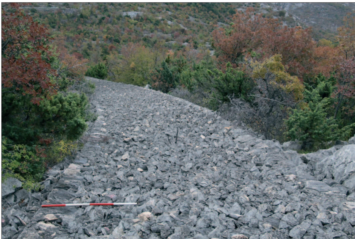
Sl. 1 Put sjeveroistočno od uzvisine Piskulja

Fig. 1 Trail northeast of the hill Piskulja