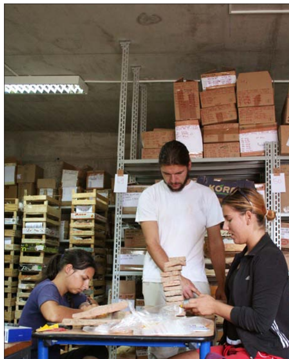
Sl. 5 Rad na obradi materijala – građevinska keramika. Fig. 5 Processing of material finds – building ceramics