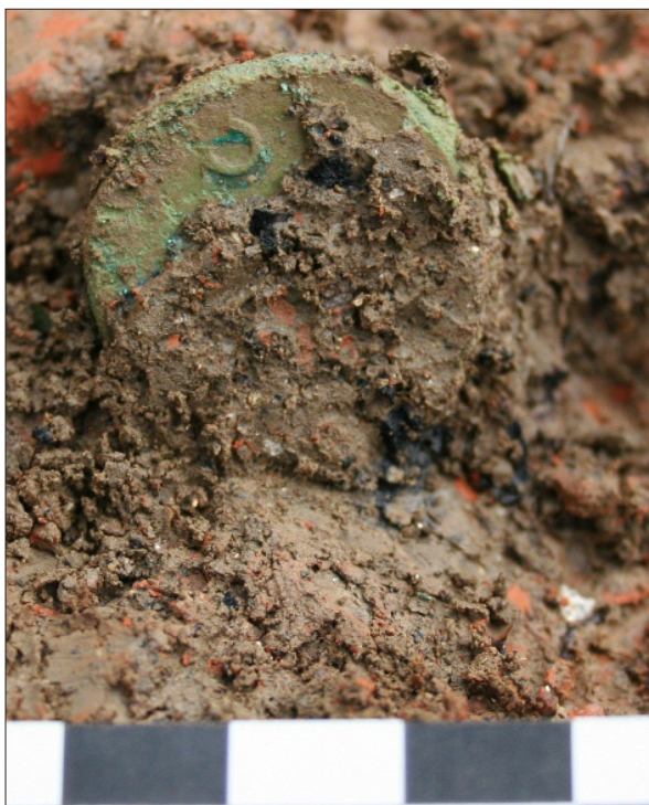
Sl. 4 Nalaz brončanog novca in situ Fig. 4 A bronze coin in situ