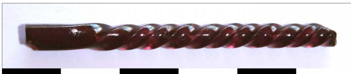
Sl. 3 Ulomak staklene miješalice PN 3517 (snimila: A. Konestra)

Tijekom primarne i studijske obrade nalaza izdvojena je veća količina posebnih nalaza (PN), mahom keramičkih predmeta, a koji se odnose na nove ili cjelovite oblike, pečate ili otiske na tegulama i uvoznu keramiku (italska terra sigillata i keramika tankih stijenki).