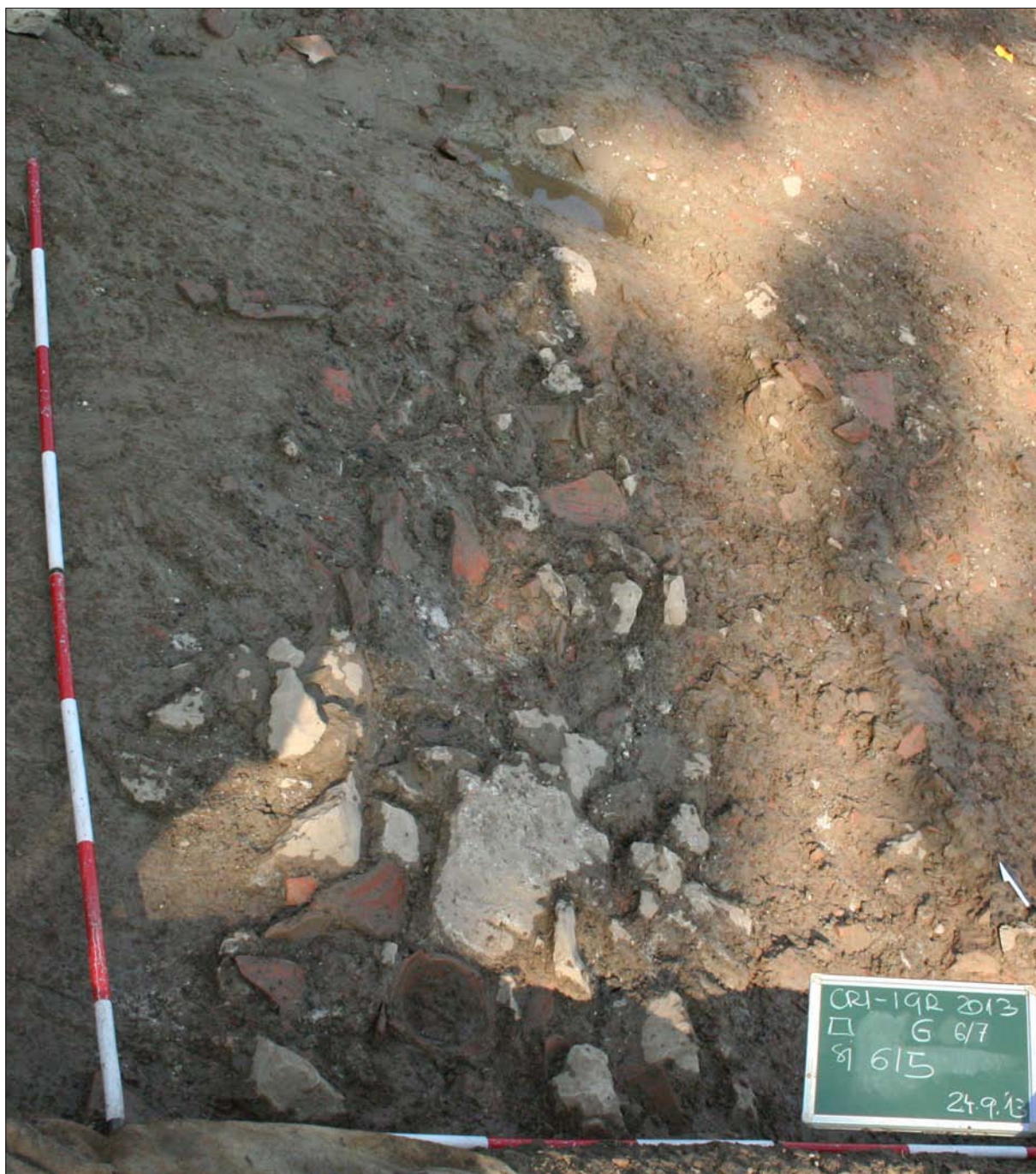
Sl. 1 Zapuna jame SJ 615 nakon čišćenja