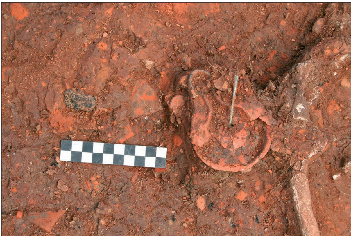
Sl. 9 Grob 2, staklena perla, brončana igla i Firma lampa.