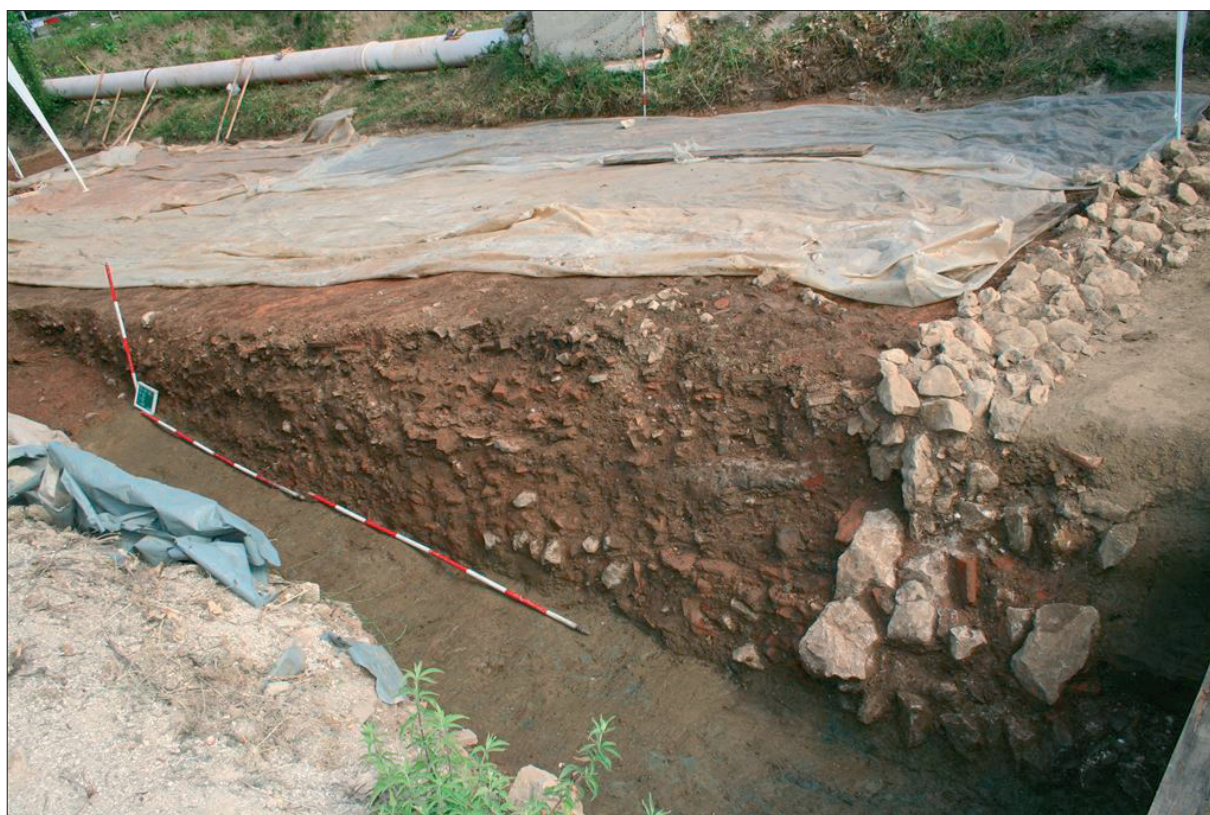
Sl. 6 Sjeverni profil drenažnog jarka SJ 018.