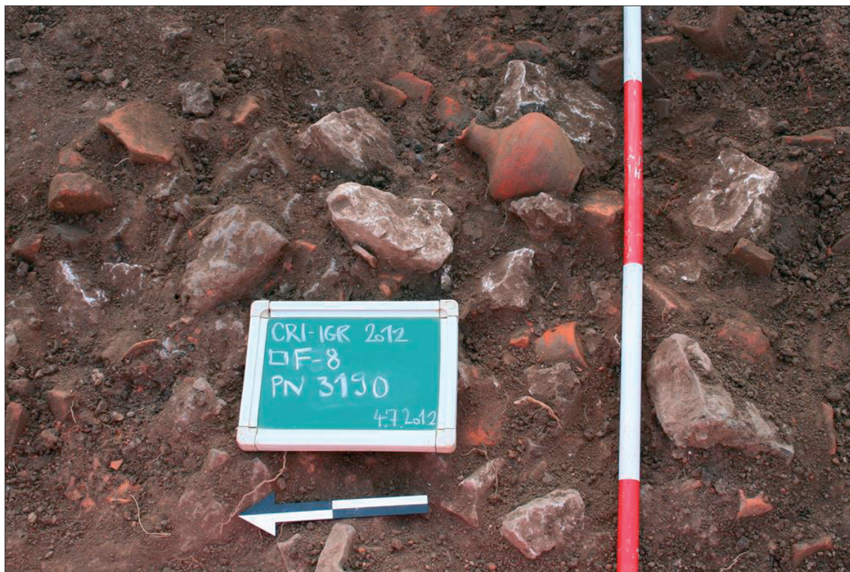
Sl. 5 Sloj SJ 054 s cjelovitim vrčem.