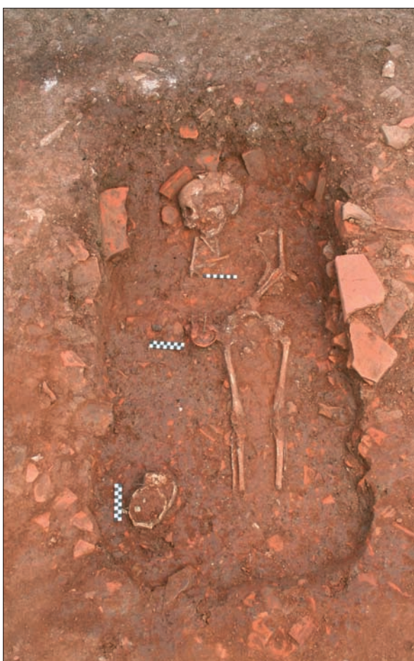
Sl. 8 Grob 2 s priložima.

Fig. 7 Remains of grave 1.