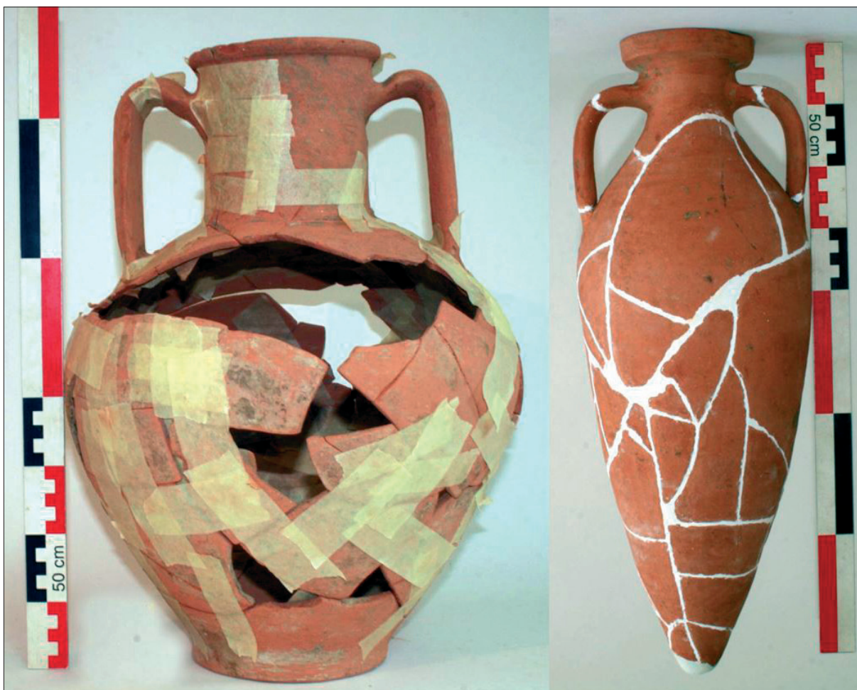
Sl. 4 Dva nova oblika amfora crikveničke radionice.