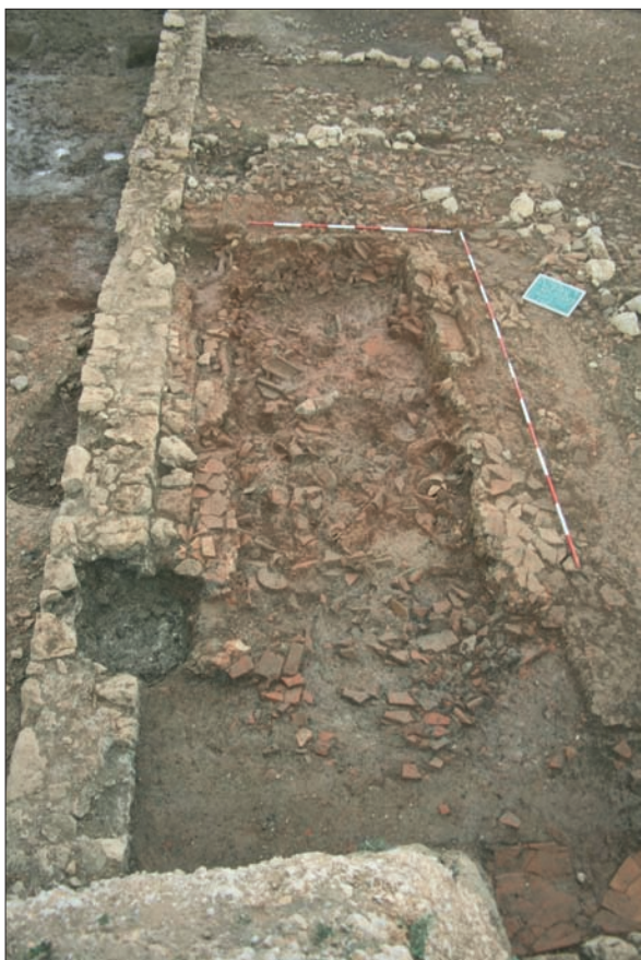
Sl. 10 Zapuna peći SJ 103.