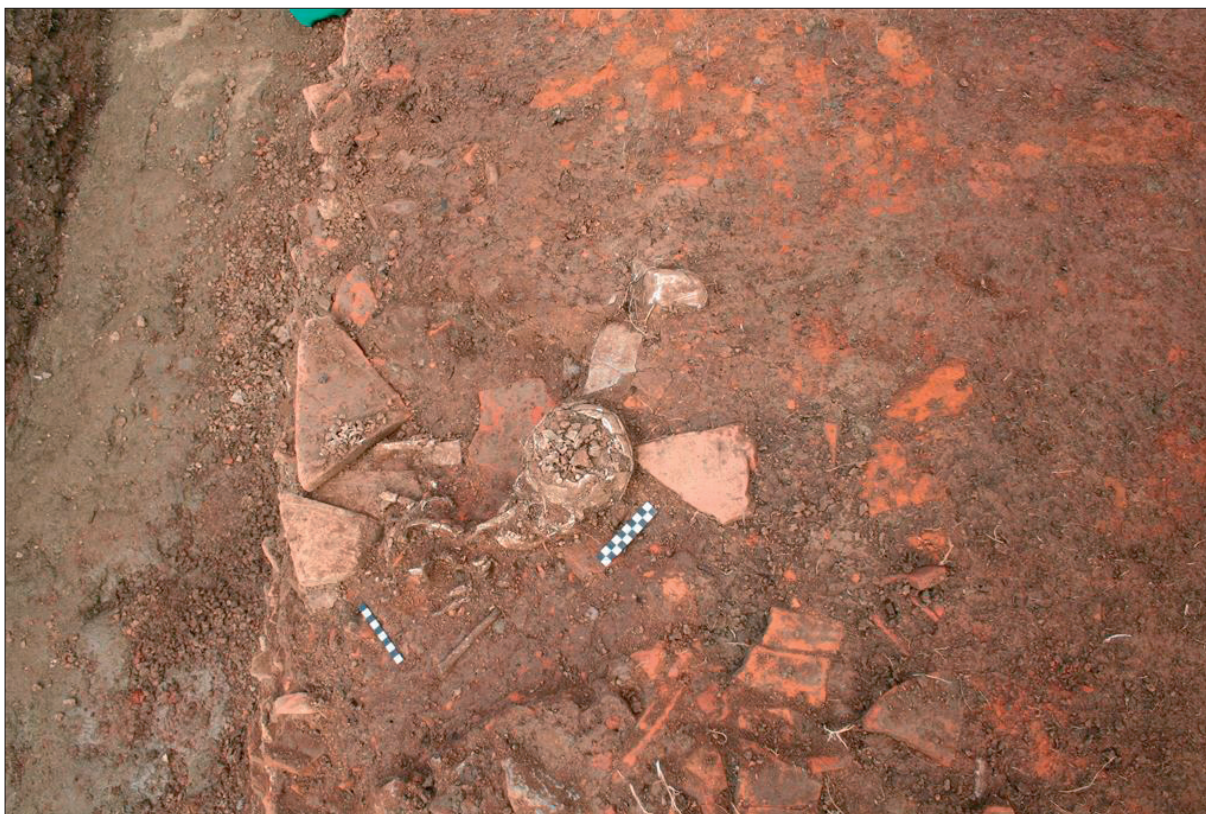
Sl. 7 Ostaci groba 1.

Fig. 7 Remains of grave 1.