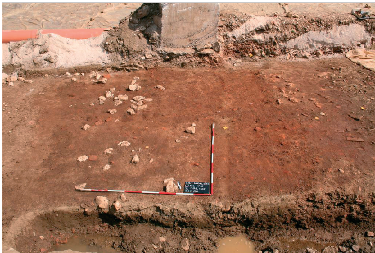
Sl. 1 Stanje nakon istraživanja 2006. godine u kvadrantima F/G–5–8.

Sezona 2009. zahvatila je dio površine istražene 2006. te dio koji se nalazio ispod šetnice (obale) prema Dubračini. Ove