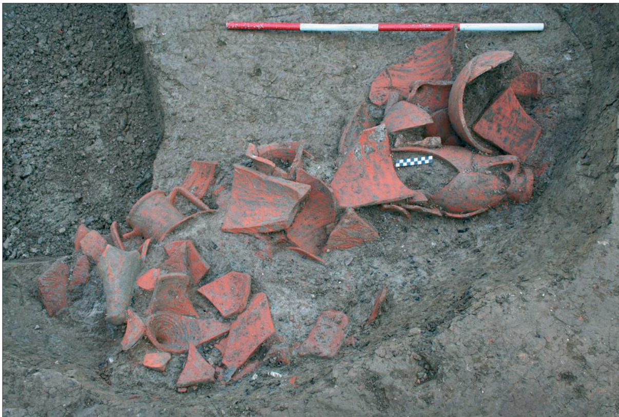
Sl. 3 Dno jame SJ 432 s amforama.