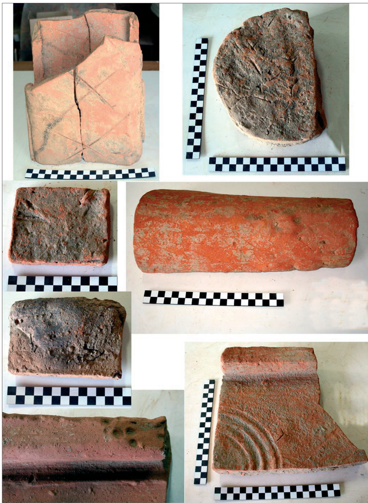
Sl. 11 Dio proizvoda građevinske keramike crikveničke radionice.