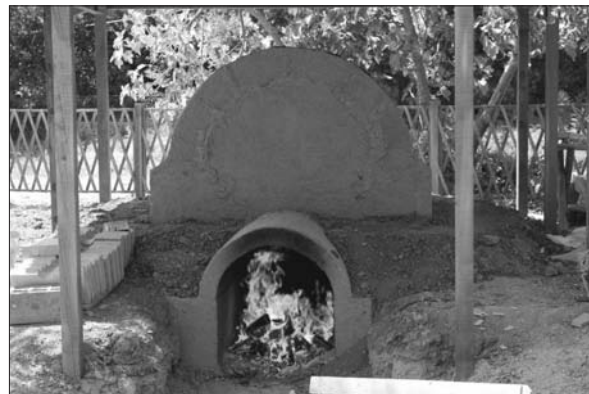
Sl. 7 Crikvenica – rekonstrukcija rimske keramičarske peći i postupak njenog paljenja (snimila: A. Konestra).

Rezultat koji je nužno očekivati u optimalnom režimu pečenja mora zadovoljavati nekoliko pretpostavki: maksimalna koncentracija energije uz korištenje što manje količine ogrijevne mase unutar vremenski zadanog režima temperaturnih maksimuma. Kada se postignu i usklade svi elementi ovih idealnih uvjeta, doseže se sustav antičke tehnologije pečenja keramike. U našem eksperimentalnom projektu prošle godine tek smo zakoračili u poznavanje nekih njegovih dijelova. Saznanja o propustima i uspješnim rješenjima su prikupljena, a svakim novim