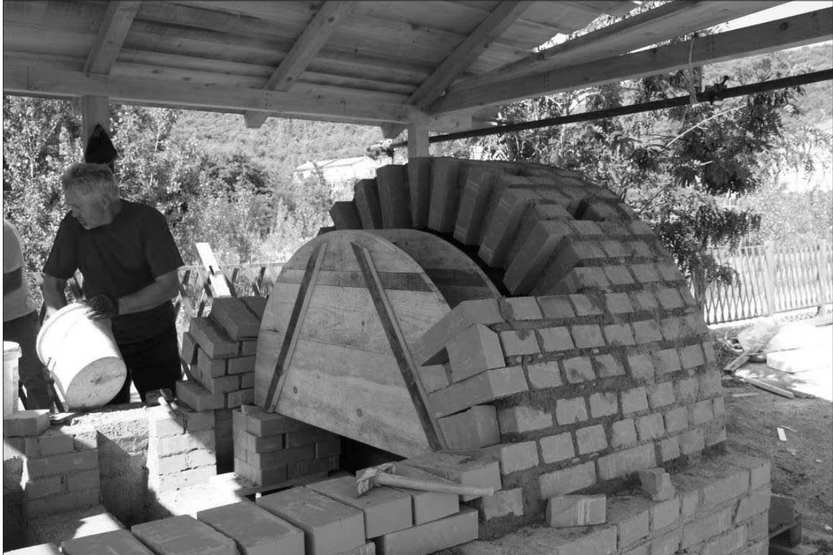
Sl. 4 Crikvenica – zidanje lučnog svoda peći.

Fig. 4 Crikvenica - building of the kiln's arched ceiling.