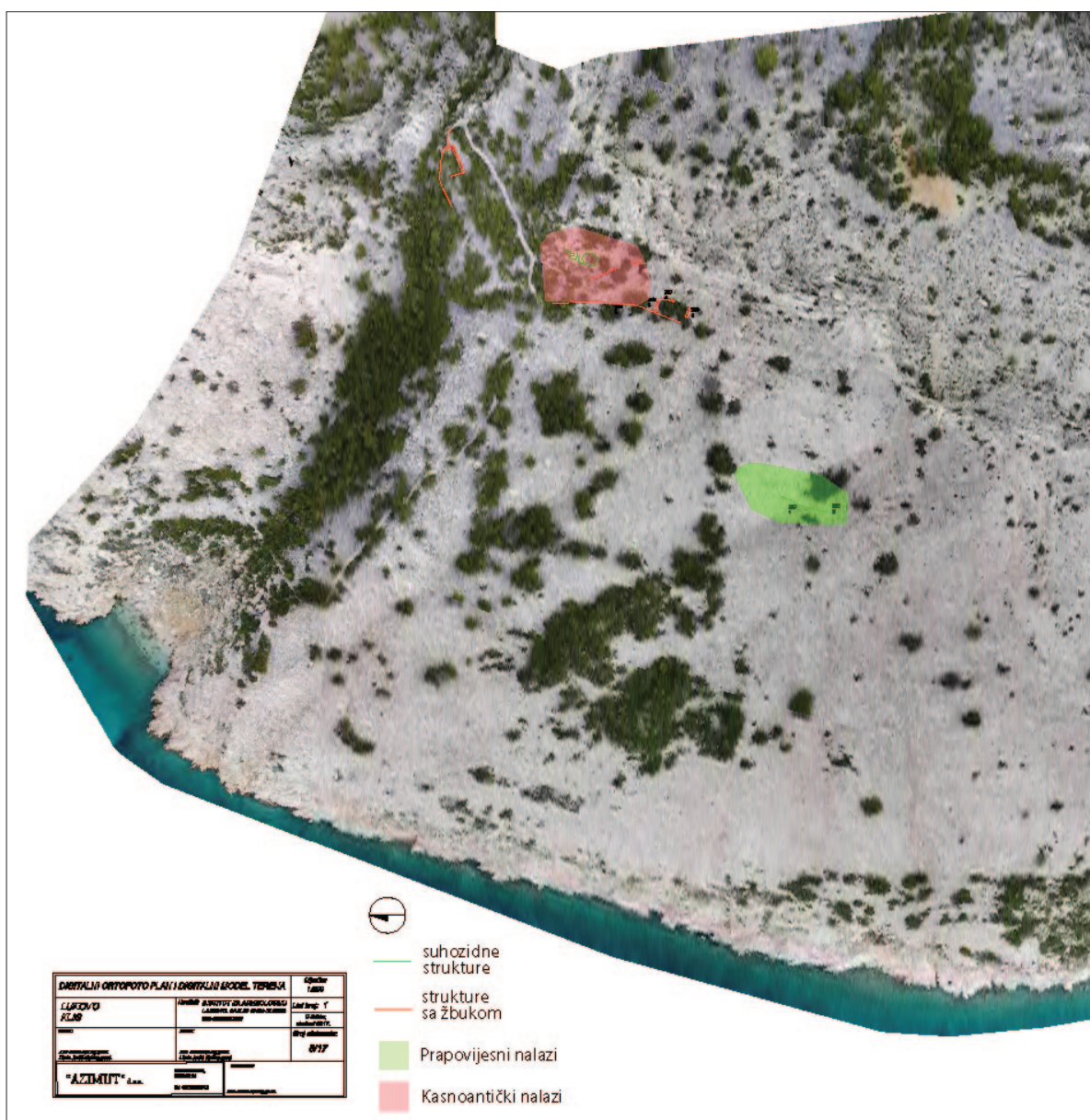
Sl. 1 Ortofoto snimak Klisa kod Lukova s ucrtanim utvrđenim strukturama i područjima rasprostiranja pokretnih nalaza

Peršinac, a južno od Jablanca. Lokalitet gradinskog tipa s ubiciranim naseljem i nekropolom na ravnom poznat je iz literature (Ljubić 1889; Brunšmid 1901). Ondje su provedena i iskopavanja, a nalazi iz funerarnoga konteksta upućuje na dataciju u željezno doba. Vodeći se navodima spomenute starije literature, teško je locirati točnu poziciju spominjanih grobnih struktura, stoga one ovim terenskim pregledom nisu ni potvrđene. S druge strane, na zapadnom platou potvrđeno je postojanje suhozidnoga bedema u protezanju od više desetaka metara uz njegov sjeverozapadni rub, uz kojeg su mjestimice prikupljeni keramički nalazi. Na istočnom dijelu zapadnoga platoa utvrđen je i zid građen od lokalnog vapnenca povezanog vezivom, dok je na cijelom području prisutan niz suhozidnih struktura, danas urušenih, uz koje se veže srednjovjekovni i ranonovovjekovni materijal. Na jugozapadnom dijelu istoga platoa utvrđeno je postojanje manje četvrtaste građevine čiji su zidovi građeni od vapnenačkih blokova povezanih žbukom.