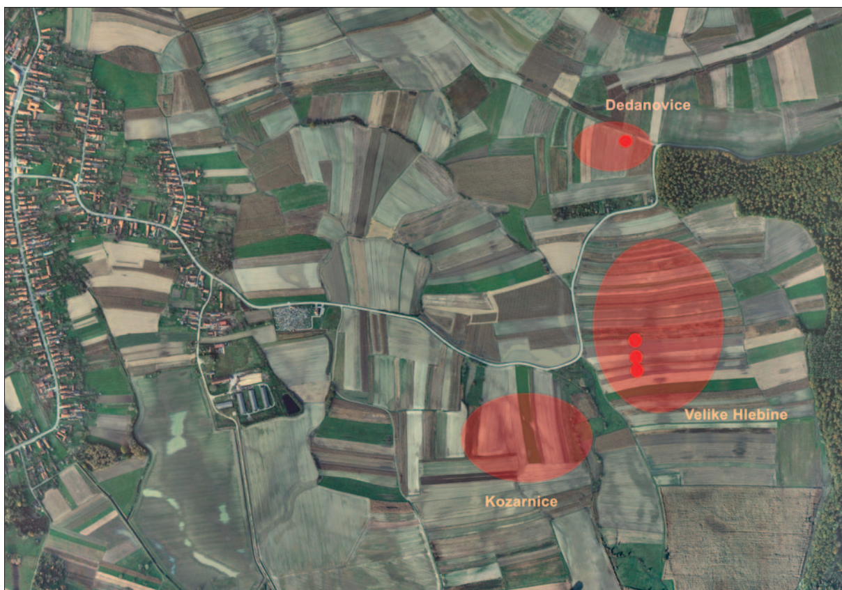
Sl. 1 Prostor Hlebina iz zraka s više zabilježenih položaja s površinskim materijalnim ostacima – talionička zgura: Velike Hlebine i Kozarnice; kovačka zgura: Dedanovice (podloga: geoport.dgu.hr; doradio: I. Valent)