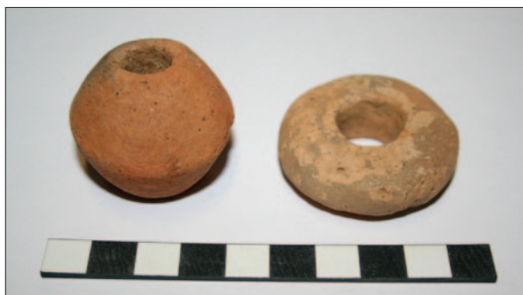
Sl. 2 Dva keramička pršljena s lokaliteta Delovi – Podkućnice