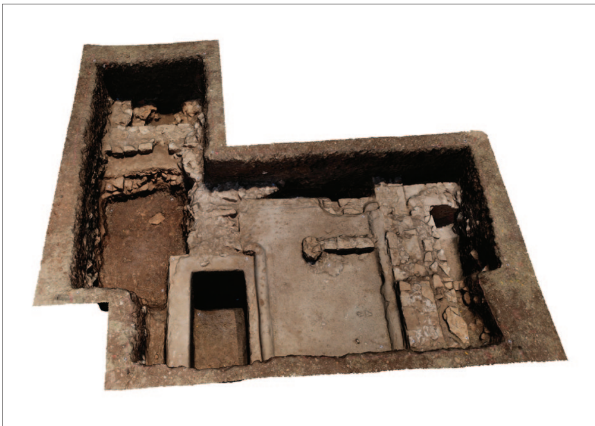
Sl. 2 3D foto – završna situacija u sondi 19 (izradile: A. Devlahović, S. Popović)