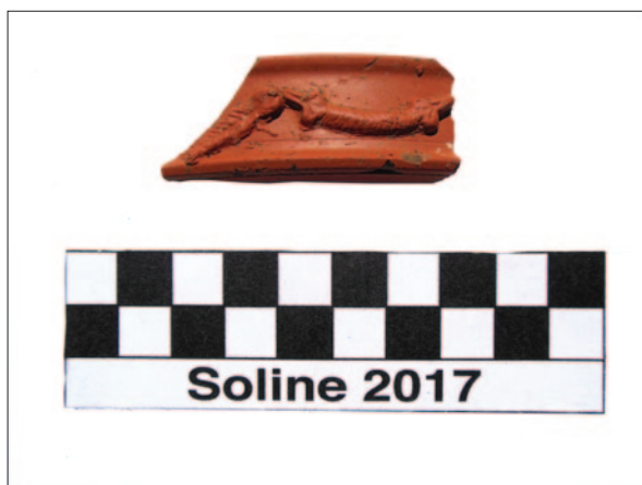
Sl. 4 Ulomak zdjele s ukrasom girlande, terra sigillata