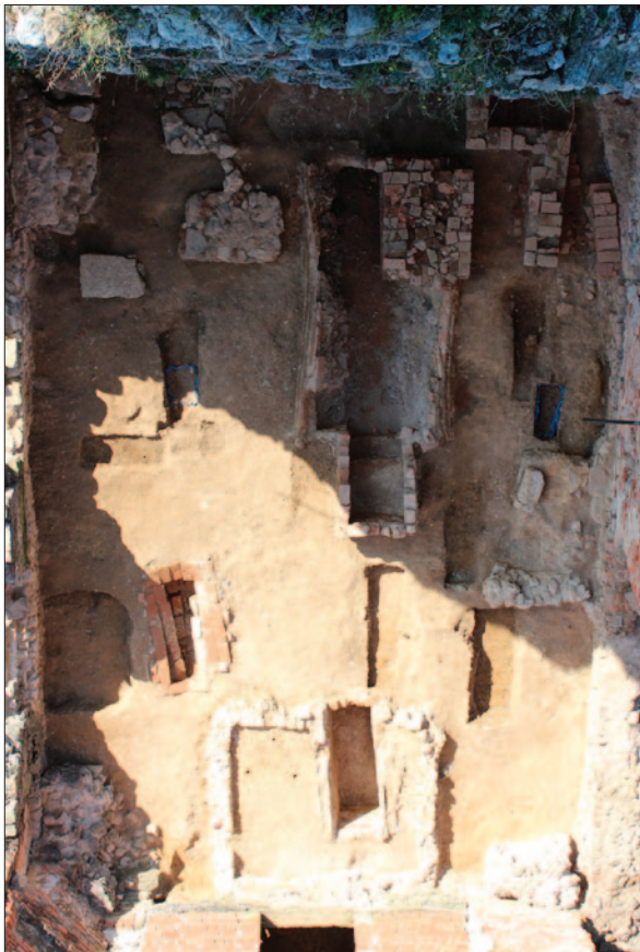
Sl. 1 Pogled na brod crkve tijekom istraživanja Fig. 1 The view of the church aisle during the excavations

kom, a njeno razgrađivanje je, kao i istraživanje okolnog sloja SJ 1407, ostavljeno za sljedeću godinu.