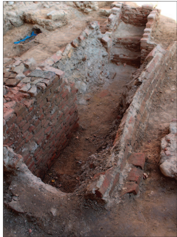
Sl. 2 Pogled s juga/jugozapada na kriptu urušenog bačvastog svoda (SJ 1421)

Grobna konstrukcija SJ 1421 ukopana je u sloj smeđe zemlje (SJ 1420), koji se prostire većim dijelom sonde i unutar kojeg se pronalaze prvi grobovi. Odmah nakon dokumentiranja i vađenja kamenih ploča dizalicom, prionulo se istraživanju grobne konstrukcije. Kao i grobna konstrukcija SJ 1429 i ova je bila izgrađena od opeke vezane žbukom, ali je bila mnogo veća, što može upućivati na to da je riječ o kripti. Također je bila bačvasto presvođena, no svod je najvećim dijelom bio urušen. Očito je i ova grobna konstrukcija bila prekopavana u 20. stoljeću jer je pronađeno mnogo recentnog otpadnog materijala. Istražena je do dubine od otprilike 1,5 m, no odlučeno je da se, zbog sigurnosti, daljnje istraživanje grobne konstrukcije ostavi za nadolazeće kampanje, nakon što se spusti okolna razina zemlje. Na dosegnutoj dubini, zbog veće koncentracije kostiju, mogli bi se očekivati grobovi. Ulaz u kriptu nalazio se na njenom istočnom dijelu, na što upućuju stube izrađene također od opeke, koja je