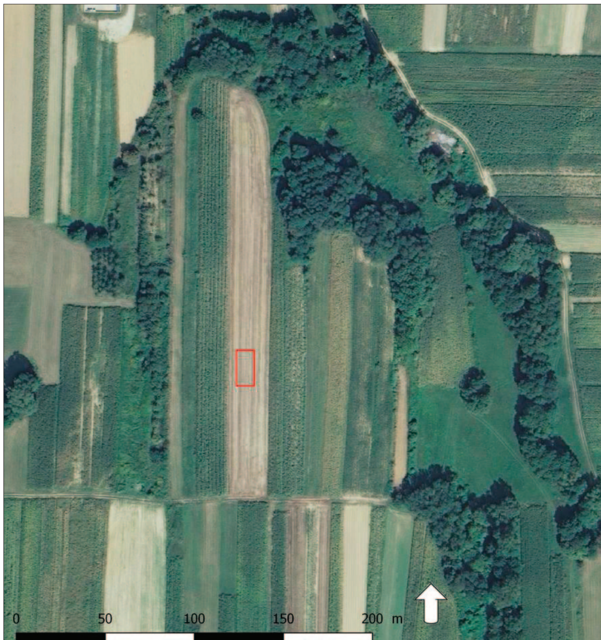
Sl. 1 Lokalizacija Carev Jarek u Jalžabetu s položajem arheološke sonde 2017. na k.č. 485/1 (izradio: M. Mađerić; na podlozi www.google.hr/maps )

Fig. 1 Carev Jarek in Jalžabet site with the position of archaeological probe in 2017 on a c.p. 485/1 (made by: M. Mađerić; based on www.google.hr/maps )