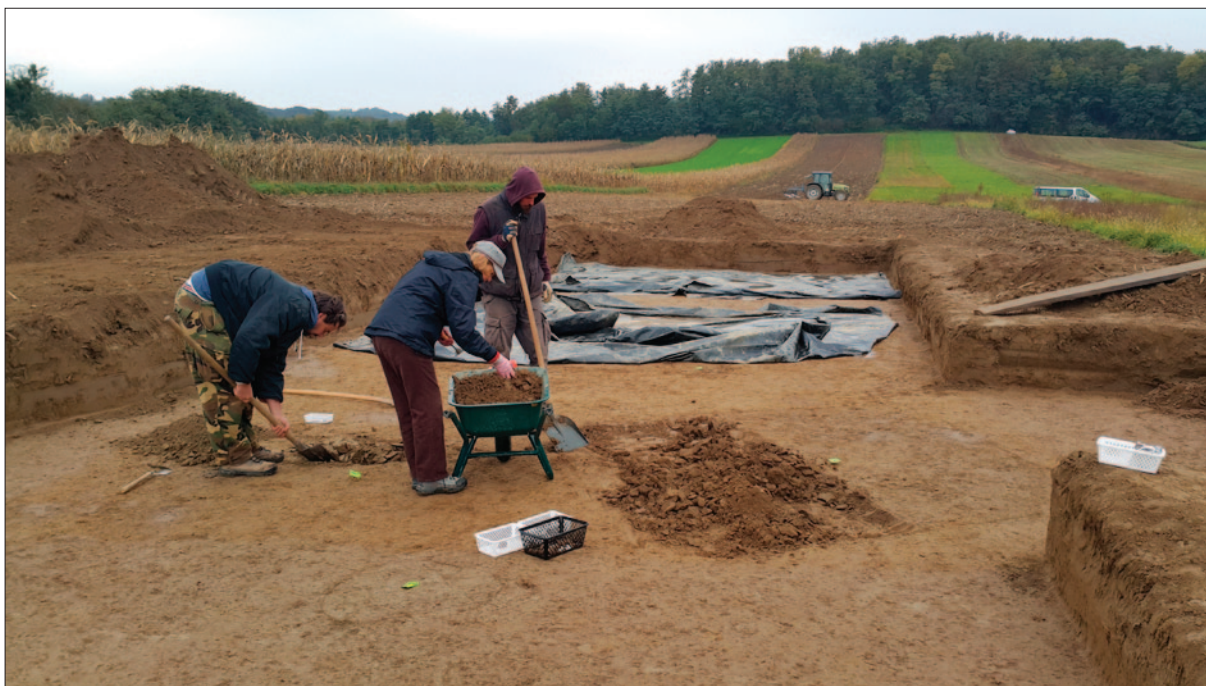
Sl. 2 Lokalitet Carev Jarek u Jalžabetu tijekom istraživanja 2017