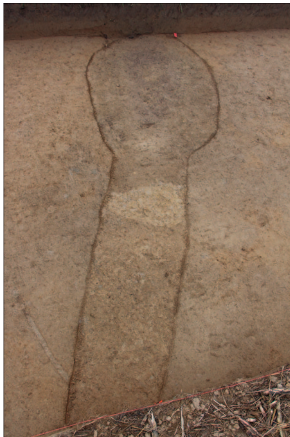
Sl. 3 Zapuna ukopa kanala SJ 91 i zapuna ukopa jame SJ 93 prokopanih radi pljačke tumula 10

Pronađeni ostaci groba 1 iz tumula 10, koji je pljačkan, bili su položeni na istoj razini kao i grob 2, ali sjevernije. Ipak, na osnovi sačuvanih tragova, o konstrukciji tumula 10 sa sigurnošću nije moguće iznjeti više spoznaja. Vjerojatno su nakon polaganja spaljenih ostataka, zajedno s ulomcima keramičkih posuda te rastaljene