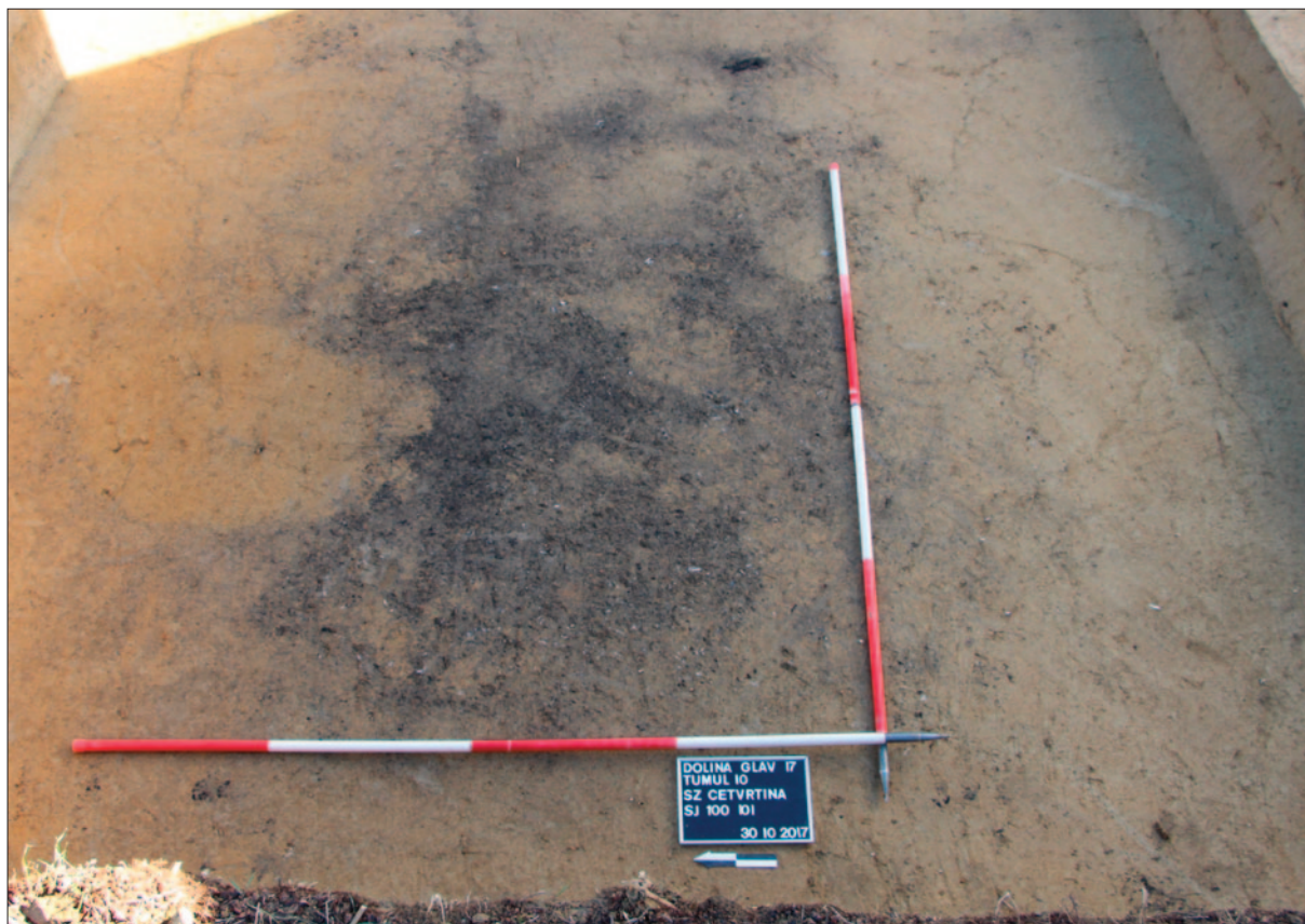
Sl. 5 Ostaci SJ 100 in situ , presječeni ukopom jame SJ 102