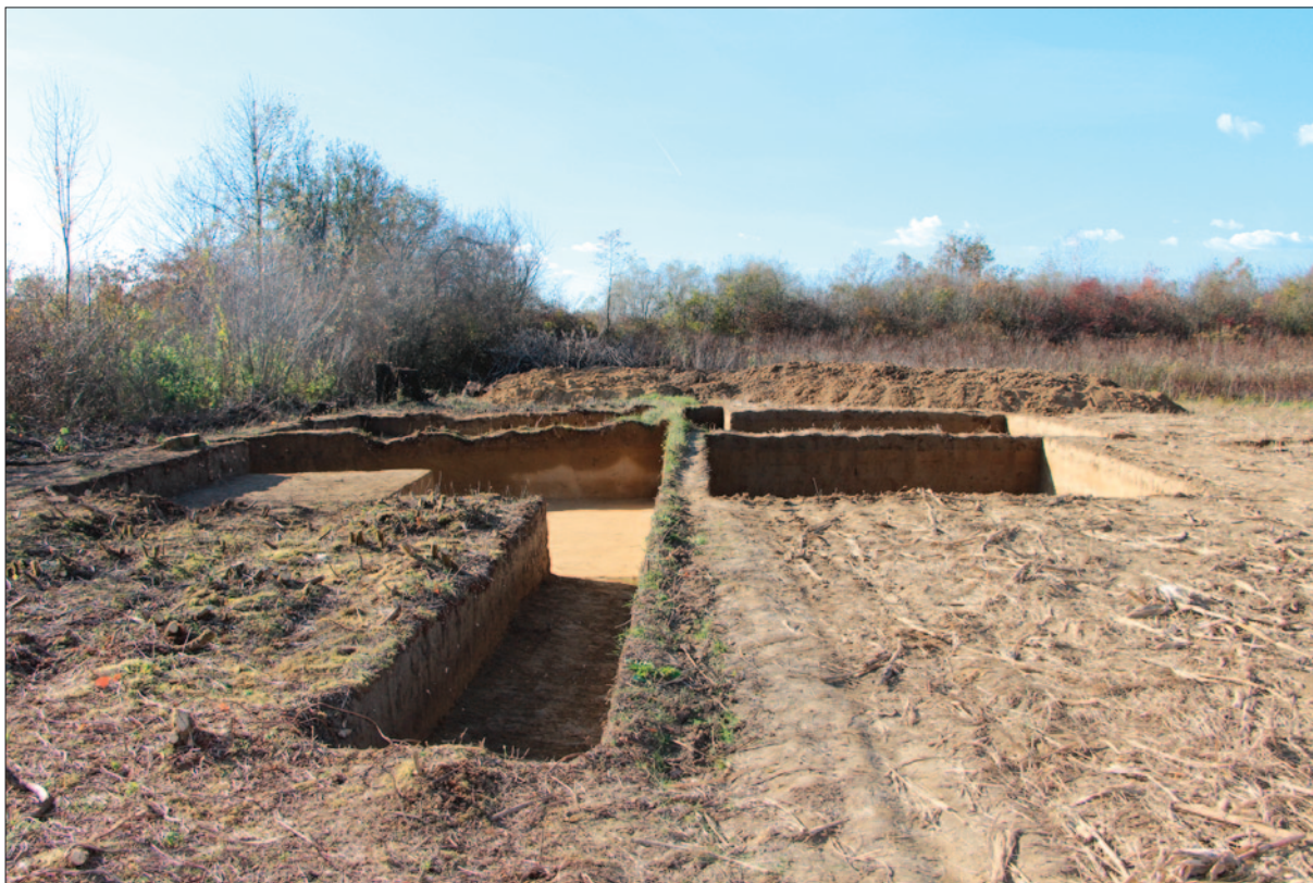
Sl. 1 Tumul 10 nakon istraživanja – pogled s istoka

Fig. 1 Tumulus 10 after the excavation – a view from the east