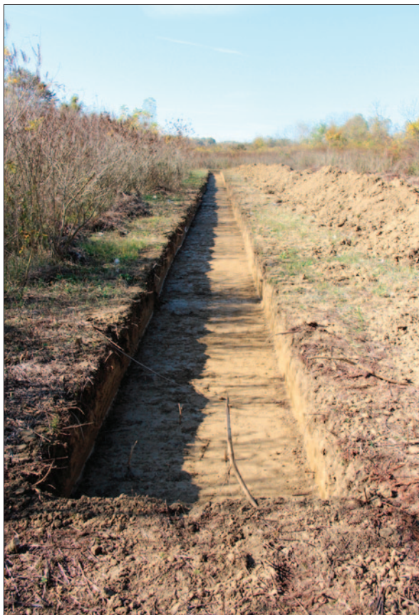
Sl. 2 Sonda 6 nakon istraživanja

Fig. 1 Tumulus 10 after the excavation – a view from the east