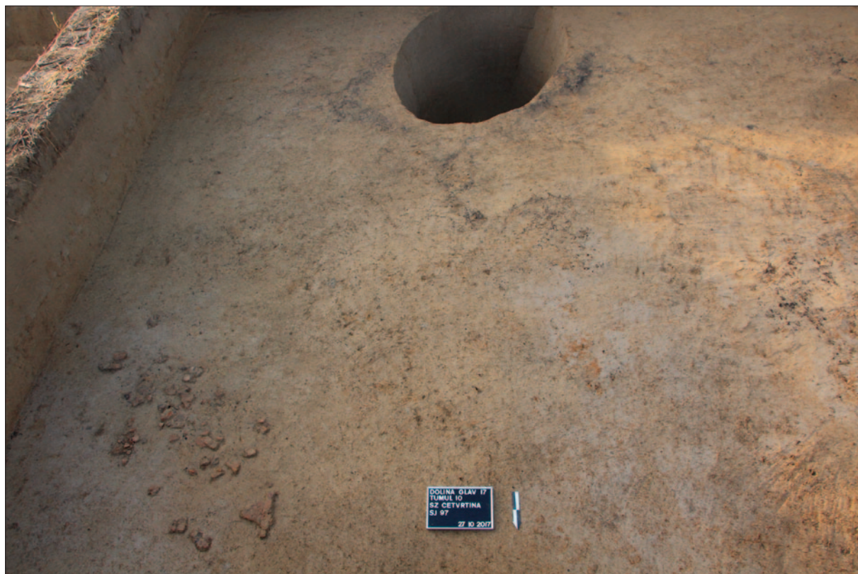
Sl. 4 Ostaci keramičkih posuda in situ u sloju SJ 97 – sjeverozapadna četvrtina tumula 10