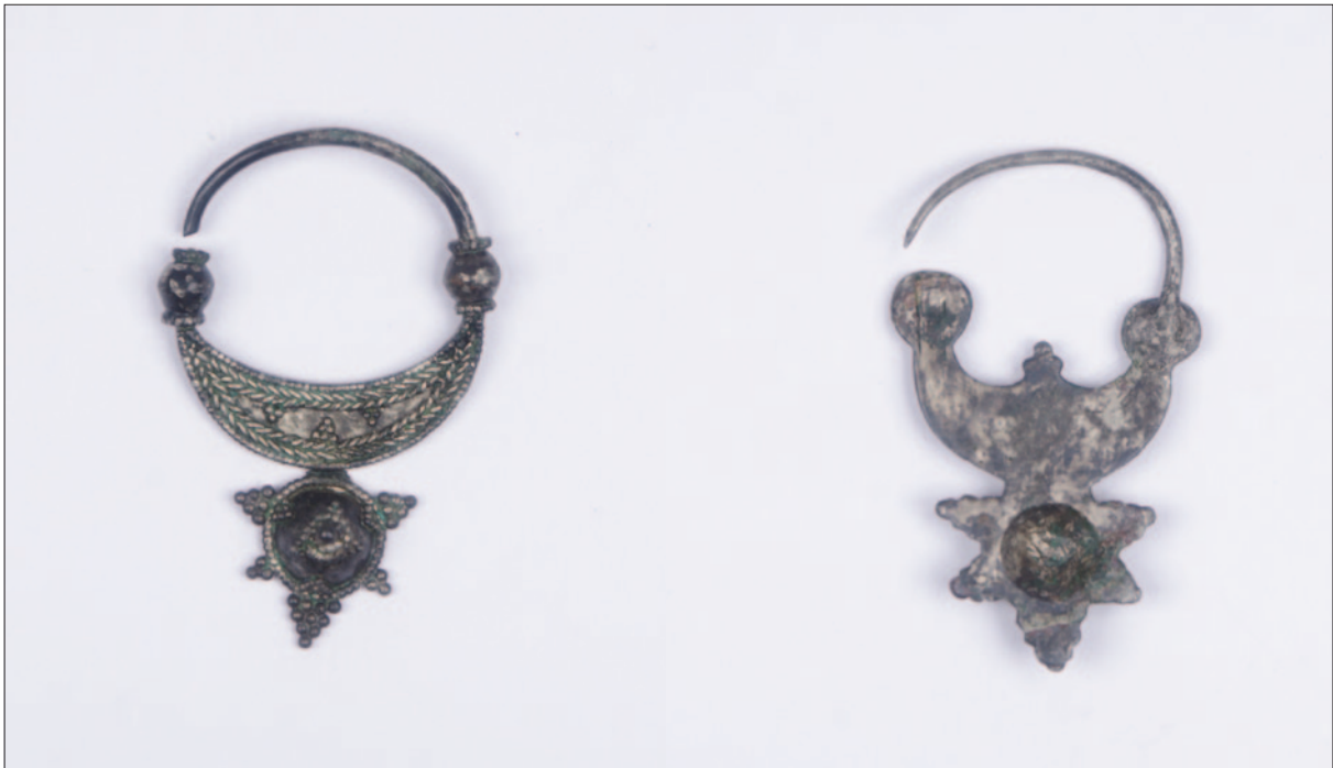
Sl. 11 Srebrne lunulaste naušnice iz grobova 29 i 40

Fig. 11 Silver lunulus earrings from the graves 29 and 40