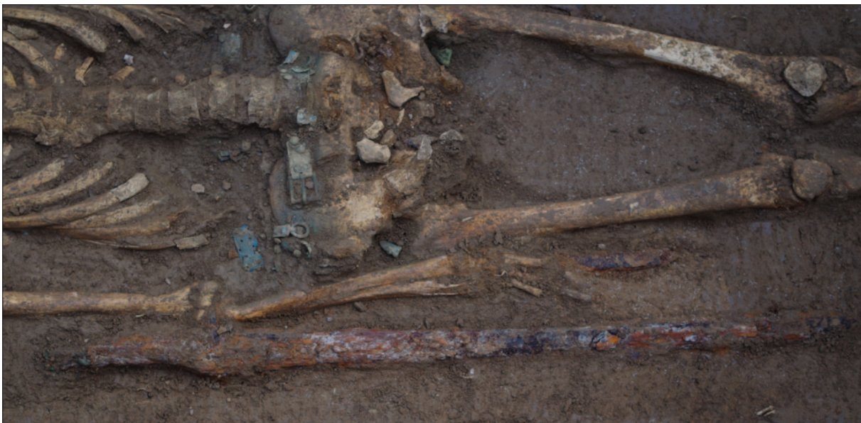
Sl. 12 Detalj groba 42 sa željeznim palašem i brončanom pojasnom garniturom

Fig. 11 Silver lunulus earrings from the graves 29 and 40