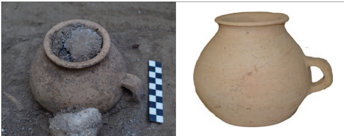
Sl. 7 Detalj groba 16 s keramičkom posudom