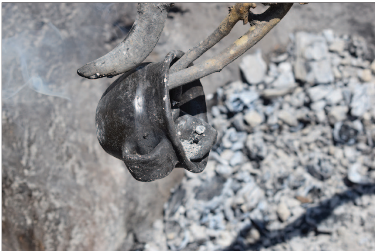
Sl. 2 Vađenje posude iz jame