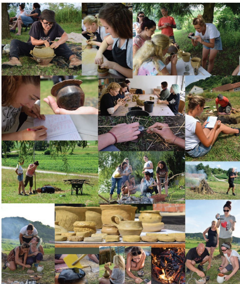
Sl. 1 Aktivnosti provedene u sklopu programa tijekom 2018. godine

U posljednjoj fazi programa organiziran je ekspe-