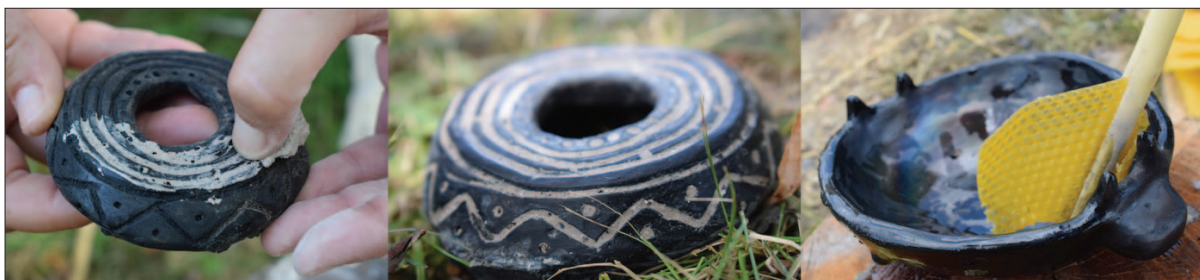
Sl. 3 Nanošenje bijele paste (inkrustacije) i tretiranje površine posude pčelinjim voskom Fig. 3 Application of white paste (incrustation) and surface-treatment of the vessel with bee wax