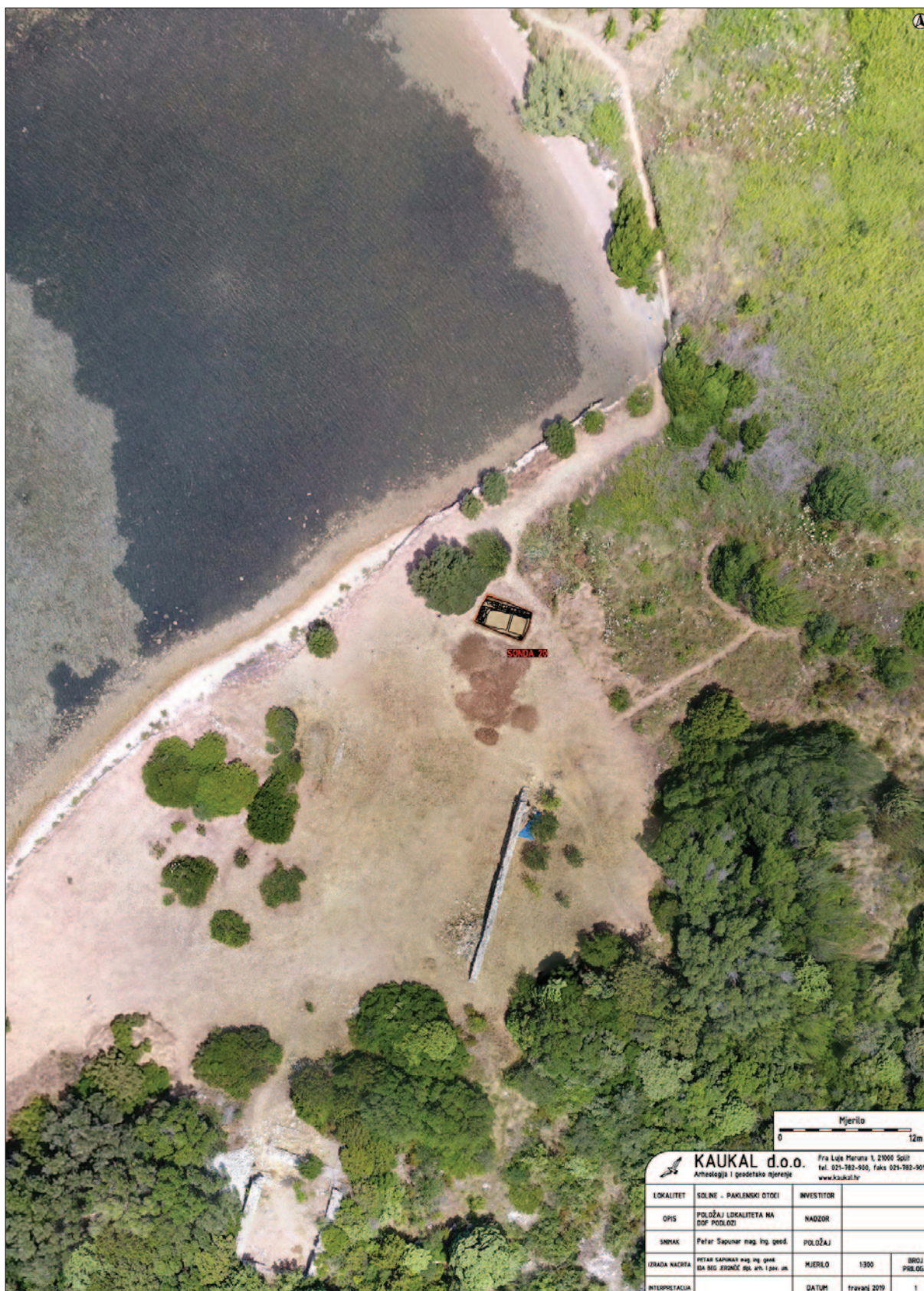
Sl. 1 Položaj lokaliteta na DOF podlozi s nazančenom sondom 20 (izradio: P. Sapunar)