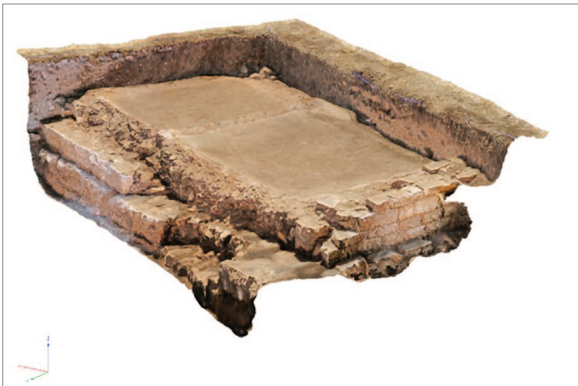
Sl. 4 3D foto – završna situacija u sondi 20, pogled jugozapad