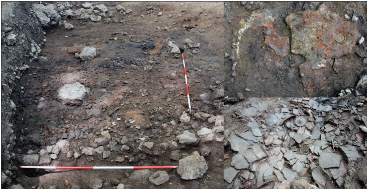
Sl. 1 Ostaci ognjišta, sloja s izgoranim ostacima drveta i drvenih greda i depozit razbijenih keramičkih posuda