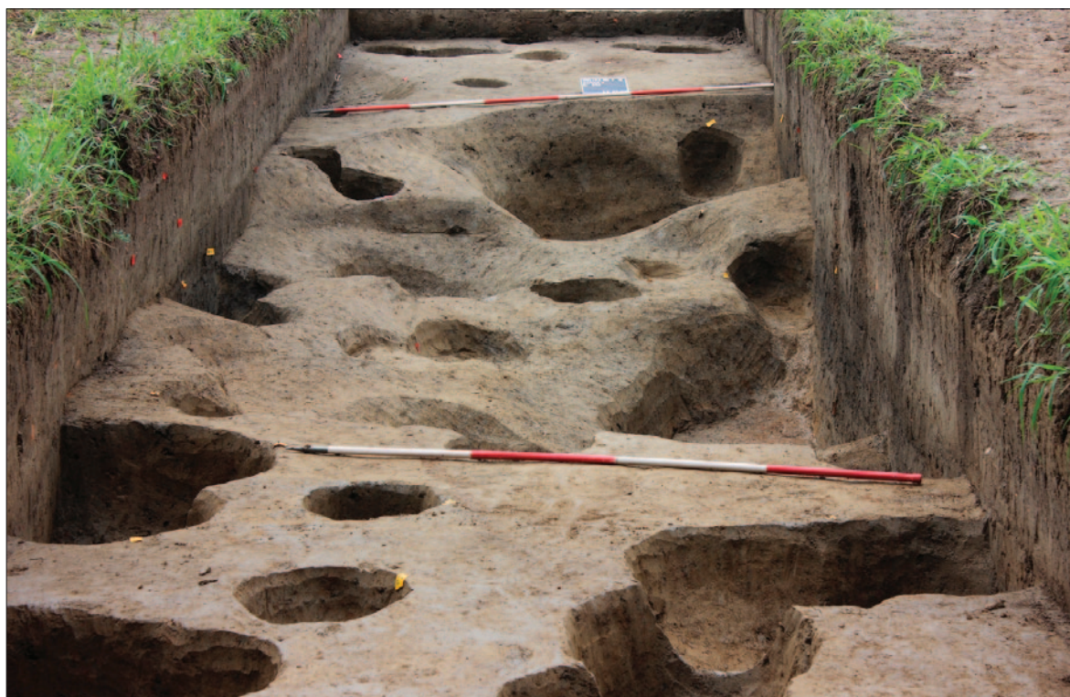
Sl. 7 Dolina Babine grede – Tukovi, istražen i ukopani objekt SJ 530 u sjevernome dijelu sonde 2