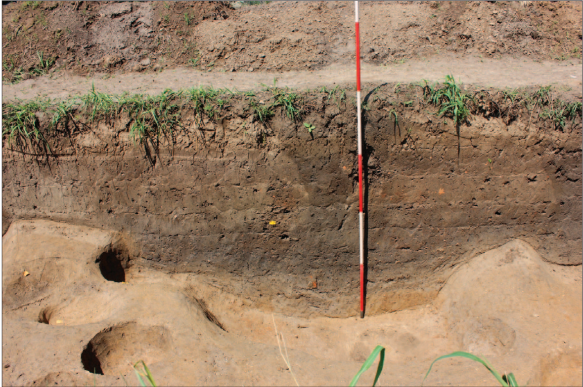
Sl. 8 Dolina Babine Grede – Tukovi, presjek zapuna najdublje dijela objekta SJ 530