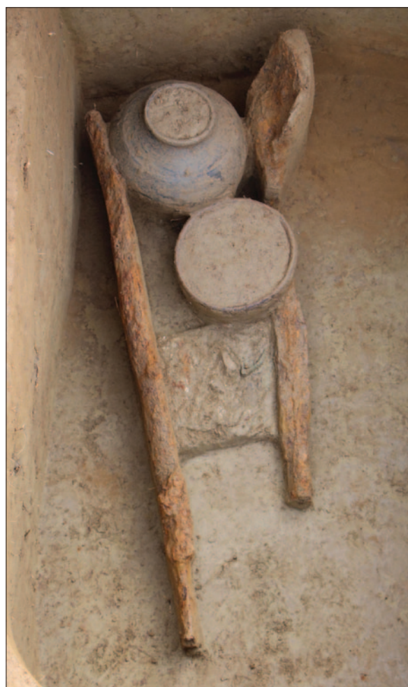
Sl. 4 Grob LT 125