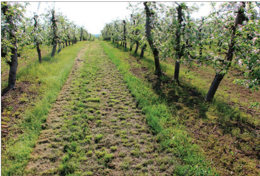
Sl. 1 Pogled na sondu 17 prije početka istraživanja koja je položena na zapadnoj padini uzvišenja

do slojeva pijeska. U grobu LT 118 spaljene kosti ostale su sačuvane na kompaktnoj hrpici, no lonac položen s njihove istočne strane djelomično je oštećen obradom zemljišta (sl. 5). S druge strane, dno groba LT 123 nalazilo se odmah ispod sloja humusa, odnosno sačuvano je samo dno grobne rake s nekoliko spaljenih kostiju te donjim dijelovima keramičkih posuda (sl. 6). Isto tako, u obradom zemljišta uništenome grobu LT 126 sačuvano je samo željezno koplje, dok je grob LT 120 u potpunosti bio uništen recentnim ukopima. Rezultati provedenih istraživanja pokazuju kako je znatan dio grobova položenih bliže vrhu uzvisine vjerojatno uništen intenzivnom