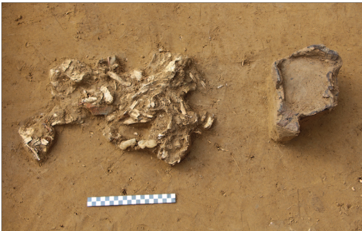
Sl. 5 Detalj groba LT 118 – pokop žene