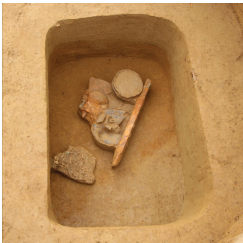
Sl. 2 Grob LT 122