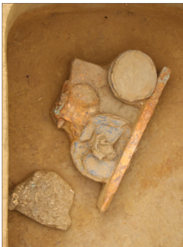
Sl. 3 Detalj groba LT 122 – pokop ratnika