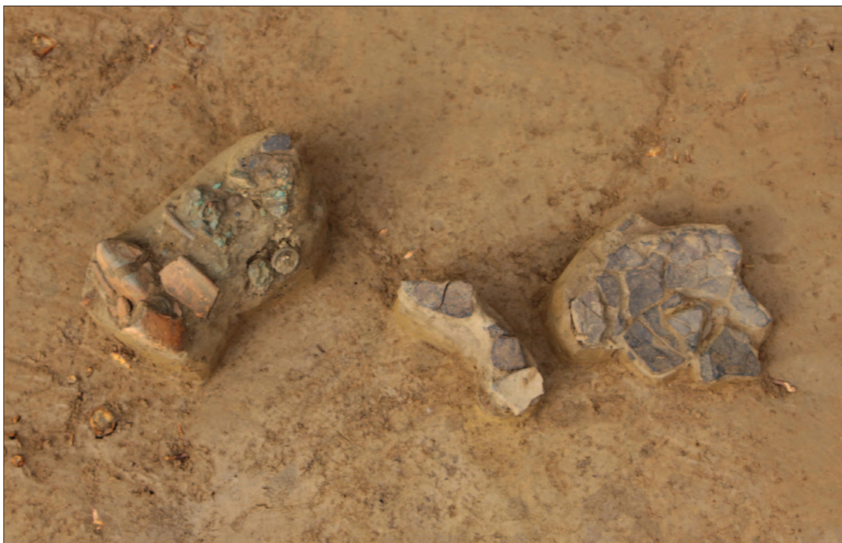
Sl. 6 Detalj groba LT 123 – pokop žene s brončanim pojasom i keramičkim posudama