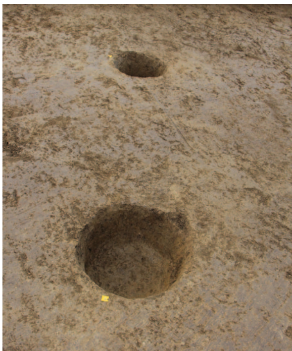
Sl. 2 Ukopi stupova SJ 5 i SJ 7 na istočnome dijelu nalazišta