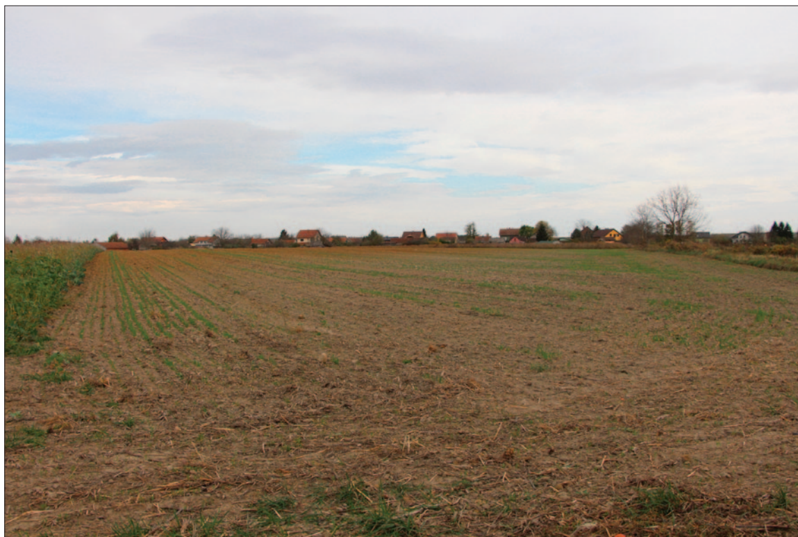
Sl. 1 Pogled na zapadni dio nalazišta s juga