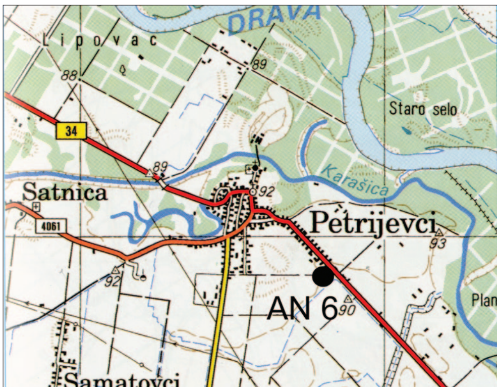
Karta 1 Položaj nalazišta AN 6 Petrijevi – Karaševo 2 (izradio: M. Dizdar)

Map 1 Position of the AN 6 Petrijevi – Karaševo 2 site (prepared by: M. Dizdar)