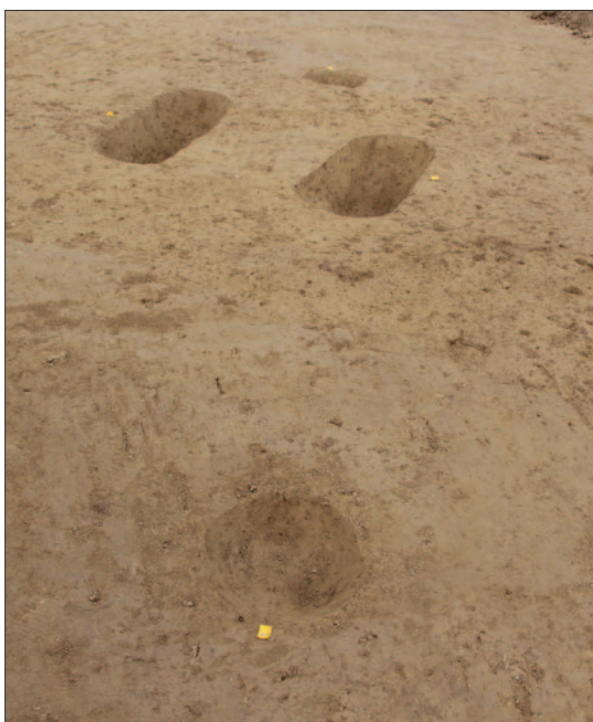
Sl. 3 Skupina ukopa na središnjem dijelu nalazišta