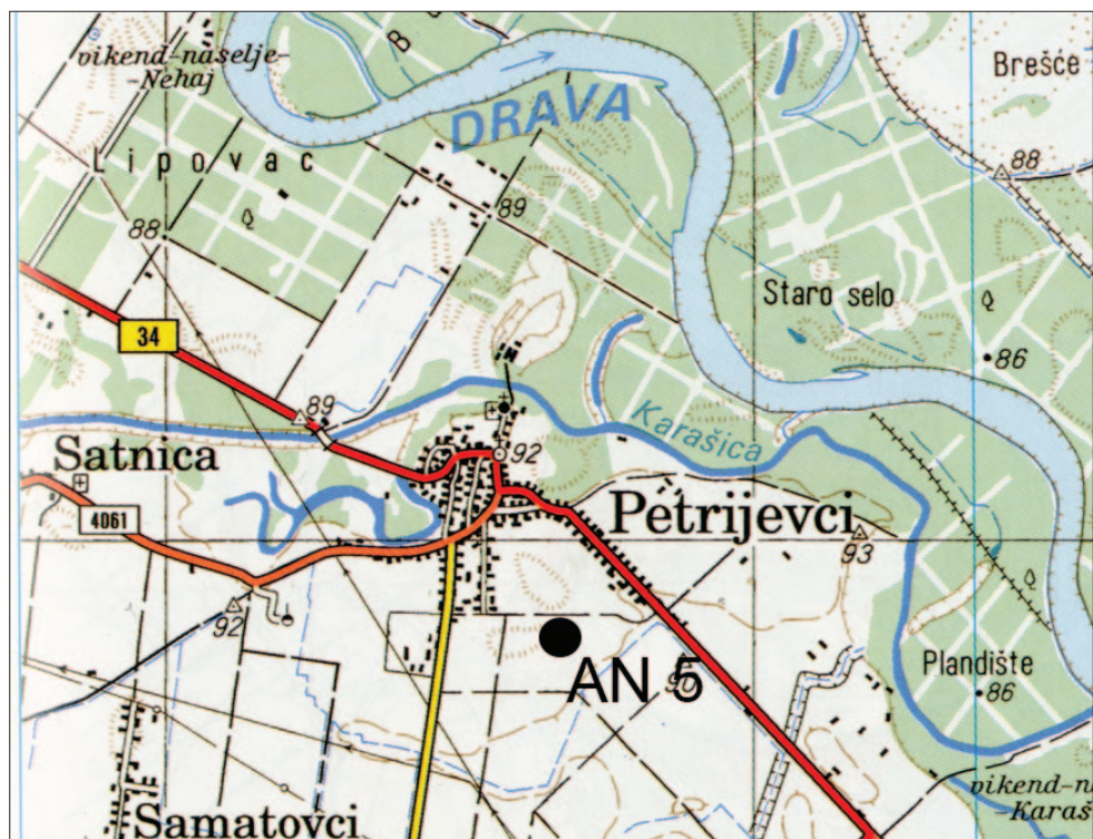
Karta 1 Položaj nalazišta AN 5 Petrijevcima – Karaševo 1 (izradio: M. Dizdar)