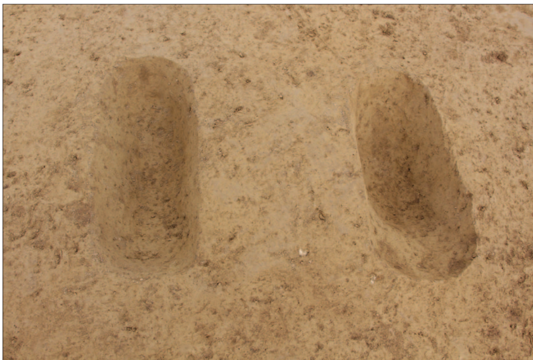
Sl. 2 Ukopi SJ 7 i SJ 9 na središnjem dijelu nalazišta