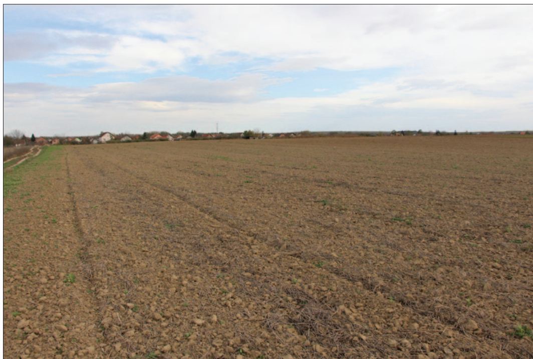
Sl. 1 Pogled na nalazište s juga