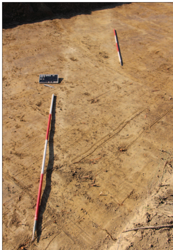
Sl. 2 Zapuna kanala SJ 4 na istočnome dijelu nalazišta Fig. 2 Ditch-filling SU 4 in the eastern part of the site

Rezultati dodatnih zaštitnih istraživanja nalazišta AN 3 Petrijevci – Španice, s pronađenim ostacima prapovijesnoga naselja, ukazuju na izniman položaj sjeveroistočnoga dijela Slavonije položenoga uz rijeku