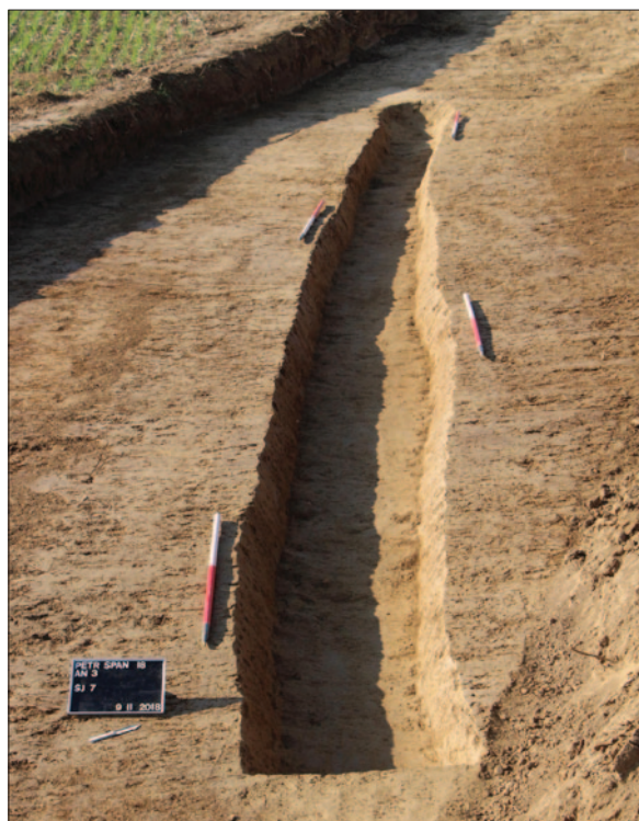
Sl. 3 Ukop kanala SJ 7 na središnjem dijelu nalazišta Fig. 3 Ditch SU 7 in the central part of the site