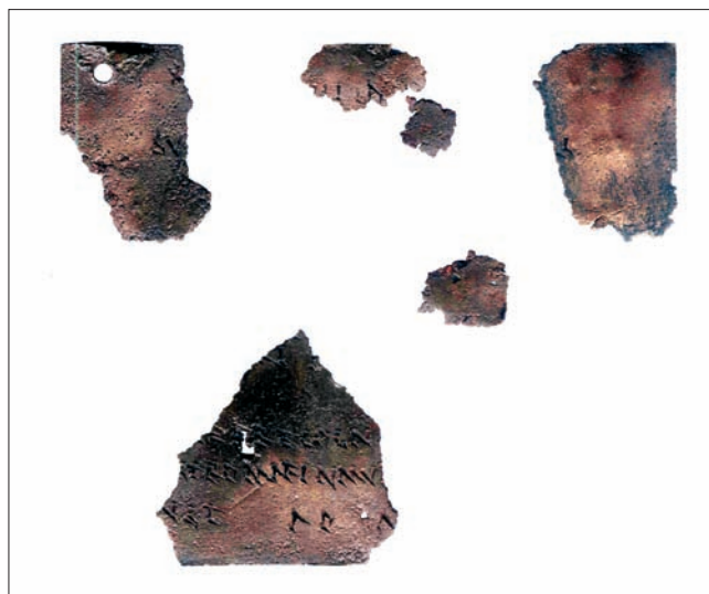
Sl. 2 Druga pločica, iznutra Abb. 2 Zweites Täfelchen, Innenseite