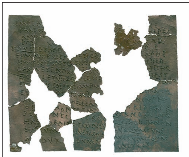
Sl. 1 Prva pločica, iznutra Abb. 1 Erstes Täfelchen, Innenseite