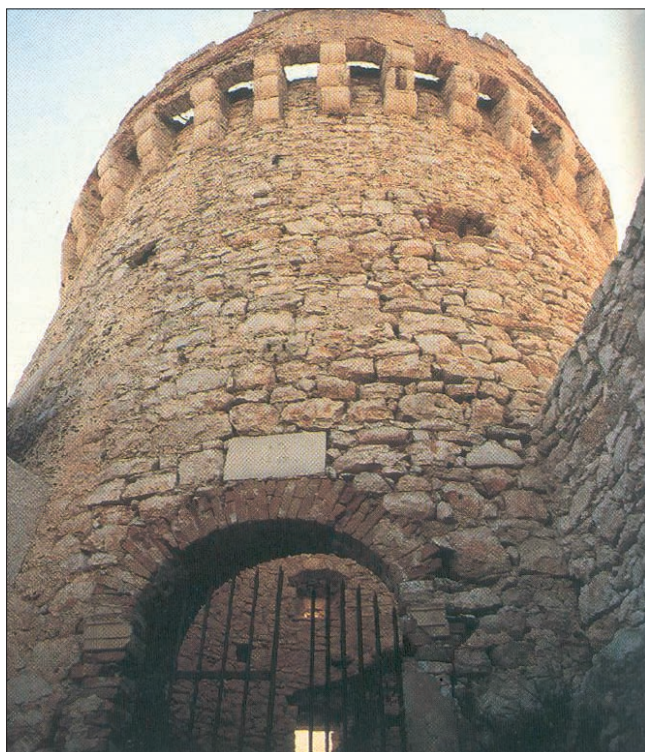
Sl. 1 Obrambena kula iz XV. st. na predjelu Kaštel u Velološinjskoj uvali