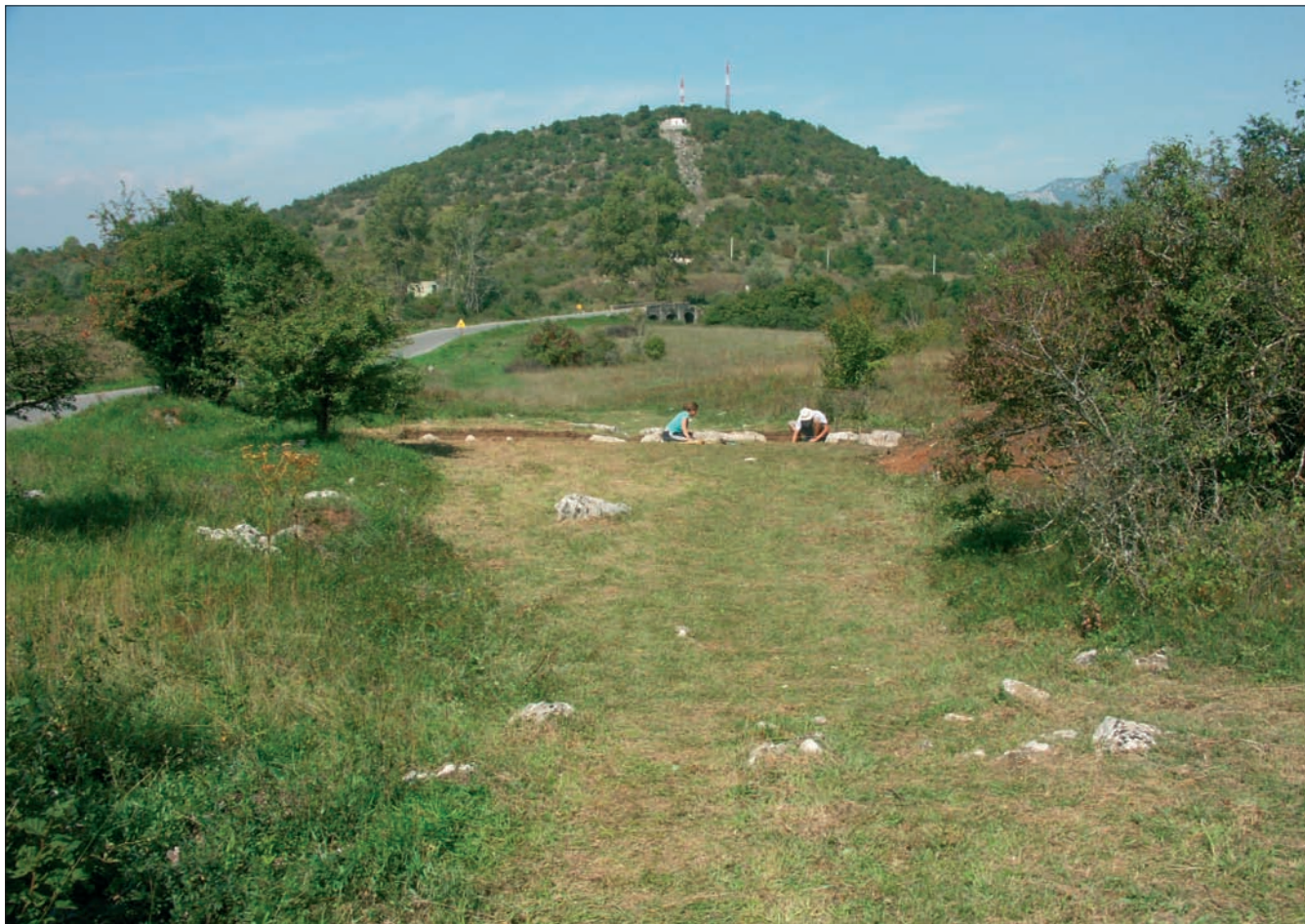
Sl. 3 Pogled s juga na gradinu Cvituša nedaleko od Lovinca u Lici prilikom istraživanja trase rimske ceste na lokalitetu "Pod Cvitušom" (snimio: B. Olujić 2006.)