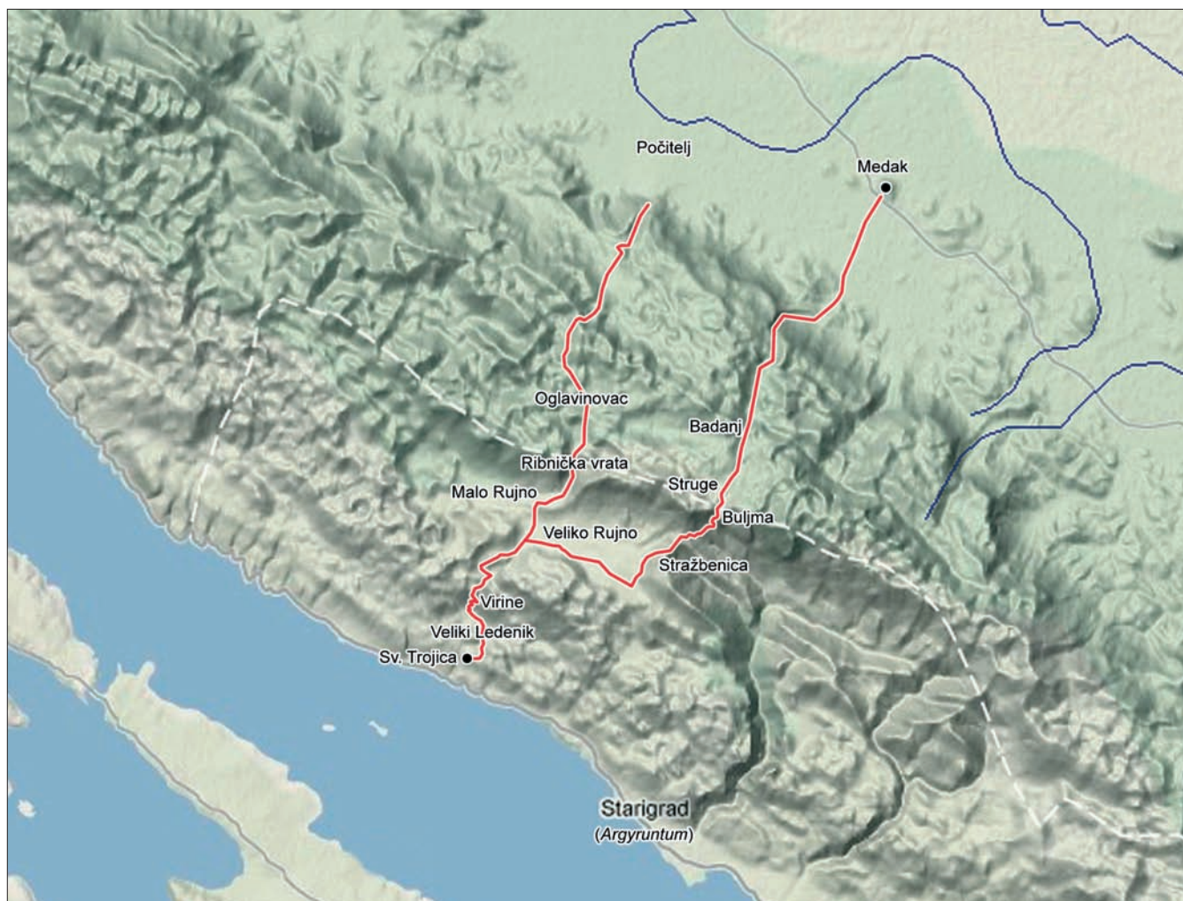
Karta 1 Pješačke staze koje vode od Gradine Sveta Trojica prema Lici (autor: V. Glavaš; obrada: D. Vujević)

Trodden path road leads from the Gradina sv. Trojica site across Ledeničko polje and Virine towards the largest arable fields on Mt. Velebit: the fields of Malo and Veliko Rujno at 900 m above sea level. There are two easy paths to Lika from the fields: one through the Ribnička vrata pass (1300 m) to the Oglavinovac pasture and then to Počitelj in Lika, and the other through the passes of Stražbenica (1130) and Buljma (1394 m) to Struge and Badanj. From there, it is easy to reach the Medak hill fort on Blitvina glavica (693 m) (Dubolnić 2006a: 27–31; 2008: 12). On the coast, at the foot of Sv. Trojica, there are two coves, Kusača and Šilježetarica, where underwater remains of an antique shipwreck have been found together with diverse archaeological material, which suggests they were used as convenient harbours for small boats. (Dubolnić 2006: 13; 2007: 34, 55). K. Patch mentions finds