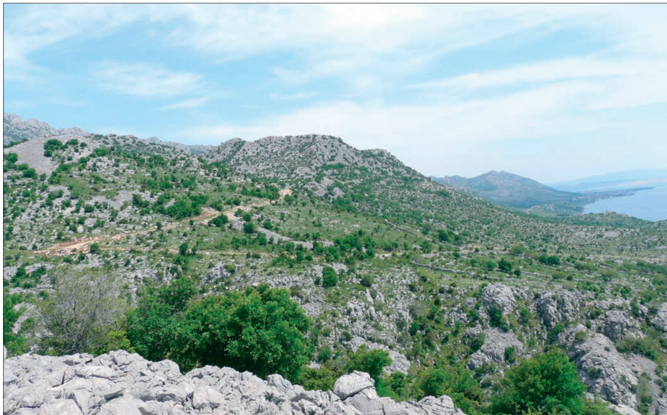
Sl. 1 Gradinsko naselje na lokalitetu Sveta Trojica, pogled sa zapada Fig. 1 Settlement on the Sveta Trojica hill-fort site, view from the west

2008. do 2010. godine kada je provedeno stručno rekonosiranje koje je rezultiralo izradom prve sustavne topografije spomenutog područja (Dubolnić 2008a: 502–504). 1 Na taj način započelo je stvaranje jasnije arheološke slike prostora koji se na prvi pogled čini potpuno napuštenim i nepristupačnim za život. Interes za Velebit i njegovu južnu padinu se nastavlja, a ovaj rad je jedan od doprinosa proučavanju spomenutog prostora.