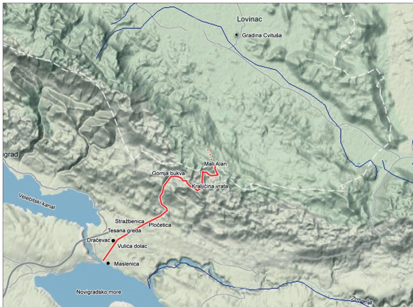
Karta 2 Položaj gradine na Dračevcu uz trasu rimske ceste koja povezuje Liku i more. Cestu su ubicirali Abramić i Colnago početkom 20. st. (autor: V. Glavaš; obrada: D. Vujević)

It takes about 7 to 8 hours of hiking, on average, to cover these routes across Mt. Velebit. When the days are longer, in the warm part of the year, and depending on the trail, walking from Lika to the coastal area of Primorje, or vice versa, may take half a day. This was how merchandise, shipped to the harbours along the coast could have been transported inland efficiently and relatively quickly (in one day). Obviou-