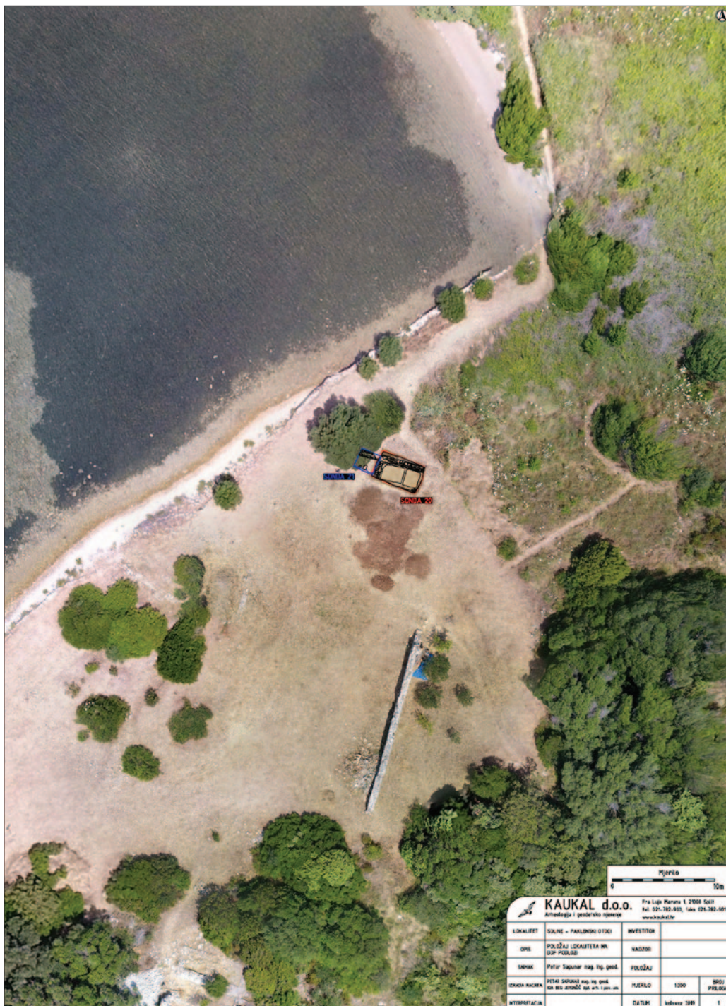
Sl. 1 Položaj sonde 20 (2018.) i 21 (2019.) u uvli Soline (izradio: P. Sapunar)