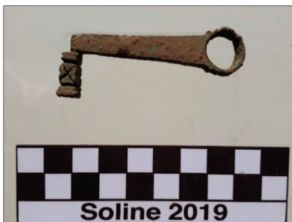
Sl. 2 Brončani ključ (SJ 21005)