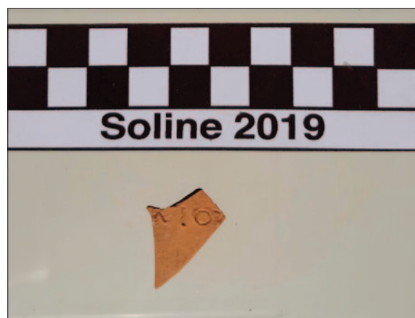
Sl. 3 Ulomak korinške lucerne s potpisom [AOY]KIOY (SJ 21009)