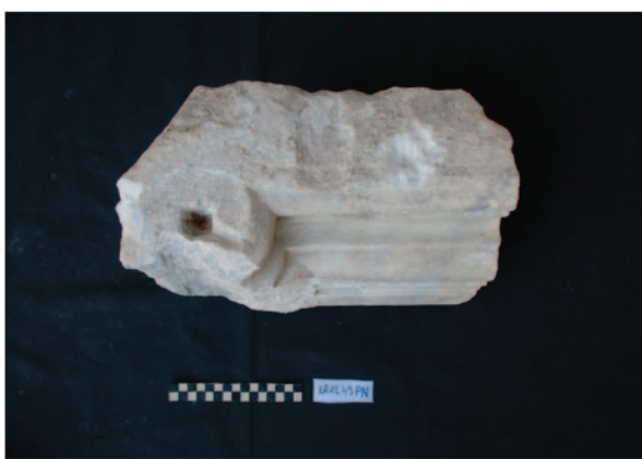
Sl. 5a2 Ulomak impost-kapitela (dokumentacija projekta) Fig. 5a2 Fragment of an impost capital (Project documentation)