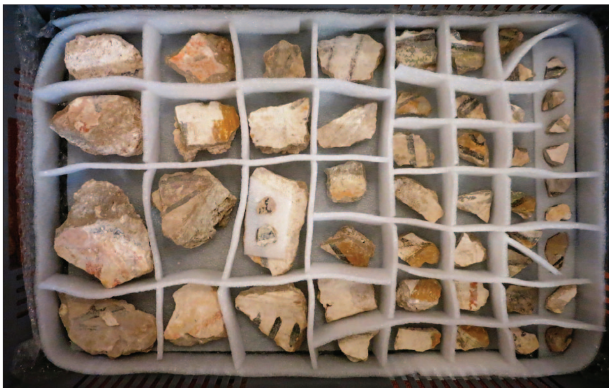
Sl. 14 Ulomci smješteni u nove kutije i zaštićeni spužvastom PE folijom (dokumentacija projekta)

Fig. 13 Dubrovnik, the underground of the cathedral. Detail of a wall painting from the nave arcades – light plaster applied to the ground substrate (Project documentation)