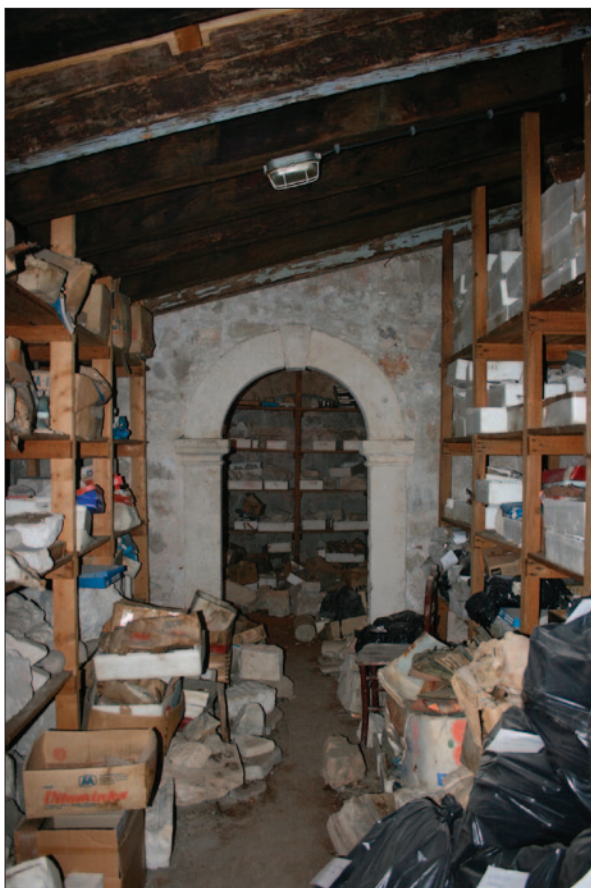
Sl. 1 Južno potkrovlje katedrale, snimljeno 2015. godine Fig. 1 South attic of the cathedral, photographed in 2015