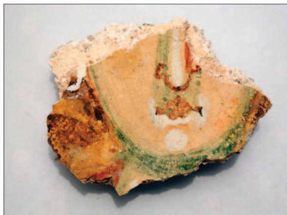
Sl. 2 Ulomak zidne slike iz južnoga potkrovlja katedrale Fig. 2 Fragment of a wall painting from the south attic of the cathedral