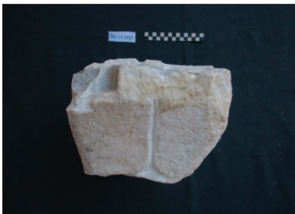
Sl. 5a1 Ulomak impost-kapitela (KA1249) (dokumentacija projekta) Fig. 5a1 Fragment of an impost capital (KA1249) (Project documentation)