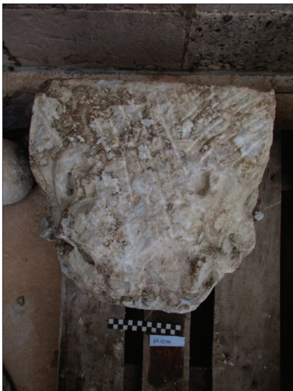
Sl. 4a Ulomak kasnoantičkoga kapitela (KA01200) (dokumentacija projekta) Fig. 4a Fragment of a late antique capital (KA01200) (Project documentation)