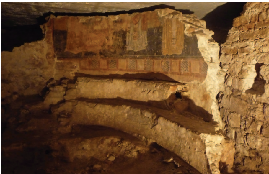
Sl. 8 Zidne slike očuvane in situ u svetištu tzv. prve crkve (podzemlje katedrale) (dokumentacija projekta)

Nesaglediva količina ulomaka zidnih slika pronađenih tijekom arheoloških istraživanja 1980-ih, od kojih je do sada dokumentirano više od deset tisuća (sl. 9), čini sustavnu obradu i analizu vrlo opsežnim i zahtjevnim poslom. Naime, iako su po pronalasku ulomci pohranjeni u kutije sa signaturama, utvrđeno je da su sadržaji kutija u većini slučajeva raznorodni, odnosno ulomci pripadaju različitim slojevima. Do tog se zaključka došlo već pregledom lica ulomka, odnosno površine na kojoj se nalazi slikani sloj. Mnoge od ulomaka na kojima se nalaze slični motivi moguće je povezati na osnovi likovnoga sadržaja, međutim, na mnogima nečitljivost likovnoga sadržaja onemogućuje klasifikaciju. Siguran dokaz o povezanosti ili raznorodnosti ulomaka može predstavljati tek usporedba žbuke intonaca na kojoj se nalazi slikani sloj. Ta usporedba pokazala je da se u kutijama s istom signaturom nalaze ulomci na različitim žbukama. Pri tom su posebnu vrijednost pokazali ulomci na kojima je sačuvano više slojeva žbuke. Moguće je razlikovati žbuke intonaca na arricciu i eventualno rinzaflu , odnosno mortu iz slojeva zidane građe te, s druge strane, u pravilu jednoslojne žbuke koje se nalaze na prethodno oslikanim ili oličenim (ponegdje u više kronološki razdvojenih naliča ) završnim