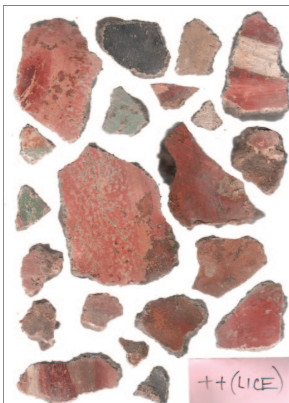
Sl. 3 Skenirani ulomci zidnih slika iz južnoga potkrovlja katedrale (dokumentacija projekta)