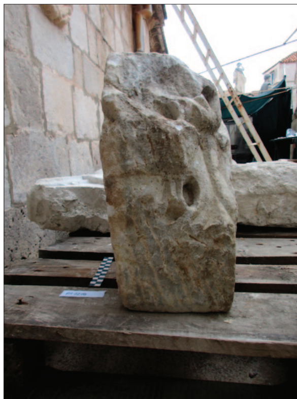
Sl. 4b Ulomak kasnoantičkoga kapitela (dokumentacija projekta) Fig. 4b Fragment of a late antique capital (Project documentation)

pohranjeni. Svi obrađeni ulomci fotografirani su i opisani u zasebnim karticama, a dodatno je kreirana digitalna baza podataka – Katalog. 19 Završetkom aktivnosti obrade kamenih ulomaka, koja se očekuje krajem 2020. godine, može se pretpostaviti da će ukupna brojka obrađenih ulomaka doseći 2300.