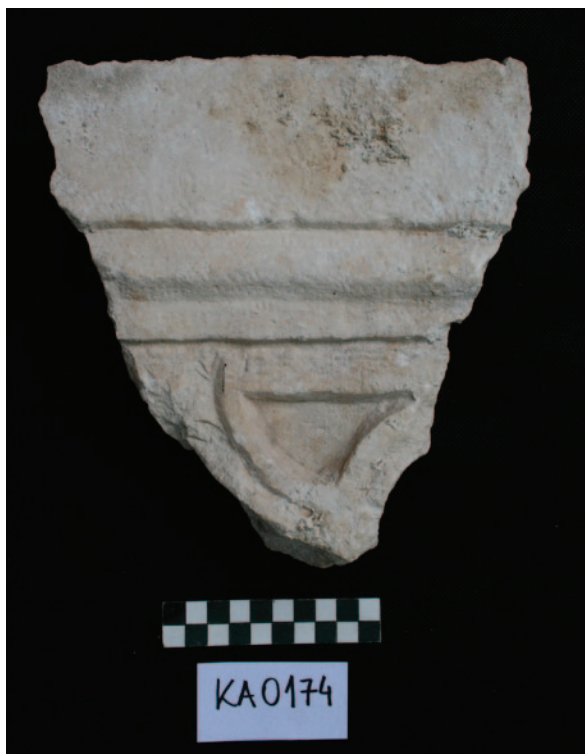
Sl. 6 Ulomak pluteja (KA0174) (dokumentacija projekta) Fig. 6 Fragment of a pluteus (KA0174) (Project documentation)

šćanske plastike, međutim, pripada i više manjih ulomaka liturgijskoga namještaja poput ulomka kamene ploče s motivom riblje ljuske koji se uobičajeno javlja kao dekoracija ranokršćanskih pluteja – KA0174 (sl. 6). Najraniji primjeri s takvim motivom sa širega prostora istočne obale Jadrana datirani su u 4. stoljeće, ali se većinom smještaju u razdoblje 5./6. i 6. stoljeća (Marin 1992: 119–121; Duval et al. 1994; Chevalier 1995: 129–132). Na osnovi