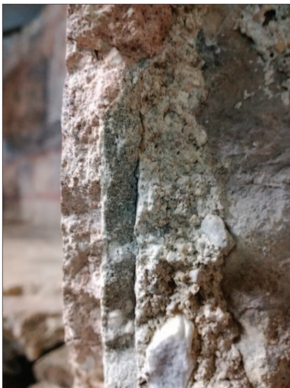
Sl. 10 Dubrovnik, podzemlje katedrale, Stratigrafija slojeva na presjeku zida apside (dokumentacija projekta)