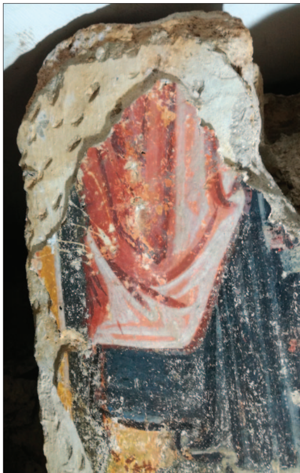
Sl. 13 Dubrovnik, podzemlje katedrale. Detalj zidne slike s arkada lađe – svijetla žbuka nanosena na otučeni donji sloj (dokumentacija projekta)

Na kraju, potrebno je istaknuti i kako su aktivnosti ALU (OKIRU) bile usmjerene i na pravilno pakiranje i zbrinjavanje ulomaka, pri čemu se vodilo računa o konzervatorskim smjernicama vezanim za brigu o arheološkim artefaktima. Tako se zbrinuti ulomci sada nalaze u čvrstim kutijama obloženim polietilenskom spužvom s ugrađenim pregradama za veće i podlogama za manje ulomke, čime je omogućen pregled sadržaja kutija već „na prvi pogled“ (sl. 14). Kutije se slažu jedna na drugu kako bi se uštedio prostor, ali istovremeno ostavila mogućnost