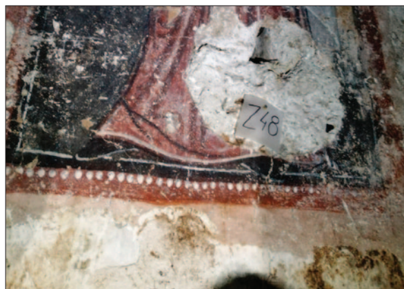
Sl. 12 Dubrovnik, podzemlje katedrale. Detalj zidne slike iz južne lađe; nepravilan i nedovršen donji rub žbuke nanese na prethodni sloj (dokumentacija projekta)