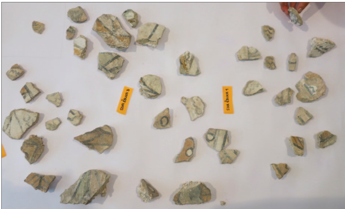
Sl. 11 Lice dijela ulomaka na sivoj žbuci (dokumentacija projekta)

postavljenom ili jasno vidljivom uzorku (biljni, geometrijski motivi, draperija itd.), s ciljem rekonstrukcije većih prizora koji bi se mogli dovesti u vezu s nalazima in situ i omogućiti potpuniji uvid u sadržaj i stilske karakteristike pojedinih cjelina. Uspoređivanje i klasifikacija uzoraka slikanoga sloja nije davala zadovoljavajuće rezultate, jer nije bilo moguće sagledati više od stotinjak ulomaka istovremeno. Stoga se, a kako bi se ujedno izbjegla mogućnost dodatnih oštećenja fizičke građe, prišlo klasificiranju prethodno skeniranih ulomaka preko njihova ispisa. Isto-