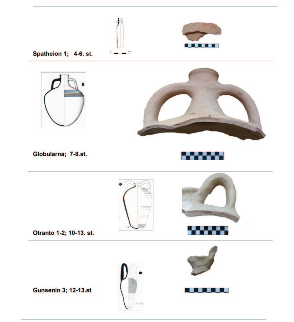
Sl. 7 Tipološka tabla najčešćih tipova amfora na lokalitetu (izradila: I. Ožanić-Roguljić)

Amfore tip Otranto (sl. 7) piriformnoga su tijela, narebrene, s trakastim ručkama koje izlaze ispod izvučenoga oboda prema zaobljenom ramenu amfore. Rub amfore je visok i koničan. Postoje i varijacije ovoga tipa amfora s ovoidnim tijelom, kratkim glom i visoko izvučenim ručkama. Datiraju se od 10. do ranoga 13. stoljeća te su proizvod južnoitalskih radionica. Tip amfora vrlo sličan ovima proizvodio se i u Korintu, no razlike između