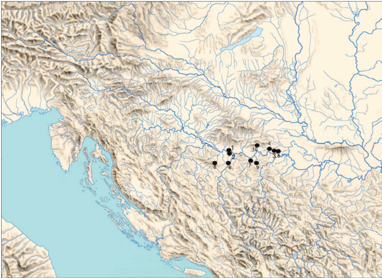
Sl. 6 Položaj Doline u slici naseljenosti srednje Posavine u mlađoj fazi kasnog bronzanog doba: 1 Dolina; 2 Donja Dolina; 3 Novigrad na Savi; 4 Stružani; 5 Jaruge; 6 Brdašca; 7 Vis; 8 Zemunica; 9 Vrela; 10 Završje (izradila: D. Ložnjak Dizdar)