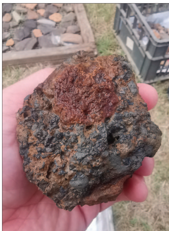
Sl. 4 Grumen željezne troske iz sjevernoga dijela latenske jame SJ 1871 s lokaliteta Nova Bukovica – Sjenjak istražene 2019.

Ako sada podvučemo crtu ispod istraživanja provedenih 2019. godine, možemo zaključiti kako je, nakon nekoliko sezona koje su bile obilježene otkrićem većih objekata iz razdoblja kasnoga brončanog doba, istraživan dio lokaliteta na kojem se češće javljaju objekti koji pripadaju mlađem željeznom dobu, odnosno, kasnolatsknoj kulturi. No, to ne mijenja u bitnome sliku prapovijesnoga Sjenjaka koju polako zaokružujemo intenzivnim arheološkim istraživanjima. Na jugoistočnoj padini laganih uzvišenja, koja se postupno spuštaju od zapada prema istoku i na kojima vršimo arheološka istraživanja, na pogodnoj terasi prije nego teren počinje osjetnije koso padati prema podvodnoj ravnici u smjeru istoka, prilično gusto raspoređeni nalaze se objekti oba prapovijesna naselja. Njihovo konstantno ispreplitanje govori u prilog činjenici da su ljudi tijekom kasnoga brončanog i mlađega željeznog doba izabrali praktički identičan položaj na kojem su osnovali naselje. Mlađe naselje na Sjenjaku barem je u jednoj fazi bilo okruženo četvrtastim kanalom kojega je, čini se, u jednom trenutku i prerasio. Arheološka istraživanja ovog ugroženog lokaliteta se nastavljaju.