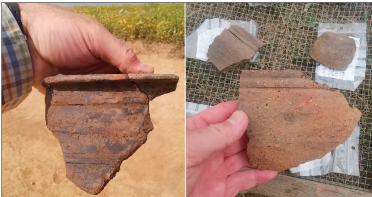
Sl. 3 Primjeri fine posude izradene na kolu (lijevo, SJ 1871/1872) te istovremene grublje posude (desno, SJ 1867/1868) iz latenskoga naselja u Novoj Bukovici (sezona 2019.)