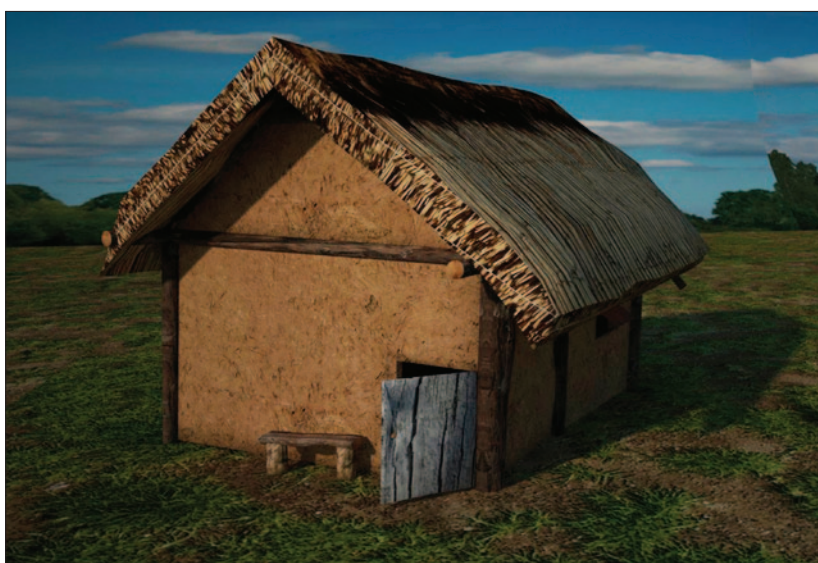
Sl. 2 Idealna digitalna rekonstrukcija kasnolateske nadzemne kuće u Novoj Bukovici čiji je tlocrt otkriven tijekom istraživanja 2014. godine (izradio: M. Mađerić)