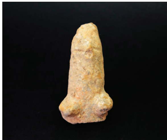
Sl. 14 Neolitička figuralna plastika Fig. 14 Neolithic sculpted figurine