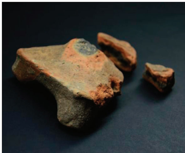
Sl. 13 Ulomci žrtvenika Fig. 13 Fragments of the altars