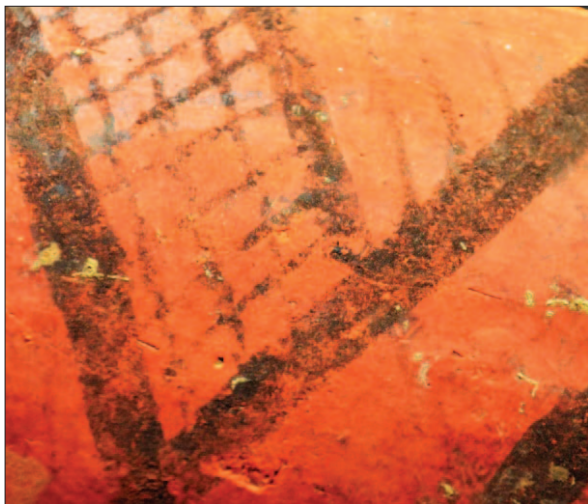
Sl. 15 Ulomak oslikane neolitičke posude

Fig. 15 Fragment of a painted vessel of the Starčevo culture