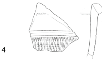
Tenja Šibljanska ada