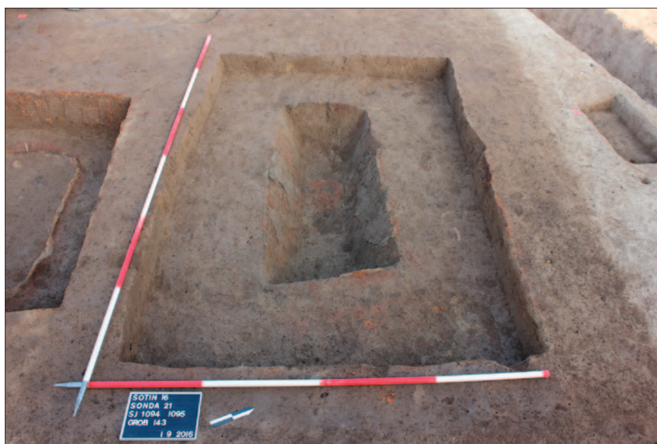
Sl. 4 Sotin – Vašarište, istočna nekropola grob 143