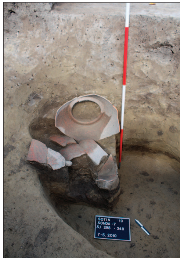
Sl. 2 Jama SJ 348 s pithosom in situ (snimio: M. Dizdar)

Jugoistočna nekropola Cornacuma nalazila se jugoistočno od jugoistočnog ruba ruba civilnoga naselja, vjerojatno uz prometnicu koja je vodila prema današnjem Tovarniku ( Ulmo ). Na položaju Jaroši u ulici Vladimira Nazora otkriveno je ukupno 29 paljevinskih i kosturnih grobova tijekom istraživanja sondi 4 i 5 2009. godine. Na ovome položaju stratigrafski su izdvojena tri horizonta pokopavanja iz 2. i prve polovice 3. st. po. Kr. Dokumentirane su tri vrste grobova: paljevinski grobovi u običnoj raci (npr. grobovi 9 i 11), paljevinski grobovi sa zapečenim stranama tipa bustum (npr. grobovi 12, 13 i 37) te kosturni grobovi u raci (npr. grobovi 30, 35, 36). Istraženi grobovi mogu se datirati u vrijeme 2. i 3. stoljeća prema priložima keramičkih posuda, svjetiljki i toaletnoga pribora. U sondi 5 otkriveni su stratigrafski odnosi među grobovima iz rimskoga vremena. Osobito je zanimljiv nalaz grobova 35 i 30 u sondi 5 gdje je paljevinski grob 35 presjekao kosturni grob 30 (sl. 3). Drugi primjer predstavlja paljevinski grob 40 koji je presjekao kosturni grob 39 i paljevinski grob 38. Kosturni grob 39 presjekao