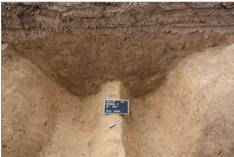
Sl. 5 Istočni profil obrambenoga rova privremenoga vojnog logora