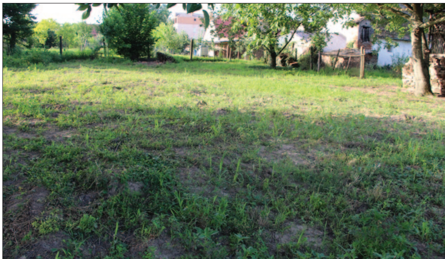
Sl. 2 Položaj sonde 7 u vrtu kuće br. 16 u Ulici A. Starčevića

Fig. 2 Position of Trench 7 in the garden of 16 A. Starčević Street