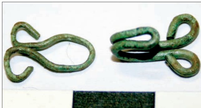
Sl. 2 Dvodijelna kopča s kukom i ušicom iz groba 14