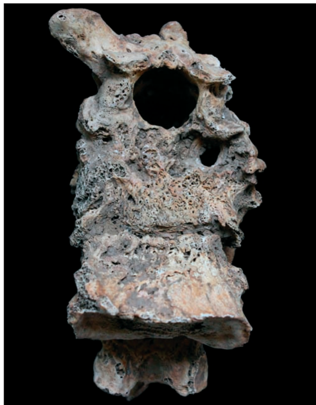
Sl. 6 Zarasli upalni proces praćen porozitetom na anteriornoj strani tijela drugoga slabinskog kralješka