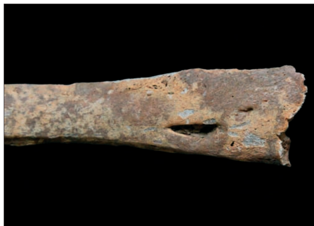
Sl. 7 Povećanje sternalnog kraja praćeno apscesom na unutrašnjoj strani osmoga lijevog rebra

In addition to the parts of the skeleton that were directly exposed to tuberculosis, changes were also documented that were indirectly caused by the presence of tuberculosis in this person. These changes are reflected in the deformed shape of almost all the ribs, especially on the left side, which