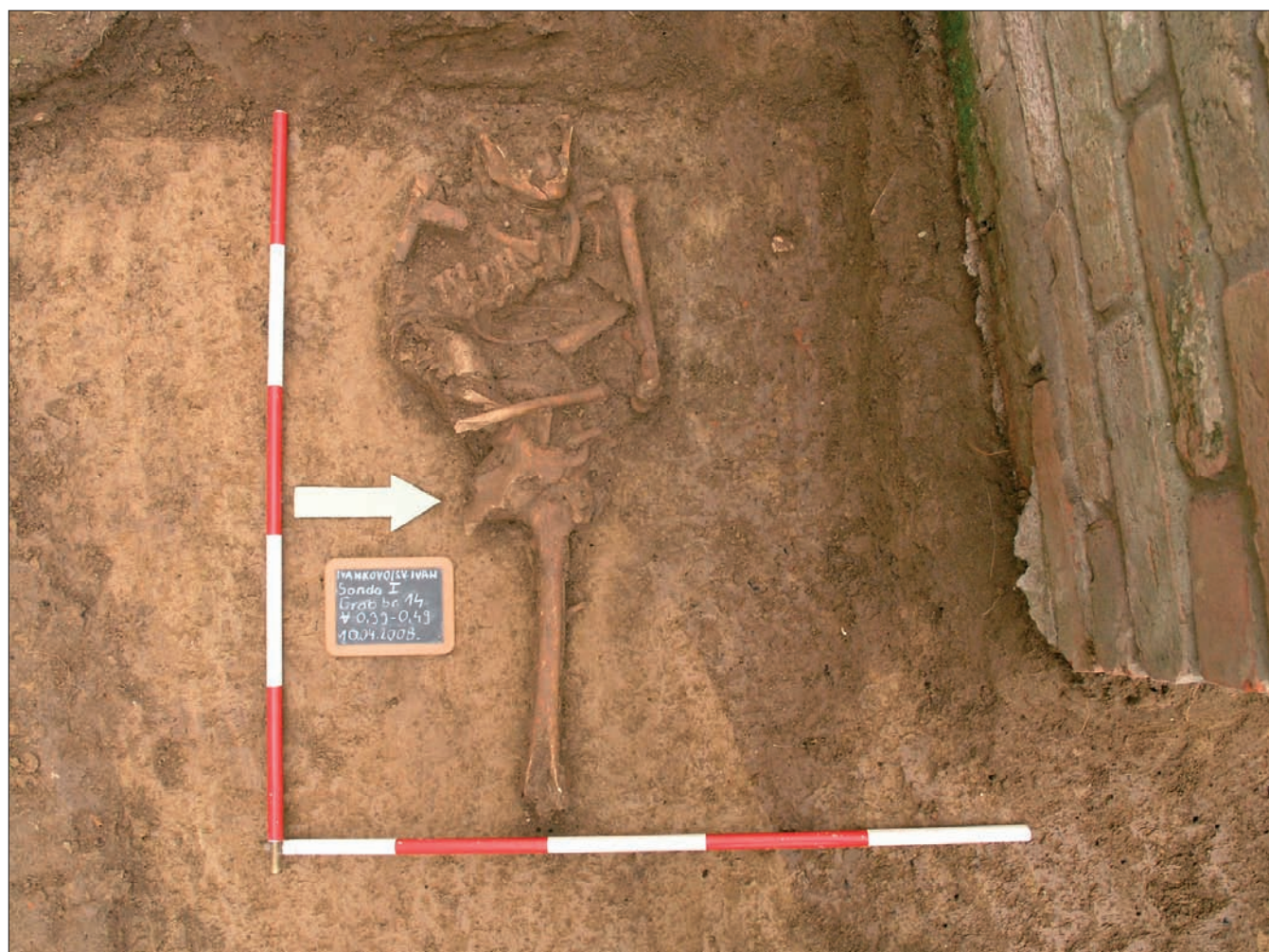
Sl. 1 Grob 14 in situ Fig. 1 Grave 14 in situ

In the 2006 construction works for the drainage of the church a trench was excavated along the length of the northern wall and around the apse at the east of the church. As no archaeologists were present when the humus and a part of the pre-virgin soil layer were removed by an excavating machine, the number of graves destroyed on that occasion is unknown. In order to prevent further destruction, a team from the Vinkovci Municipal Museum, led by Maja Krznarić Škrivanko 1 carried out a salvage archaeologi-