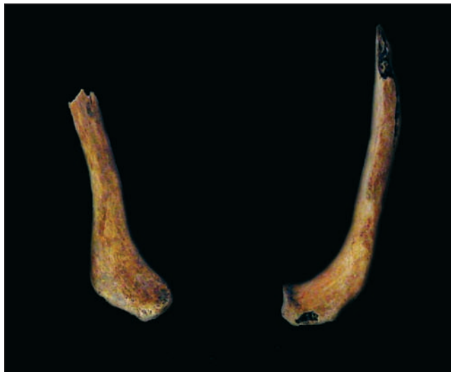
Sl. 8 Deformacija 12. lijevog rebra i usporedba s 12. desnim rebrom