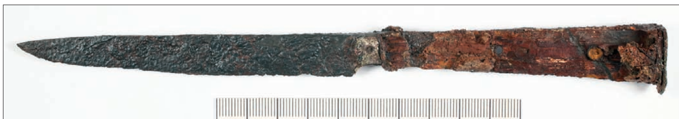
Sl. 3 Nož iz groba 19