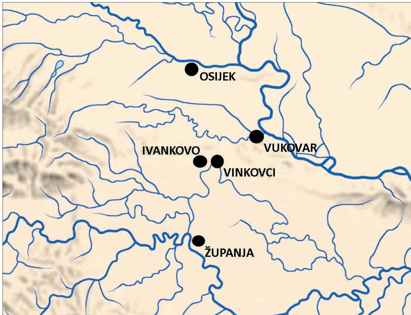
Karta 1 Geografski smještaj Ivankova (obradio: S. Krzmar) Map 1 Geographical position of Ivankovo (design by S. Krzmar)

Ivankovo village lies west of Vinkovci (Map 1). Although the earliest known historical sources about Ivankovo date from the 14 th century, they allow the conclusion that the village had existed earlier, already at the time of the Arpad dynasty (Andrić 2003). The village and its Catholic parish lived through the entire High and Late Middle Ages and the Ottoman period. In the wars for the liberation of Slavonia between 1690 and 1700 Ivankovo was destroyed and burned down and its inhabitants fled. By 1700 the situation