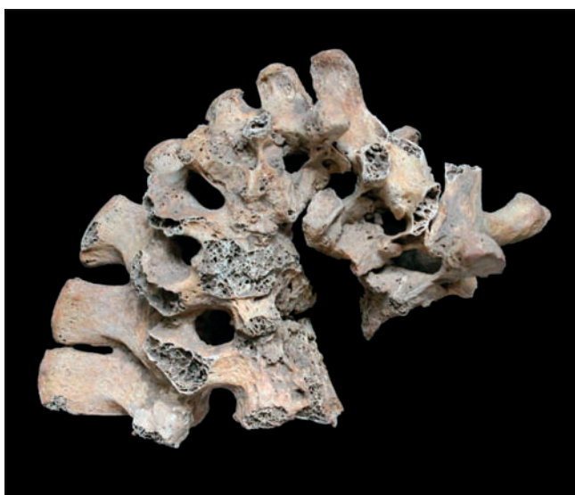
Sl. 5 Oštrokutna kifotična deformacija na prsnim i slabinskim kralješcima kao posljedica tuberkuloze

Osim dijelova kostura koji su direktno bili izloženi djelovanju tuberkuloze zabilježene su i promjene na kostima koje su indirektna posljedica pojave tuberkuloze kod ove osobe. Te promjene očituju se u deformiranom obliku gotovo