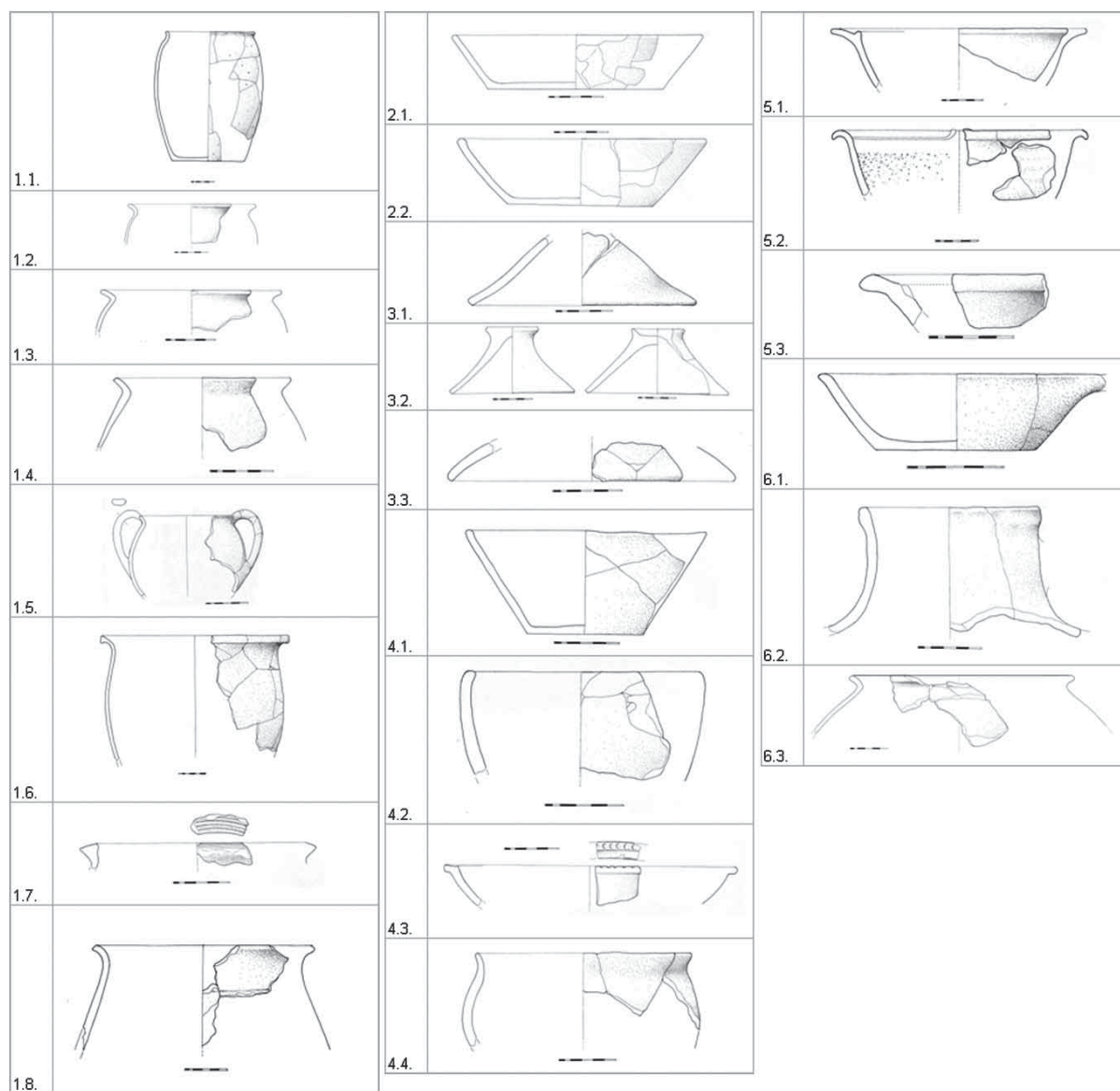
Tablica 1 Tipovi posuda s lokaliteta Virovitica – Kiškorija jug (crtež: M. Galić) Table 1 Vessel types from the site Virovitica – Kiškorija jug (drawing: M. Galić)

se selo Orešac na mjestu antičkog naselja koje je prema itinerarima i kartama prepoznato kao Boletio , odnosno mutatio Boletia ( Tabula Peutingeriana ; Itinerarium Hierosolymitanum/Burdigalense 560-563; Kukuljević-Sakcinski 1873: 108; Soproni 1980: 213). Orešac je istraživao od 80-ih godina prošlog stoljeća više puta. Ta su istraživanja pokazala da se tu nije nalazila samo stanica za izmjenu konja, već je tu postojalo i značajno naselje. Ovaj je lokalitet značajan jer je u Orešcu pronađena znatna količina keramike koja je tipološki, tehnološki i strukturalno analogna uporabnoj keramici s lokaliteta Virovitica – Kiškorija jug. Na svakom lokalitetu pronađena je keramika koja je strukturalno, tehnološki i tipološki podudarna te čini jednu cjelinu. Ta keramika čini većinu uporabne keramike na obama lokalitetima.