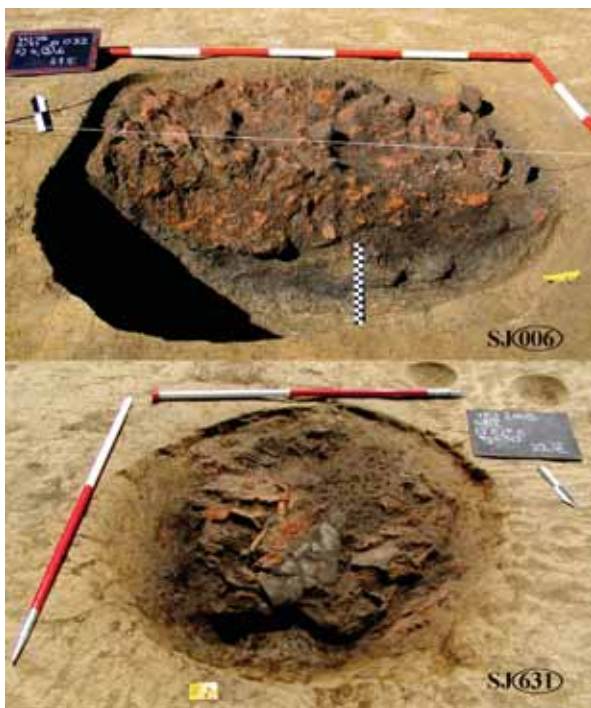
Sl. 2 Peći pronadene na lokalitetu Virovitica – Kiškorija jug

Fig. 1 View of the southern part of the site Virovitica – Kiškorija South in 2005