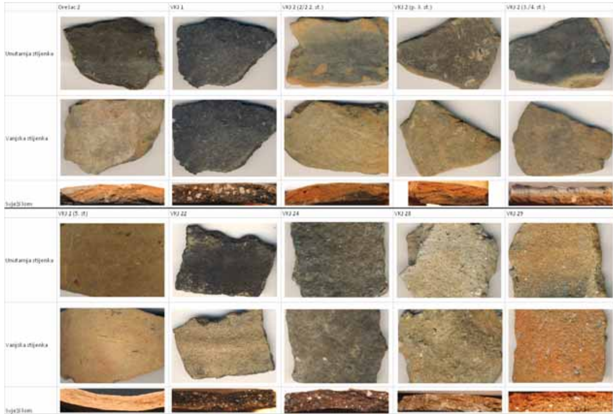
Tablica 2 Strukture keramike s lokaliteta Virovitica – Kiškorija jug i Orešac Table 2 Structure of ceramics from the sites Virovitica – Kiškorija South and Orešac

izdvajaju u zasebnu sredinu, često s njemu susjednim lokalitetima. U takvim mikroregijama uočavaju se strukturalne, tehnološke, tipološke i dekorativne podudarnosti u uporabnoj keramici lokalne proizvodnje (Jelinčić 2009a: 221-234, T. 1-153).