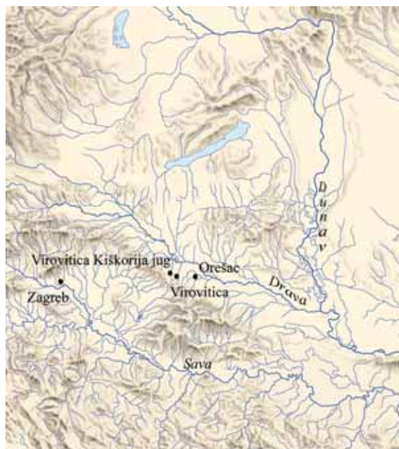
Karta 1 Položaj lokaliteta Virovitica – Kiškorija jug i Orešac Map 1 Position of the sites Virovitica – Kiškorija South and Orešac

Na trasi zapadne obilaznice grada Virovitice 2005. i 2006. godine istraženo je osam lokaliteta, a jedan od njih je Virovitica – Kiškorija jug (Karta 1, Sl. 1). Virovitica je smještena u Podravini u sjevernoj Hrvatskoj. Na lokalitetu Kiškorija jug prevladavaju nalazi iz antičkog razdoblja i dijelom iz ranog srednjeg vijeka. Antički lokalitet datira se od 2. do početka 5. stoljeća, a riječ je o ruralnom naselju. Lokalitet je smješten u neposrednoj blizini antičke ceste koja je vodila od Petovija do Murse. Naselje se sastoji od nadzemnih objekata (koliba) i zemunica. Pronađeni su također ostatci ograde, jama i ložišta peći (Sl. 2) u čijim je ložištima pronađen ugljen s ulomcima konstrukcije peći na jako zapečenom dnu. Ulomci keramike nisu pronađeni tako da namjenu ovih peći nije moguće utvrditi. Također, te peći nisu grupirane na jednom mjestu, nisu povezane i smatra se da vjerojatno nisu služile za proizvodnju keramike. Budući da se na lokalitetu nalaze i objekti iz srednjeg vijeka (8. – 10. st.), a nisu rađene 14 C analize ugljena iz samih peći,