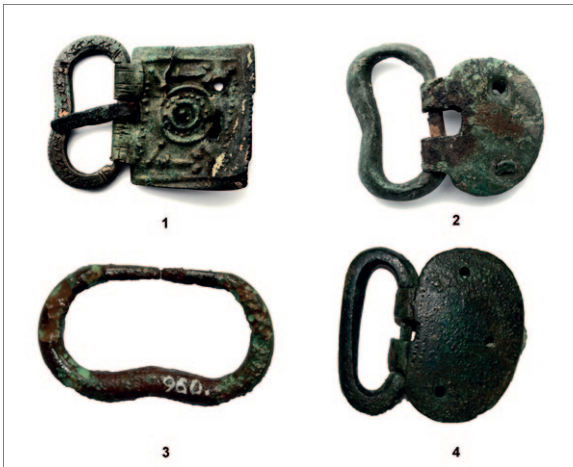
Sl. 5 1 Ljubuški – Gorica; 2 Donja Ivanjska – Glodina; 3–4 nepoznato Fig. 5 1 Ljubuški – Gorica; 2 Donja Ivanjska – Glodina; 3–4 unknown

This variant, which is very similar to variant 2, is represented by two specimens with a thin frame. On one the bar was cast as a piece with the frame (Fig. 4: 6). These were probably of local manufacture and of purely utilitarian use. Similar simple shapes of late Antique provenance have been found in Hispania (Aurrecochea Fernández 1999a: 170, Fig. 11), Vindonissa (Unz, Deschler-Erb 1997: T. 67: 1925), Ptuj (Mikl Curk 1997: 183, Fig. 1: 3) and elsewhere (Koch 2017: T. 4: 12–13). Similar specimens with a double bar have been recorded in north Africa (Boube-Piccot 1994: Pl. 17: 176–177).