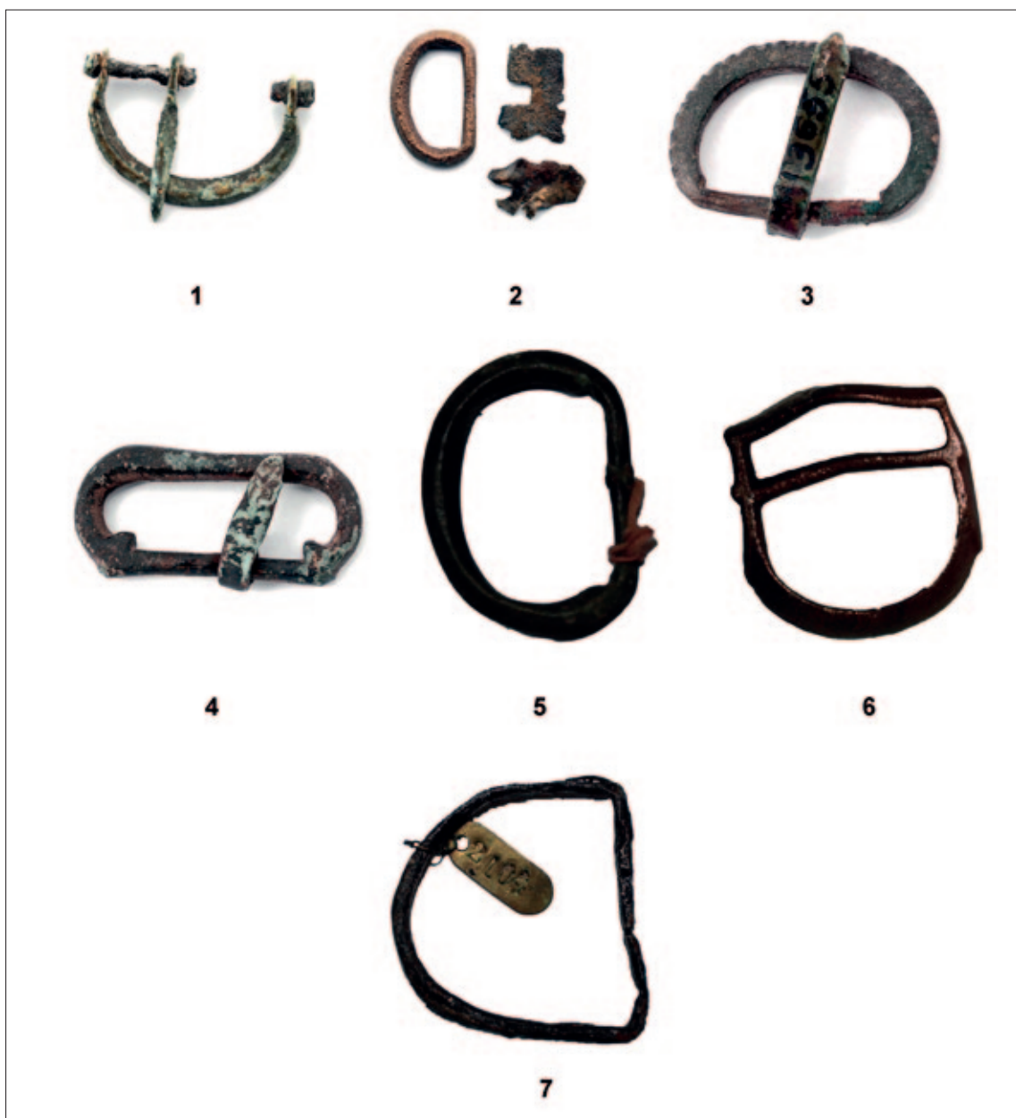
Sl. 4 1 Posušje – Gradac; 2 Rogatica; 3 Čapljina – Mogorjelo; 4 Japra – Majdanište; 5 Čapljina – Mogorjelo; 6 Travnik – Turbe; 7 Sarajevo – Ilidža