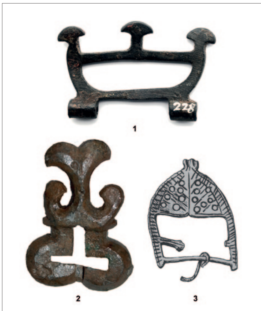
Sl. 13 1 Posušje – Gradac; 2 Travnik – Bila; 3 Mostar – Cim (1–2: snimio: A. Busuladžić; 3: prema: Anđelić 1974)