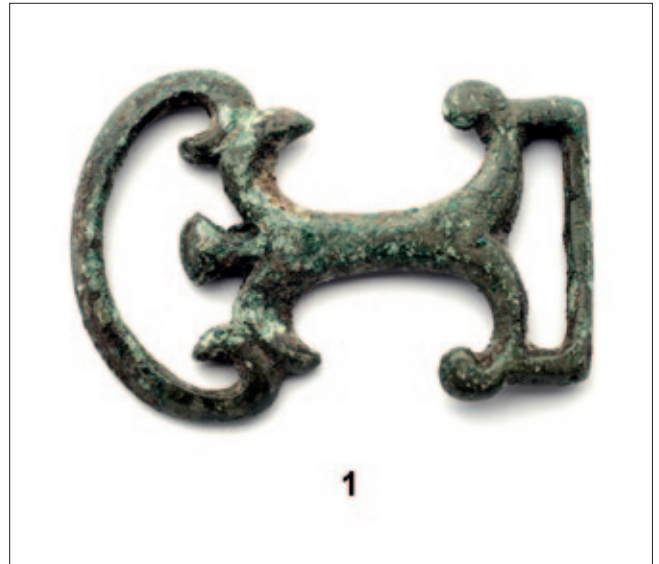
Sl. 2 Japra – Majdanište Fig. 2 Japra – Majdanište

The antique collection of the National Museum of Bosnia and Herzegovina has one specimen displaying all the characteristics of this type (Fig. 1: 1), which may be classified as type A1, for which there are numerous analogies, and probably dates from the late 3 rd to early 4 th century (Kostromichyov 2015: 311–312, 314).