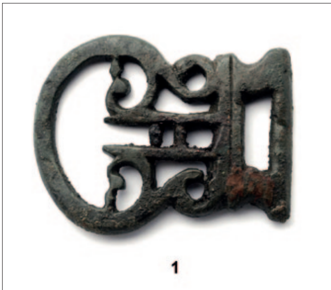
Sl. 1 Stolac Fig. 1 Stolac

U antičkoj zbirci Zemaljskoga muzeja Bosne i Hercegovine nalazi se jedan primjerak koji pokazuje sve karakteristike ovoga tipa (sl. 1: 1). Prema izvedenim podjelama, naš primjerak se može uvrstiti u podtip A1 s velikim brojem analogija te ga možemo najvjerojatnije staviti u kraj 3. i početak 4. st. (Kostromichyov 2015: 311–312, 314).