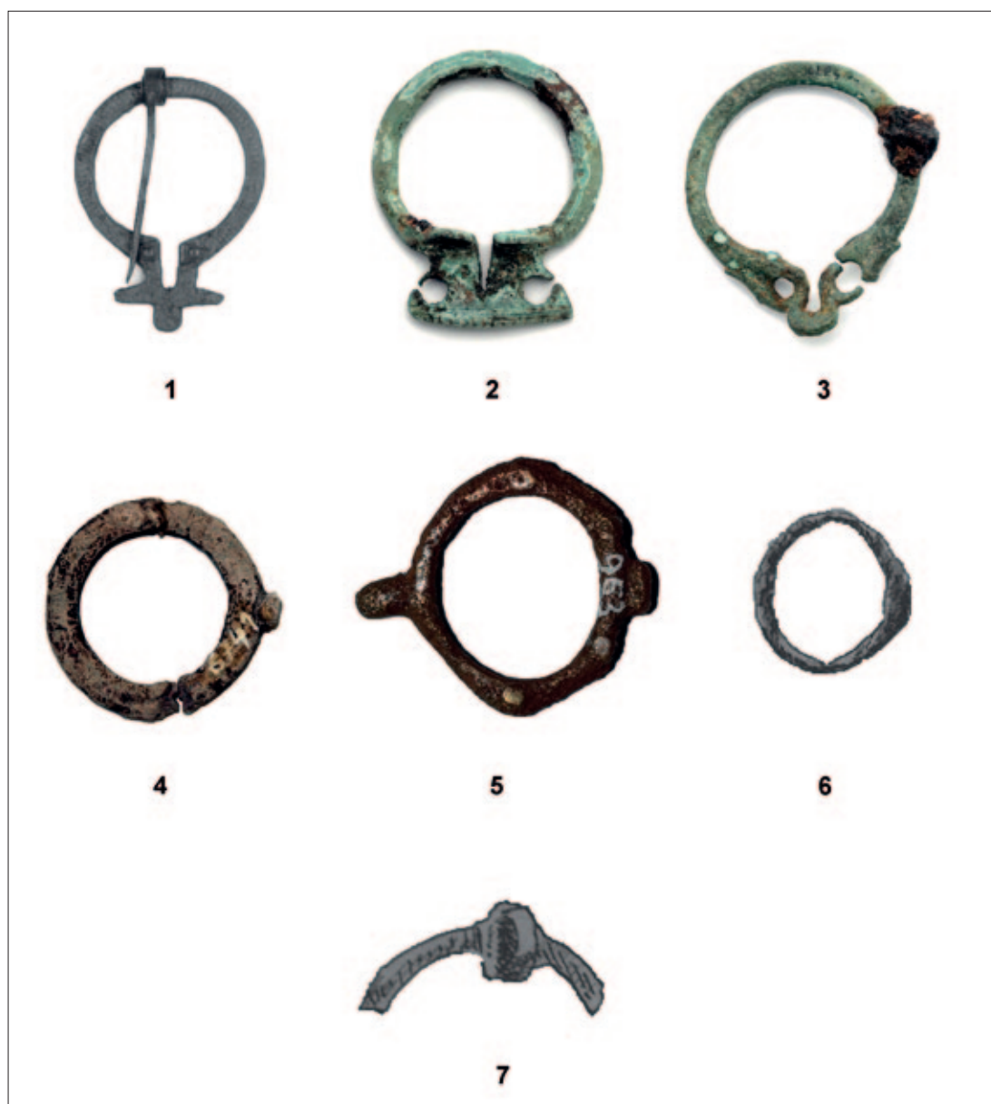
Sl. 12 1 Konjic – Bjelimići; 2–3 Japra – Majdanište; 4 Doboј – Castrum, 5 nepoznato; 6 Sarajevo – Ilidža; 7 Čapljina – Višići (snimio: A. Busuladžić)