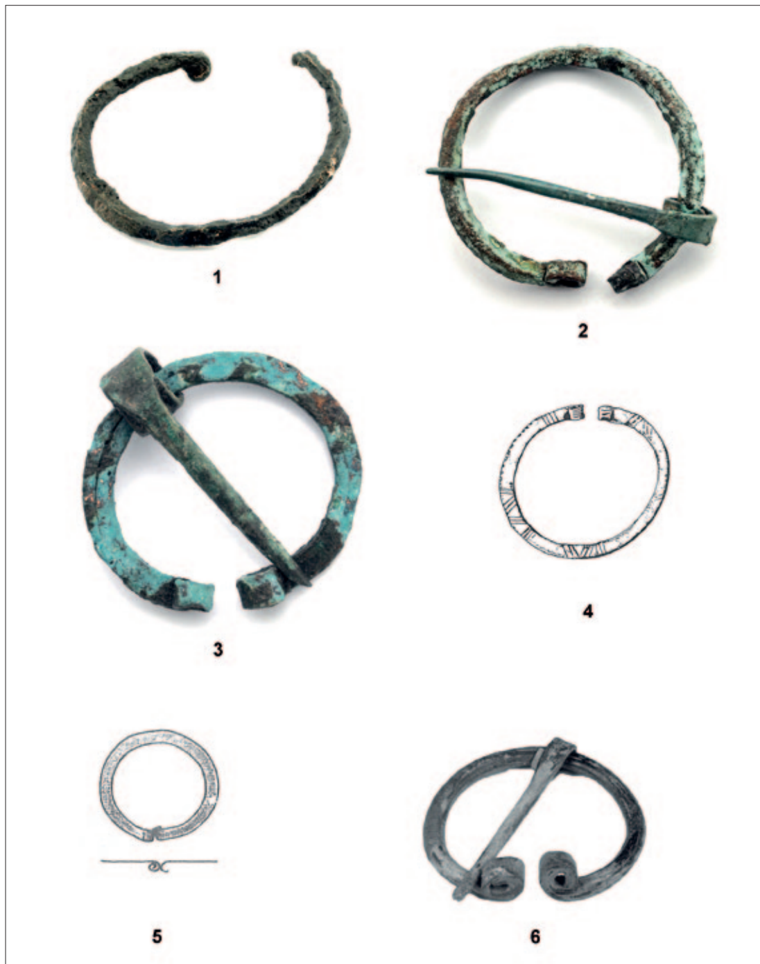
Sl. 11 1 Čapljina – Mogorjelo; 2–3 Japra – Majdanište; 4 Bileća – Panik; 5 Biograci, 6 Bileća – Plana (1–3, 6 snimio: A. Busuladžić; 4–5 prema: Čremošnik 1974) Fig. 11 1 Čapljina – Mogorjelo; 2–3 Japra – Majdanište; 4 Bileća – Panik; 5 Biograci, 6 Bileća – Plana (1–3, 6 snimio: A. Busuladžić; 4–5 prema: Čremošnik 1974)