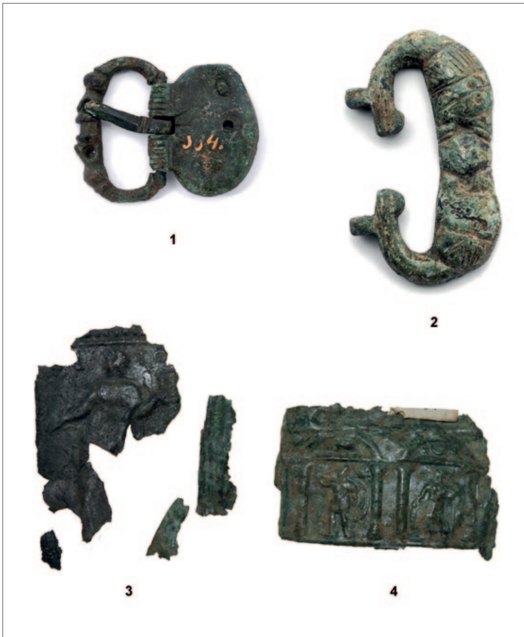
Sl. 8 1 Stolac; 2 Japra – Majdanište; 3–4 Čapljina – Mogorjelo Fig. 8 1 Stolac; 2 Japra – Majdanište; 3–4 Čapljina – Mogorjelo

Late Antique buckles with animal-head decoration on the frame typically have a pair of such heads on the frame (Koščević 1991: 68), face to face, usually at the point where the pin rests (Busuladžić 2018: 44), but in some cases at the chape end. The heads may be so stylised that it is possible only to guess at the animal they represent, but some heads are clearly of a recognisable animal: dolphins, water-birds, horse-head protome, lions, panthers, snakes, birds with outspread wings, and many other varieties of animal (Busuladžić 2018: 44). This feature is the principal structural and also decorative characteristic of this type of buckle (Redžić 2013: 163). In some cases the decorative design may also correspond to that of astragal buckles, where the