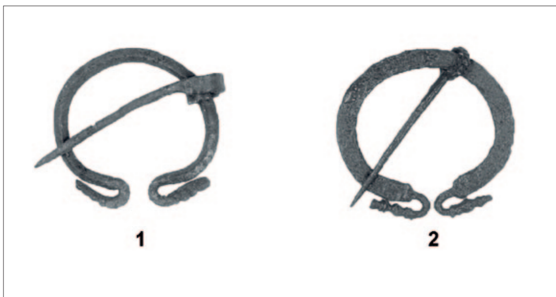
Sl. 10 1–2 Čapljina – Mogorjelo Fig. 10 1–2 Čapljina – Mogorjelo

Ages as well, evidence of unbroken occupation and the continued military presence (Werner 1961: 235–247; Miletić 1979b: 145–151). In addition to this specimen, the antiquities collection of the National Museum of Bosnia and Herzegovina has another, probably a buckle chape, from Panik near Bileća (Fig. 9: 2), highly decorated with a combination of floral and geometric motifs (Čremošnik 1974: 125). Judging from the size and fixtures of the building, and the diversity of finds, as well as the place where it was found, it probably belonged to an Italic settler (Busuladžić 2011b: 115) who almost certainly belonged to the military class, which would suggest a direct connection between this find and the military nature of the owner of both the building and the artefact itself.