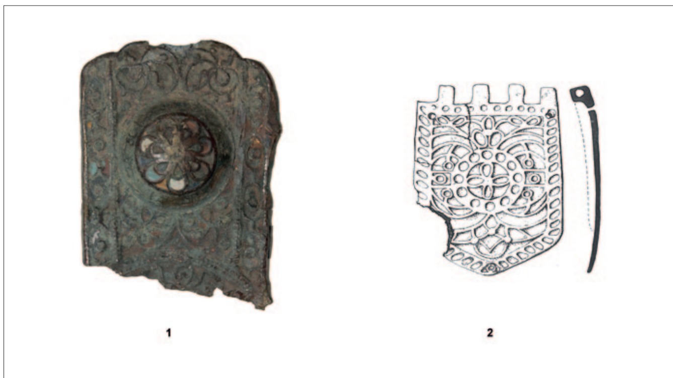
Sl. 9 1 Čapljina – Mogorjelo; 2 Bileća – Panik (1 snimio: A. Busuladžić; 2 prema: Čremošnik 1974) Fig. 9 1 Čapljina – Mogorjelo; 2 Bileća – Panik (1 photo by: A. Busuladžić; 2 after: Čremošnik 1974)

In addition to these, the collection also holds two badly damaged chapes (Fig. 8: 3–4). Though they lack the frame as the principal determinant, they have been identified as of this type of buckle based on an almost identical analogous example, particularly to our specimen (Fig. 8: 4), found in Serbia (Redžić 2013: T. XL: 359b). Generally, relief forms were not uncommon, and have also been recorded on the chapes of sword sheaths, as in an example from Vindonissa (Unz, Deschler-Erb 1997: T. 79). It should be noted here that from as early as the 1 st century, buckle chapes were very similar to strap ends, differing only in their construction, the former being jointed on the side where the chape meets the buckle (Ivčević 2010: 128). 10 Though it has been identified as a D buckle (Fig. 4: 4), it should be noted here that in this case the ends of the frame could be interpreted as a stylised animal head of indeterminate species. The extremely minimalistic treatment does not permit of any certain attribution other than by one possible analogy (Sommer 1984: T. 30: 14).