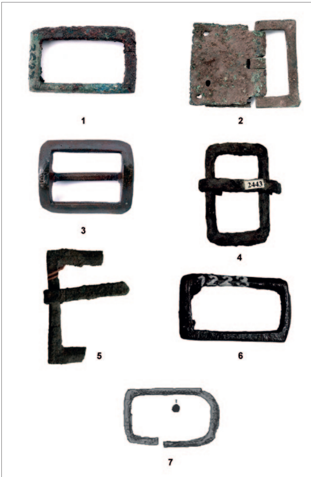
Sl. 7 1–2 Čapljina – Mogorjelo; 3 Stolac; 4 Sarajevo – Stup; 5 Čapljina – Mogorjelo; 6 Sarajevo – Ilidža; 7 Breza