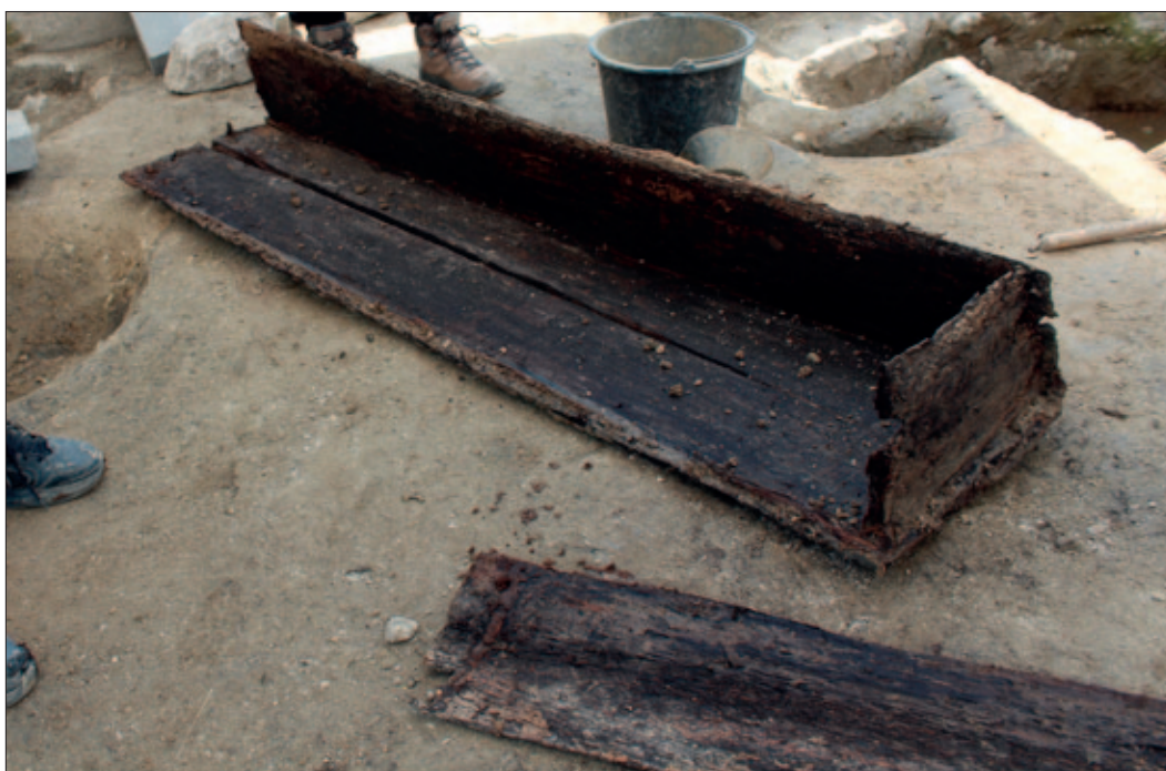
Sl. 5 Lijes iz groba 6 (snimila: V. Gligora)