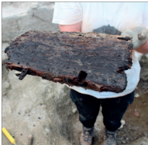
Sl. 6 Moždanik za spajanje dasaka lijesa

Plan 1 Floor plan of the final situation with marked construction phases (made by: V. Gligora)