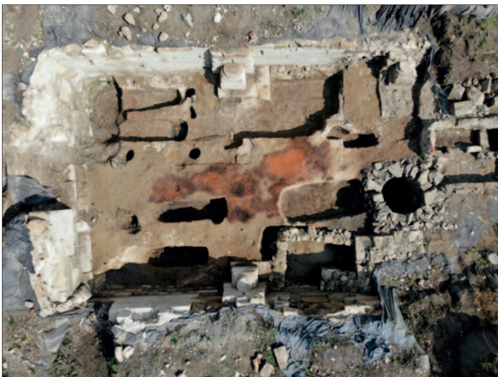
Sl. 3 Završna situacija

situacija. Na najvećem dijelu istraživane površine nalazi se sloj smeđe glinaste zemlje, koji je vrlo sličan sloju ranije otkrivenom uz sjeverni zid. Nad njim se u središnjem dijelu istraživane površine širio tanki sloj paljevine s primjesama gorane opeke (sl. 3).