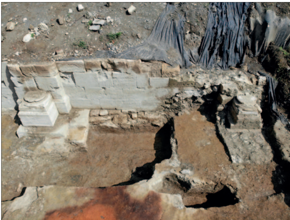
Sl. 2 Baze polustupova; lijevo baza otkrivena 2018. i 2019. godine; desno baza otkrivena ove godine, nakon uklanjanja strukture trijumfalnog luka koja ju je preslojila