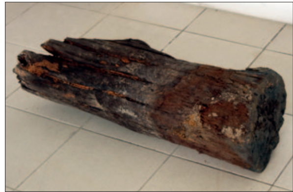
Sl. 1 Sačuvano deblo stupa

Nad ukopima ovih grobova ležale su dvije strukture mlađeg nastanka te su shodno tome uklonjene. Vjerojatno je riječ o postamentu za bazu bočnoga oltara iz kasnije faze. Možda se to dogodilo već na prijelazu iz 15. u 16. stoljeće kada je kapela značajno preuređena – zidovi su joj ojačani, dodana joj je obrambena cilindrična kula uz svetište te novi portal. Tom je prigodom i unutrašnjost kapele izmijenjena – u velikoj mjeri su otučeni polustupovi, a same baze ostale su ispod znatno podignute hodne površine, odnosno nove podnice od opeke (Belaj, Papić 2021: 518). U to isto, kasnije, doba sagrađen je – čini se – i trijumfalni luk. Njegovim zidanjem prekrivena je baza polustupa između drugog i trećeg traveja uz sjeverni zid, koja je ove godine otkrivena uklanjanjem ostataka navedene strukture (sl. 2). Baza je, iako zbog kasnijih pregradnji slabije sačuvana, identična paru baza pronađenih uz sjeverni i južni zid 2019. godine, sve su dekorirane ornamentom griffes 5 koji završava u