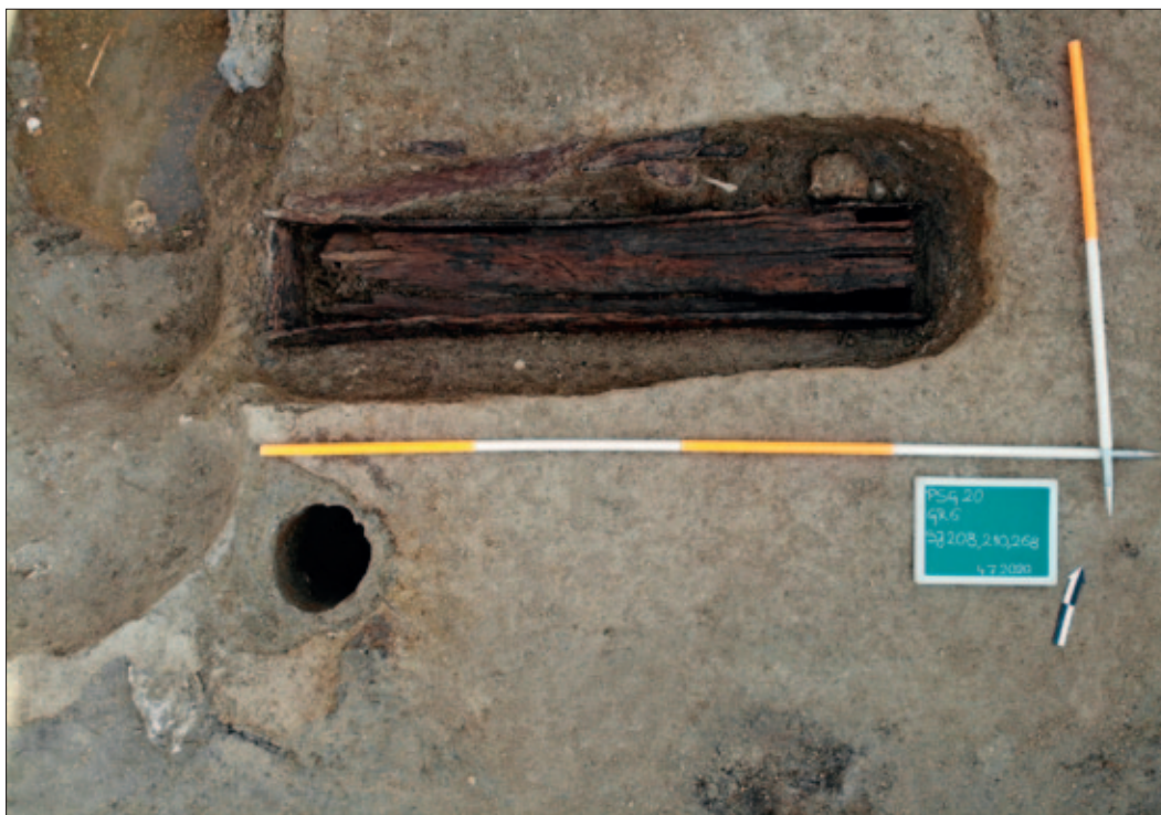
Sl. 4 Grob 6 tijekom istraživanja, u lijesu

Ostaci drvenih lijesova pronađeni su u gotovo svim grobovima, pri čemu su oni na sjevernoj polovici broda mnogo bolje sačuvani zbog veće količine vlage (sl. 4–5). Ovi lijesovi predstavljaju jedno od najvažnijih otkrića ovogodišnjeg istraživanja jer ih, prema svemu sudeći, treba datirati u razdoblje kasnog srednjeg vijeka. Nešto su širi u predjelu gornjeg dijela tijela. Sastavljeni su od jedne ili dvije veće donje daske, dvaju dugih bočnih dasaka, blago trapezoidnih uzglavnih i uznožnih dasaka te jedne ili dvije ravne poklopne daske. Konzultirajući domaću i stranu literaturu, za sada nisu pronađeni primjeri ovako dobro sačuvanih lijesova iz tog razdoblja. Vremenski i geografski najbliži nalazi dobro sačuvanih lijesova