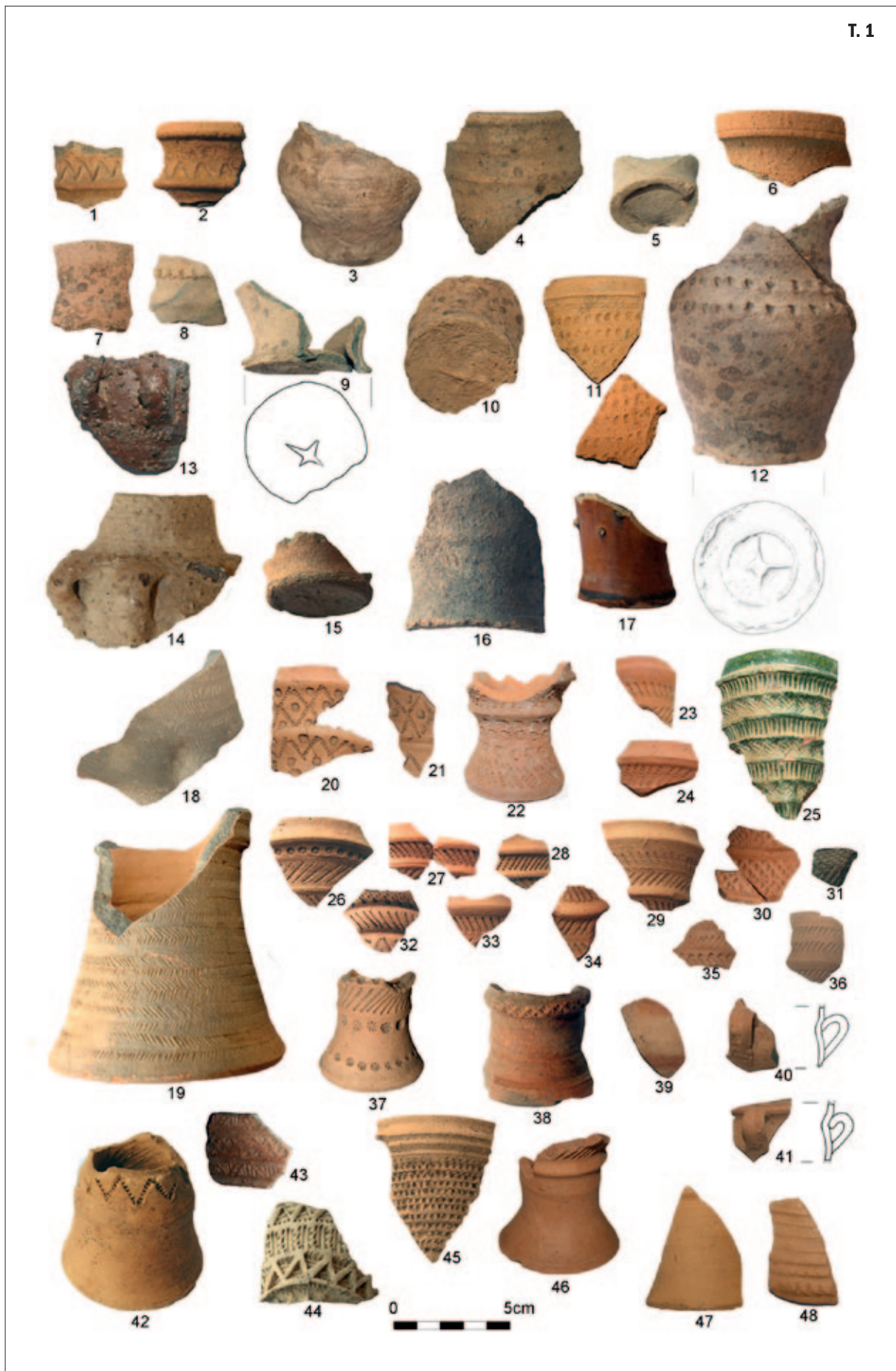
T. 1 Keramičke čaše s burga Vrbovca